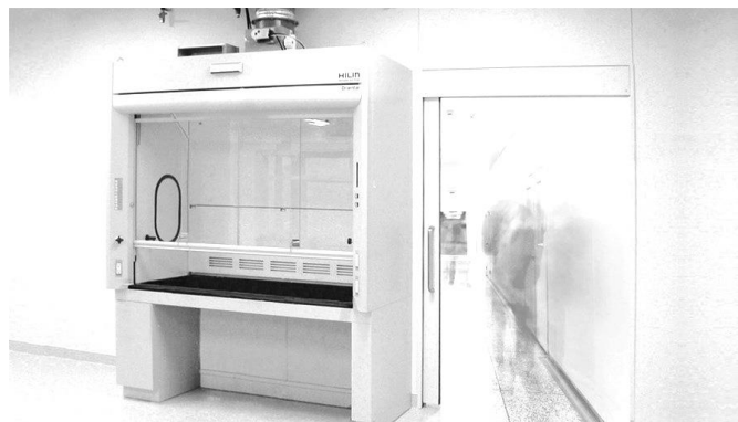
Slika 2. Digestor ( https://www.google.com/search?q=digestor , 07.09.2018.)

Lužine su u užem smislu hidroksidi alkalijskih metala (najčešće se koriste natrijeva, kalijeva i litijeva lužina), a u širem smislu to su sve tvari koje u vodenoj otopini povećavaju koncentraciju OH- iona tj. povisuju pH vrijednost. Ipak, uobičajeno je da se takve tvari zovu baze a ako su to baze alkalijskih metala onda ih tradicionalno zovemo lužinama. Nagrizaju kožu te se njima treba vrlo oprezno rukovati. Najpoznatije jake lužine (baze) su natrij-hidroksid i kalij-hidroksid i najviše se upotrebljavaju u industriji sapuna i viskoze dok se kalcij-hidroksid upotrebljava u građevinarstvu i kemijskoj industriji. Kalcij-hidroksid sporije nagriza kožu, ali je za oči jednako opasan kao i jake lužine. Pri radu s lužinama moraju se nositi zaštitne naočale i rukavice. Amonij-hidroksid je slaba lužina, dobiva se otapanjem amonijaka u vodi, a čak i koncentrirane otopine slabo nagrizzaju kožu, ali su pare amonijaka jako štetne za oči i dišne organe te se pri radu s amonijakom obvezno treba raditi u digestoru