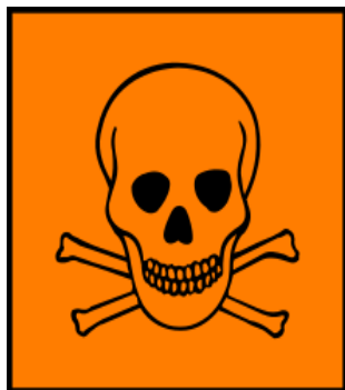
Slika 5. Prikaz simbola za otrov ( https://www.google.com/search?q=simbol+za+otrove , 07.09.2018. )

Znakom za otrovnost (T) i simbolom označavaju se otrovi iz Skupine II, simbol je prikaz mrtvačne crne glave na narančastoj podlozi. Pokraj znaka se stavlja natpis „otrov“