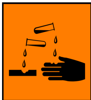
Slika 7. Prikaz simbola „korozivnosti“

Znakom za korozivnost (C) i simbolom označavaju se otrovi koji u dodiru s organskim i anorganskim tvarima izazivaju njihova oštećenja. Simbol je crne boje na narančastoj podlozi.