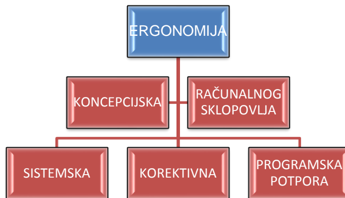
Slika 2. Pet osnovnih vrsta ergonomije

Postoji više vrsta ergonomije, pa s time možemo ergonomiju podijeliti na pet osnovnih što slijedi, slika 2.