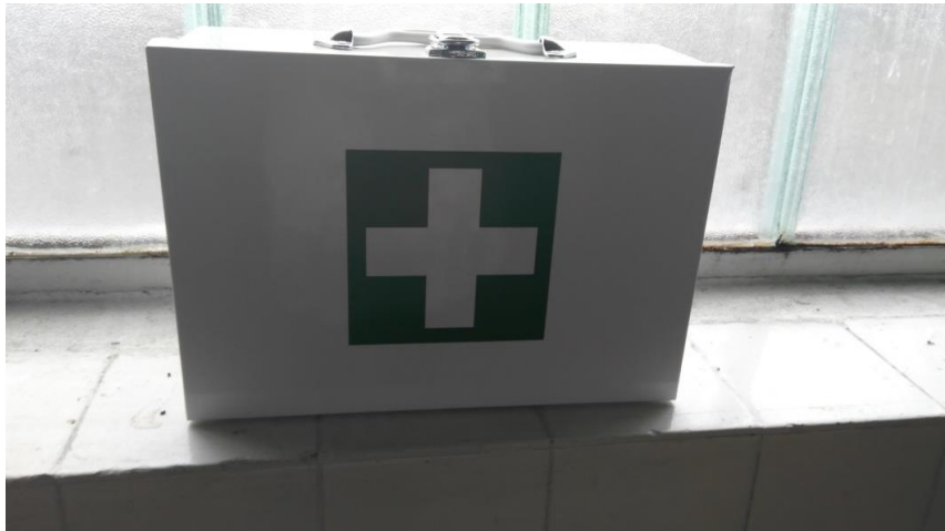
Slika 5. Kutija prve pomoći

Na slici je vidljiv i izgled kutije prve pomoći