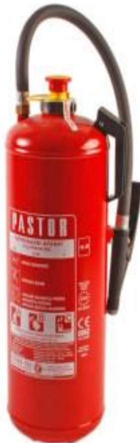
Slika 6. Aparat za gašenje od požara

Aparati pod pritiskom se najčešće koriste. Aparati sa punjenjem se ne koriste tako često, najčešće se koriste u industrijskim postrojenjima. Oni imaju prednost jednostavne i brze dopune, što omogućava operateru da otpusti supstancu za gašenje, napuni ga i vrati na vatru u razumnom roku. Za razliku od aparata pod pritiskom, ovi aparati za gašenje požara koriste kompresovani ugljen - dioksid umjesto azota, iako se azotna punjenja koriste na niskim temperaturama. U daljnjem tekstu sljedi slika aparata za gašenje.