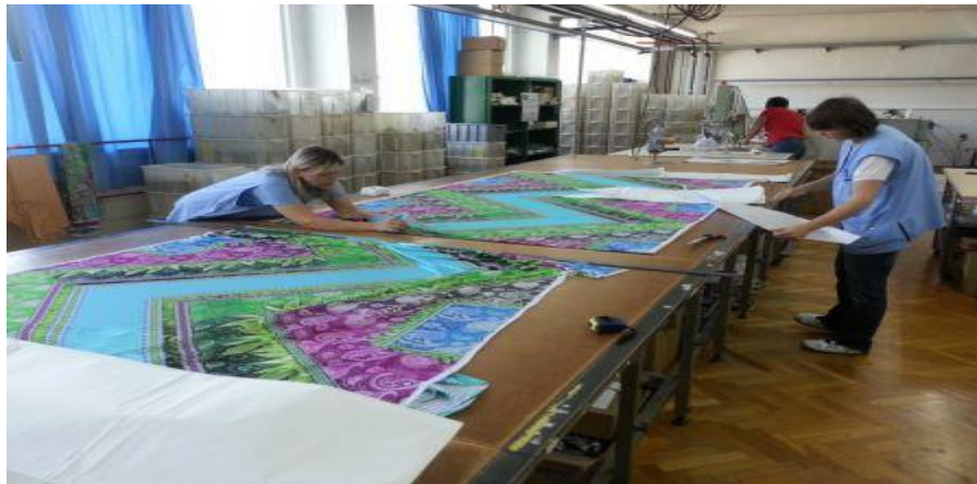
Slika 1. Polaganje krojnih naslaga

Pri krojenju se koriste stabilni noževi za krojenje tekstila i ručni prijenosni nož .