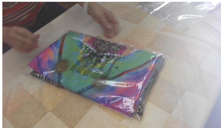
Slika 3. Pakiranje gotovih proizvoda

Adjustiranje i pakiranje se u ovom poduzeću sastoji od opremanja proizvoda zahtijevanim privjesnim etiketama i naljepnicama, slaganja na određene dimenzije i pakiranja u vrećice, kartonske kutije ili vješanja na vješalice.