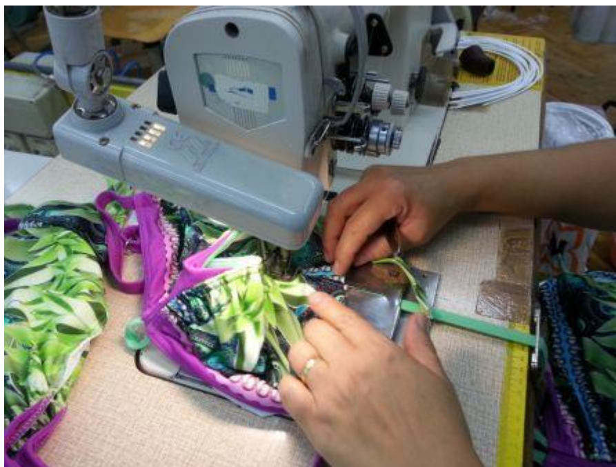
Slika 2. Operacija šivanja

Sljedeća faza nakon šivanja je kontrola gotovih proizvoda u kojoj se vizualnom metodom uz dodatna pomagala utvrđuje ispravnost i funkcionalnost gotovih proizvoda koji moraju odgovarati zadanim mjerama i zahtjevima kupaca. Proizvodi koji ne zadovoljavaju šalju se na popravak, a ispravni proizvodi šalju se na zadnju fazu u procesu, a to je adjustiranje i pakiranje.