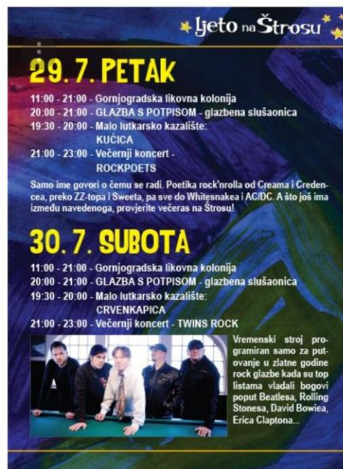
Slika 10.: Primjer programa Ljeto na Strossu