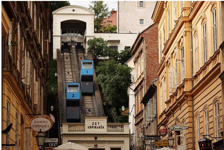
Slika 12: Zagrebačka uspinjača