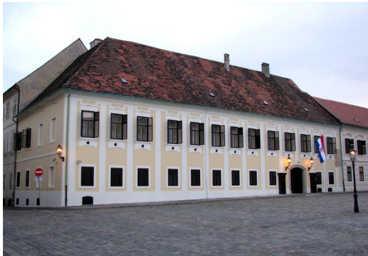
Slika 6.: Banski dvori