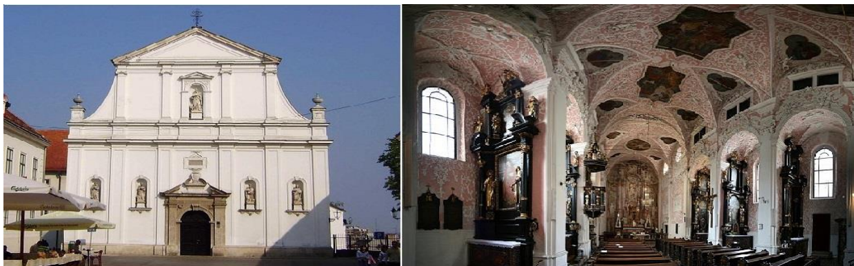
Slika 2.: Crkva Svete Katarine Aleksandrijske i njezina unutrašnjost