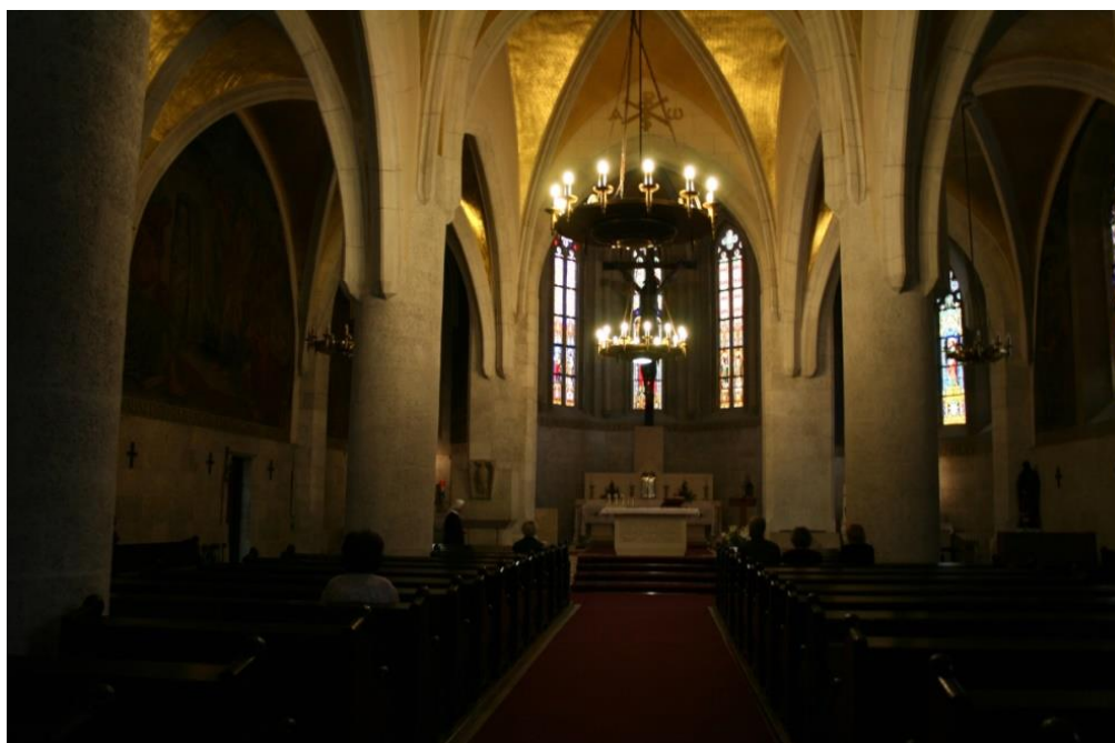
Slika 4.: Unutrašnjost crkve Svetog Marka