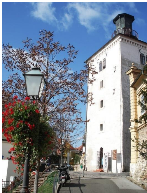
Slika 1.: Kula Lotrščak