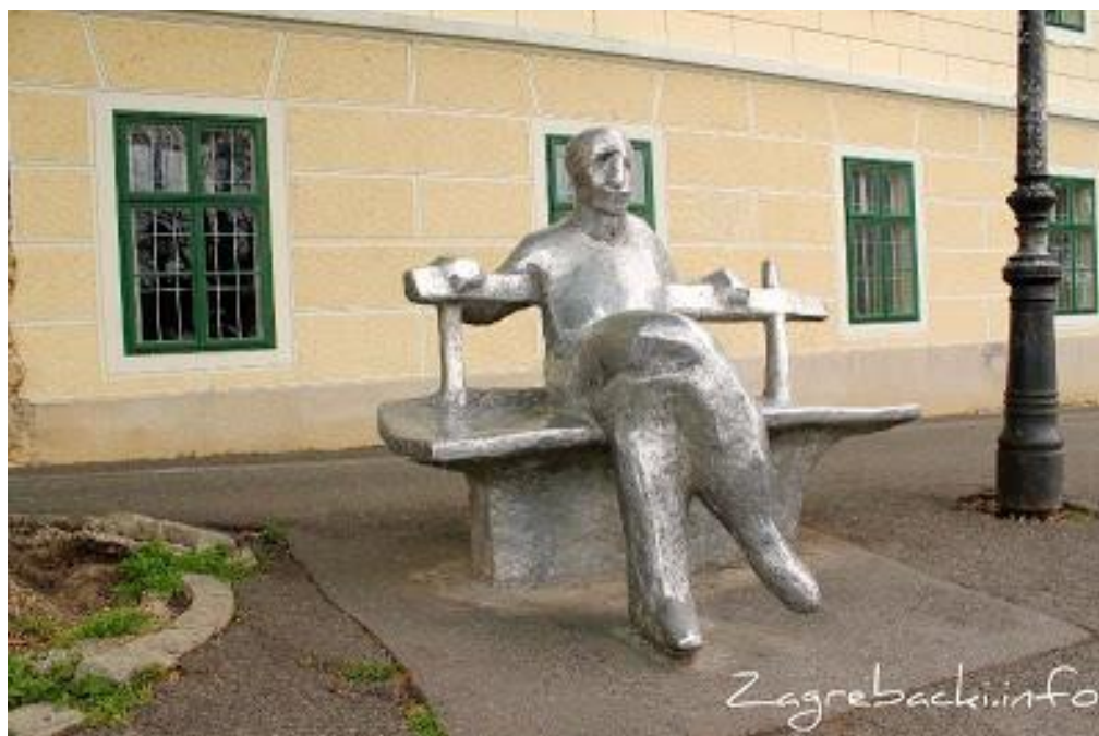
Slika 13.:Skulptura Antuna Gustava Matoša