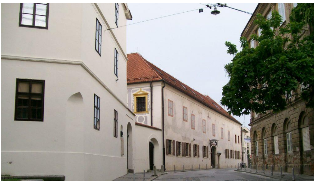
Slika 9.: Muzej grada Zagreba