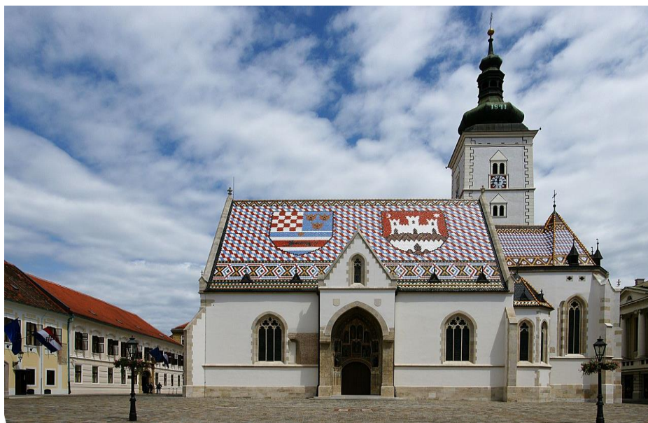
Slika 3.: Crkva Svetog Marka