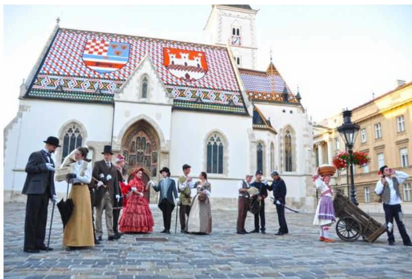
Slika 8.: Zagrebački vremeplov