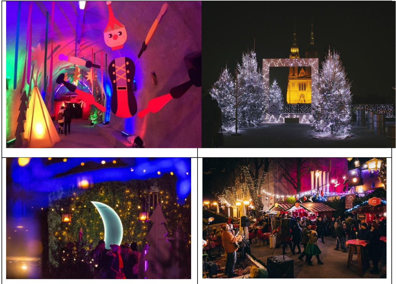
Slika 11.: Advent na Gornjem gradu