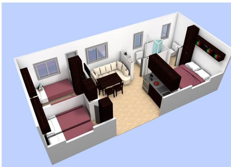
Slika 5.: Mobilna kućica "Aria"