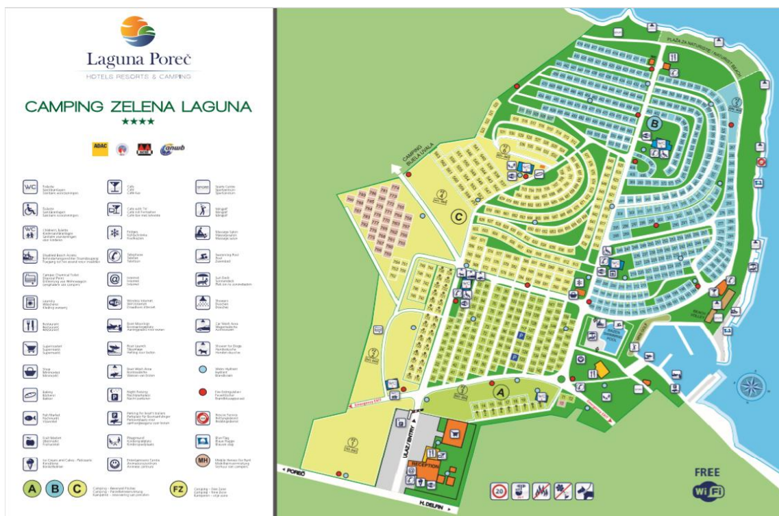
Slika 7: Plan kampa „Zelena Laguna“