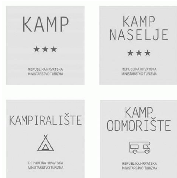
Slika 2.: Grafička rješenja standardiziranih ploča za pojedine vrste kampa