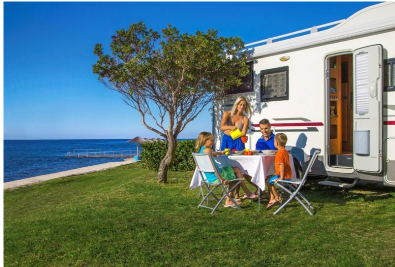
Slika 6.: Kamp „Bijela Uvala“