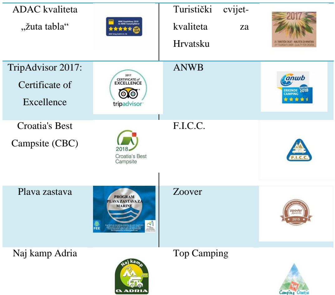
Tablica 7.: Nagrade i priznanja kampa „Bijela Uvala“

Izvor: Vlastita izrada studenta na temelju stranice Laguna Poreč, www.lagunaporec.com (20.08.2018.)