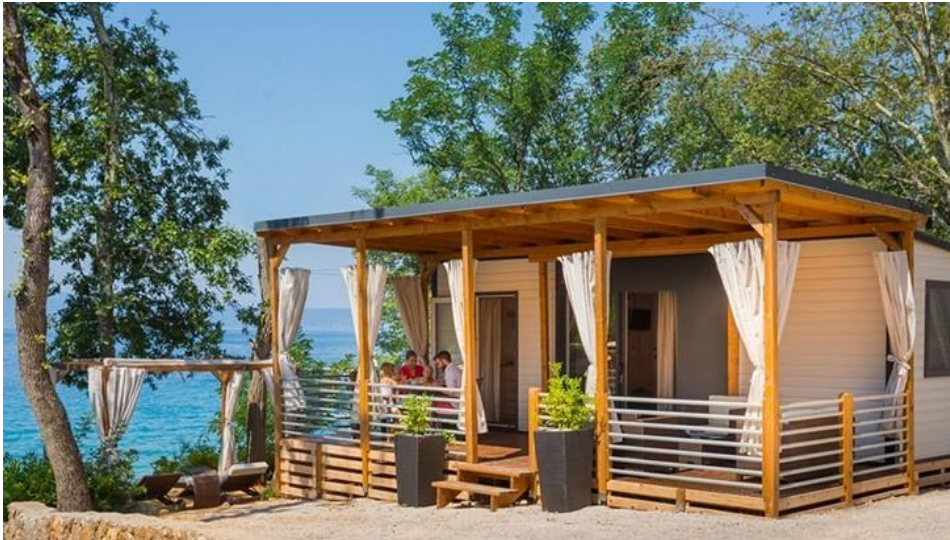
Slika 3.: Mobilne kućice