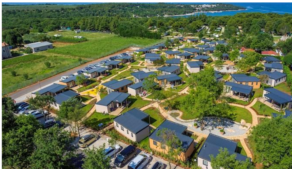
Slika 1.: Kamp naselje