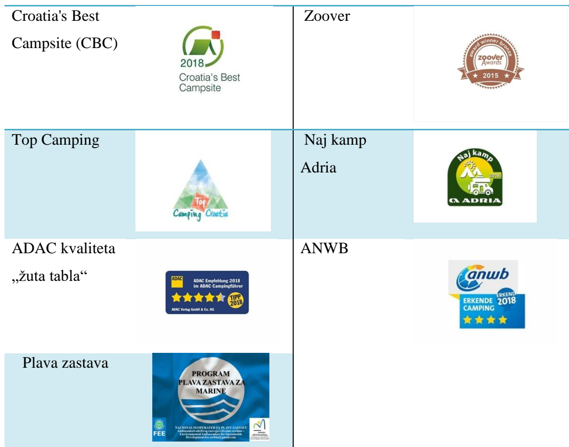
Tablica 11.: Nagrade i priznanja kampa „Zelena Laguna“

Izvor: Vlastita izrada studenta na temelju stranice Laguna Poreč, www.lagunaporec.com (20.08.2018.)