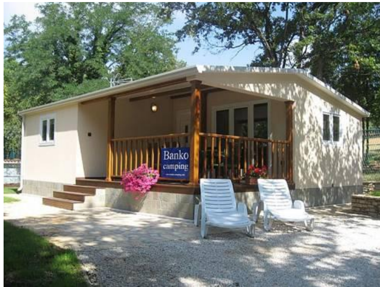
Slika 8.: Mobilna kućica „Banko“ Prestige

roštilj i hidro masažna kada. Na parceli je parking za dva automobila, ali se drugi automobil dodatno plaća na recepciji kampa. Noćenje u Prestige mobilnoj kućici iznosi 79,10€ s uvećanjem u iznosu boravišne pristojbe.