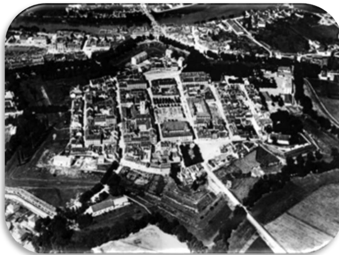
Slika 2. Karlovačka zvijezda nekada