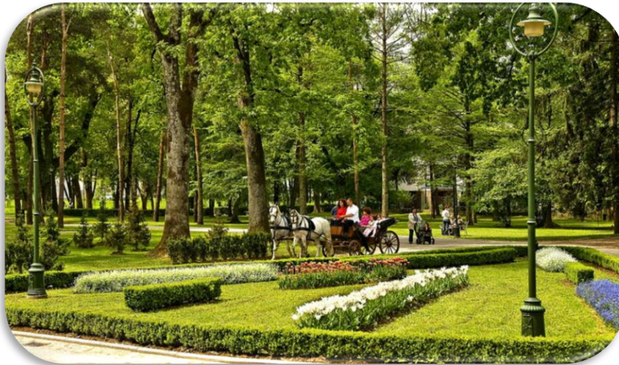
Slika 6. Vrbanićev perivoj