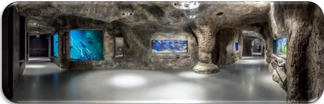
Slika 3. Slatkovodni akvarij