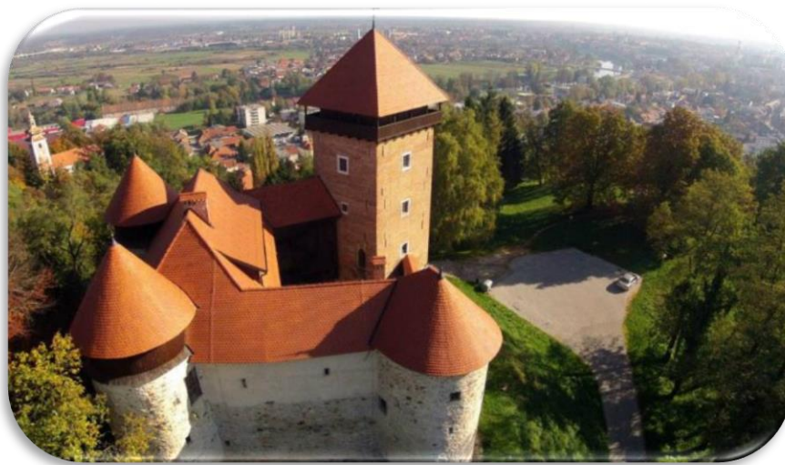
Slika 4. Stari grad Dubovac

Stari grad Dubovac je najstariji karlovački spomenik. Dubovac je ime je dobio po nekadašnjoj hrastovoj (dubovoj) šumi koja ga je okruživala, a prenio ga je na suvremenu gradsku četvrt Dubovac na karlovačkoj periferiji. I kao što se u 16. stoljeću govorilo „Karlovac pod Dubovcem“, jer je Dubovac bio stariji i poznatiji, tako je i danas stari grad na brdu povrh Kupe najuočljivije obilježje karlovačkog kulturno - povijesnog krajolika na koji se otvara pogled s autoputa. 9 Danas je stari grad poznat kao izletišta na kojem se okupljaju brojni građani grada Karlovca ali i brojni drugi turisti.