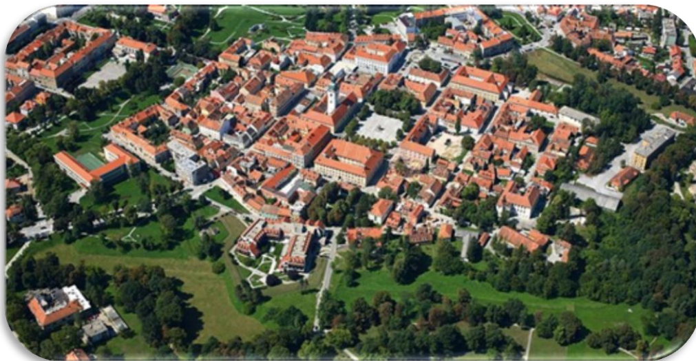
Slika 1. Grad Karlovac (Karlovačka zvijezda)