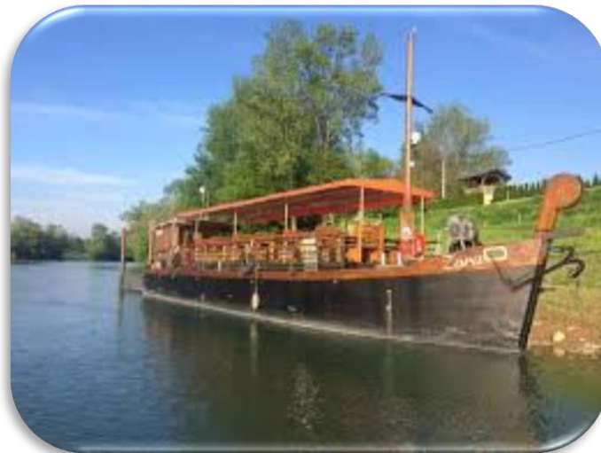
Slika 7. Žitna lađa na rijeci Kupi