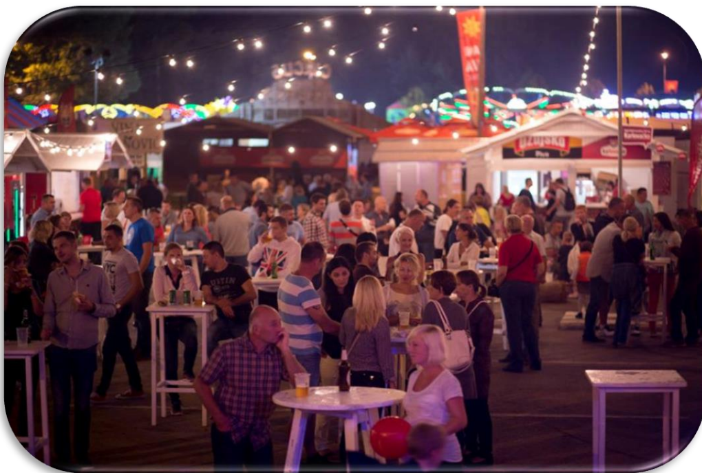
Slika 8. Dani piva 2018. godine