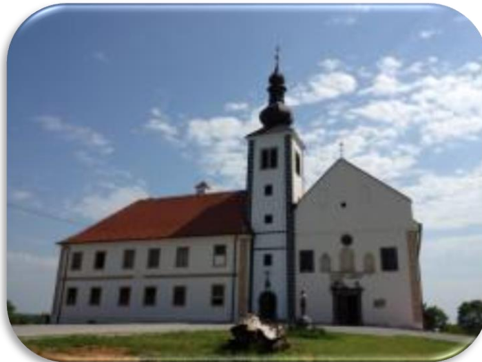
Slika 5. Pavlinski samostan Kamensko