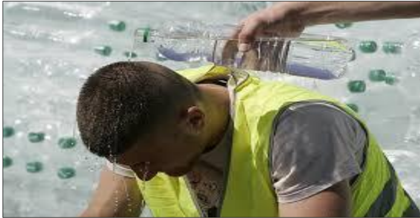
Slika 4. Radnik polijeva kolegu vodom koji je vidno premoren zbog rada na visokim temperaturama

u organizaciji rada na otvorenom u uvjetima visokih temperatura, primjenjuju ovu praksu (Australija, SAD, Kanada). [14]