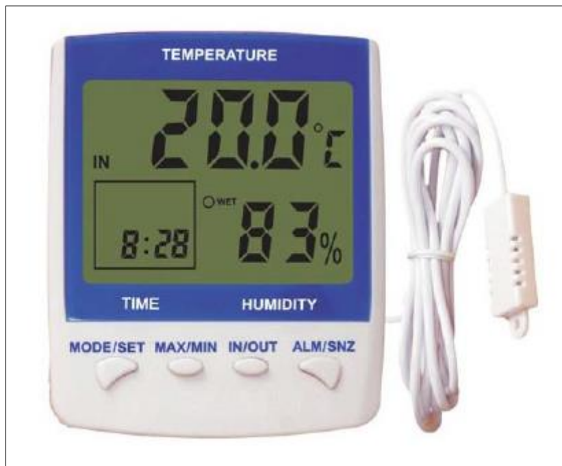
Slika 4. Termalni higrometar

Mjerenje Humideksa obavlja se pomoću mjernog uređaja, tzv. termalnog higrometra (slika 3)