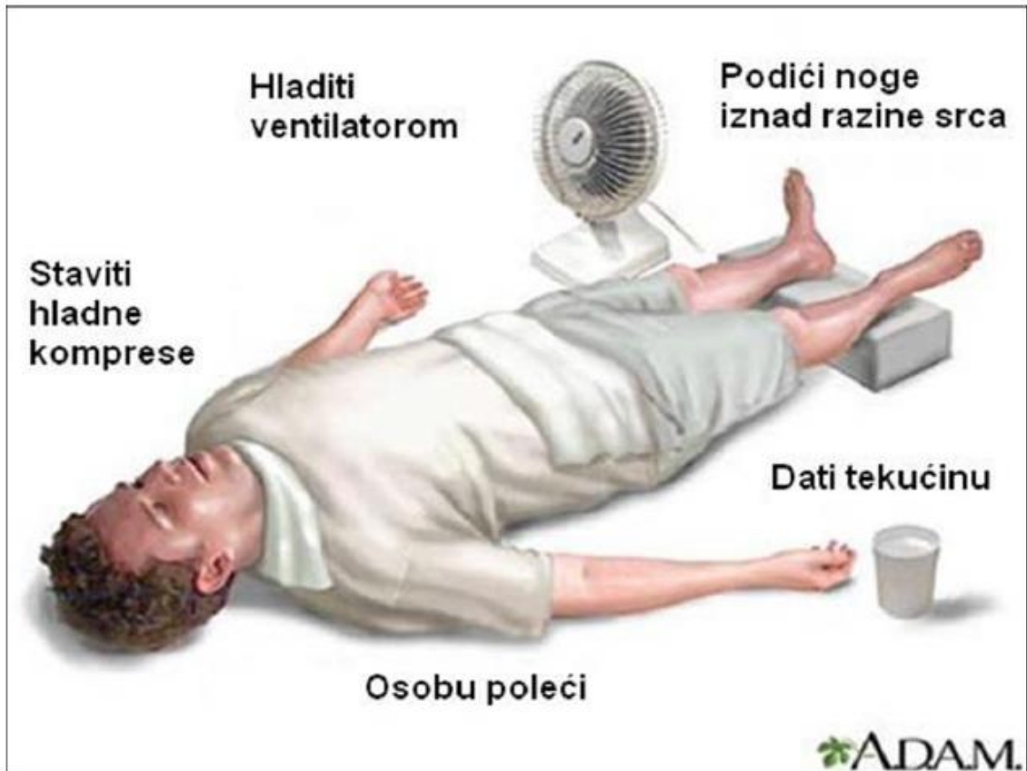
Slika 5. Prikaz pružanja prve pomoć. Rađeno prema A.D.A.M.

http://www.adamimages.com/illustration/Browse/1/H [19]