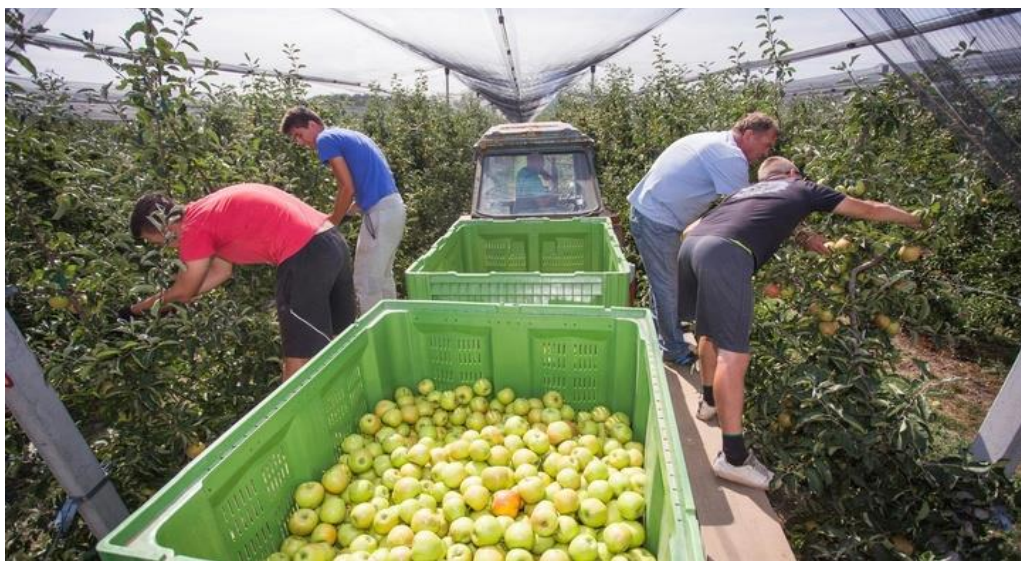
Slika 3. Berba jabuka.

Prekasno ubrani te prezreli plodovi mogu se tek kratko vrijeme čuvati. Gubitci se očituju i zbog opadanja plodova, plodovi su mekši, imaju manje kiselina i brašnjavi su. Javljaju se gljivične i fiziološke bolesti.