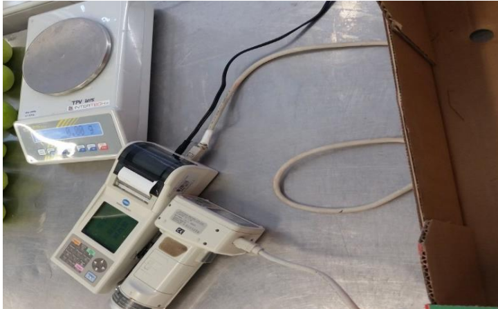
Slika 8. Kolorimetar - KONICA MINOLTA CHROMA METER CR-400