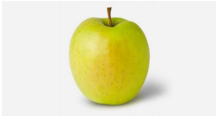
Slika 2. Boja jabuke sorte "Zlatni Delišes"

Boja jabuke „Zlatni Delišes“ temeljna zlatnožuta boja u vrijeme berbe čuvanjem postaje žuta