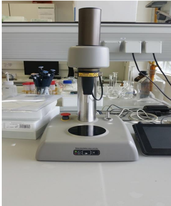
Slika 9. Analizator teksture voća i povrća