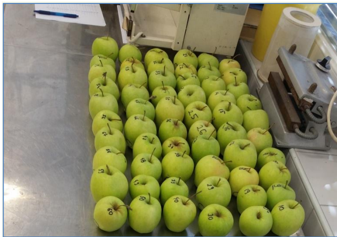
Slika 1. Jabuka sorta "Zlatni Delišeš" (Autor: Lina Majhen)

Zimska sorta koja dozrijeva polovicom rujna. Plod težine 150-250g. slatkastog okusa s tipičnom aromom za ovu sortu. Boja u vrijeme berbe je zeleno-žuta, a kasnije prelazi u zlatno-žutu. Jedna od najkvalitetnijih sorata jabuka.