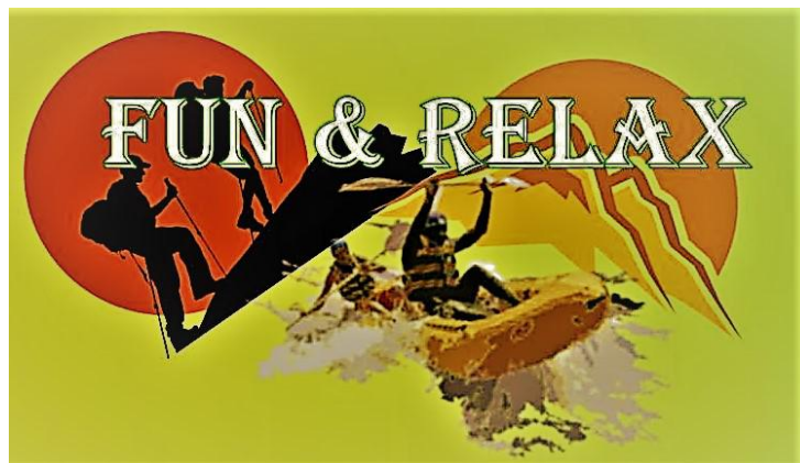
Slika 2. Logo tvrtke