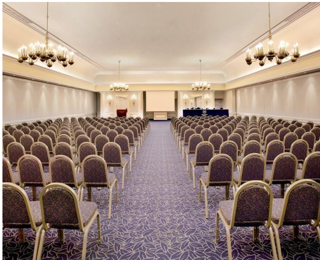
Slika 5. Velika dvorana hotela Sheraton Zagreb