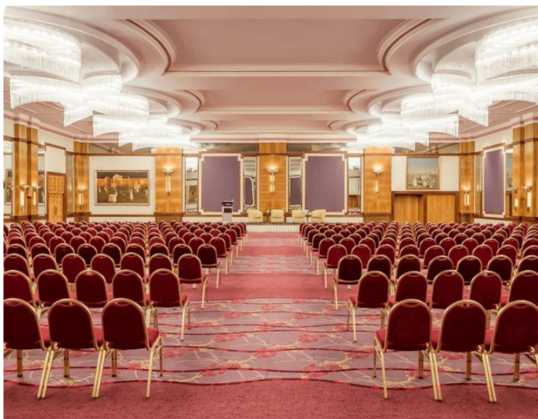
Slika 9. Crystal Ballroom hotela The Westin Zagreb