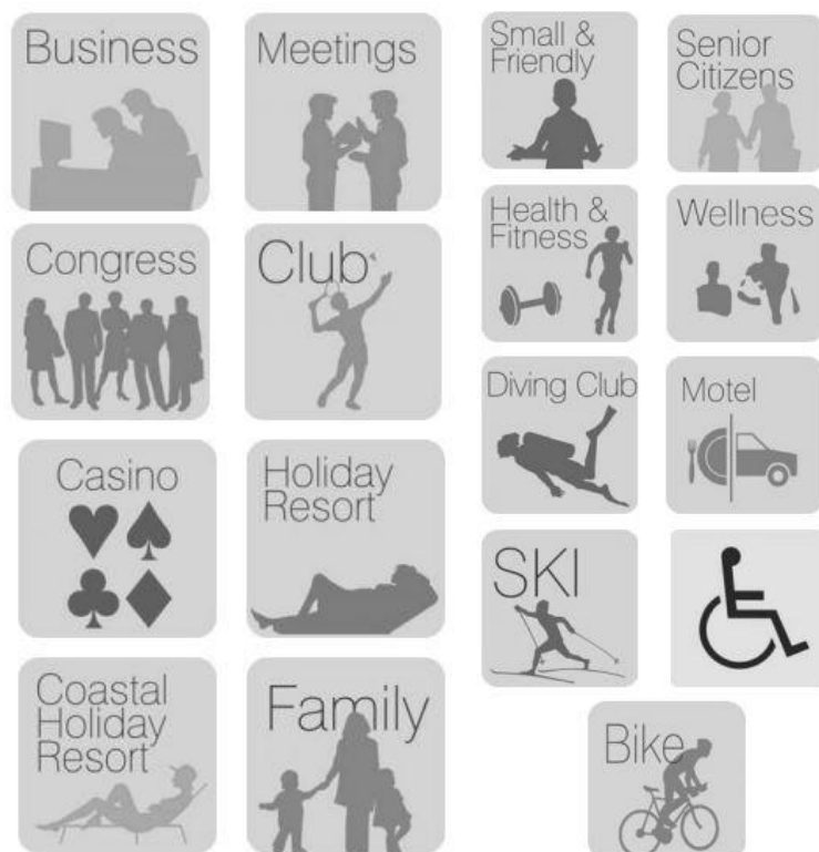
Slika 1. Grafička rješenja standardiziranih ploča za posebne standarde za vrstu hotel