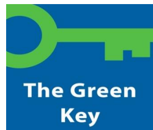
Slika 3. Logo eko standarda Green Key