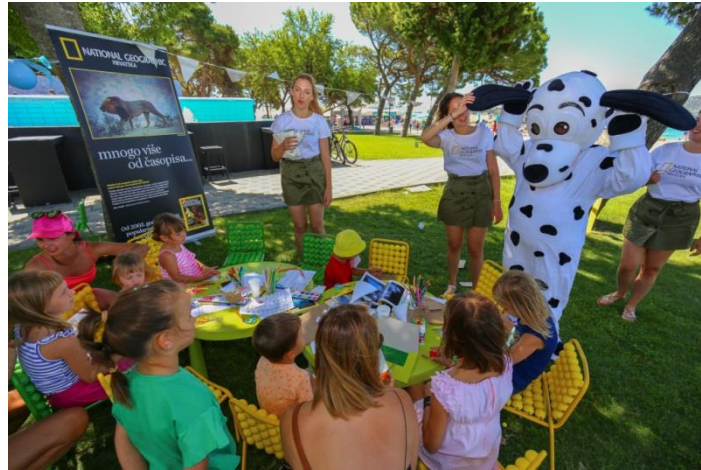
Slika 9. Dječja radionica