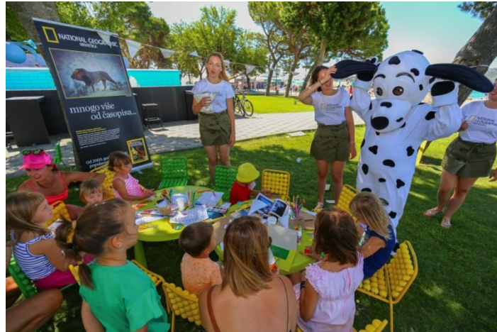
Slika 9. Dječja radionica