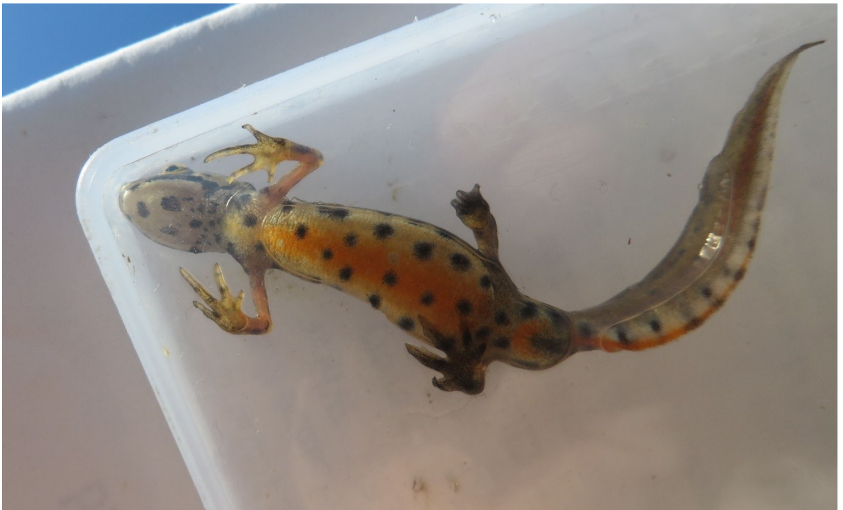
Slika 33 Vodenjak iz lokve Skala – mužjak