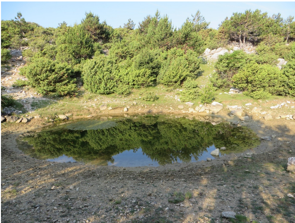
Slika 13 Lokva Skala

Lokva je okružena šumom šmrike koja se postupno tijekom godina sve više bliži samoj lokvi. Sama obala lokve je gola, a nekoliko metara od nje obrašteno je niskom travom i grmovima kupine. Dno lokve obrašteno je bujnom vegetacijom - različitim vrstama vodenih biljaka. Lokva se koristi kao važno pojilište ovaca, a budući da na tom dijelu otoka ima i divljih životinja - najčešće divljih svinja i one je često koriste. Stočarstvo je još uglavnom na ovom dijelu otoka Krka ekstenzivno pa su ovce puštene slobodne na cijelom južnom dijelu otoka Krka i prepuštene da samostalno traže vodu i hranu. U neposrednoj blizini lokve na povišenoj lokaciji nalazi se promatračnica za ovce i divlje svinje.