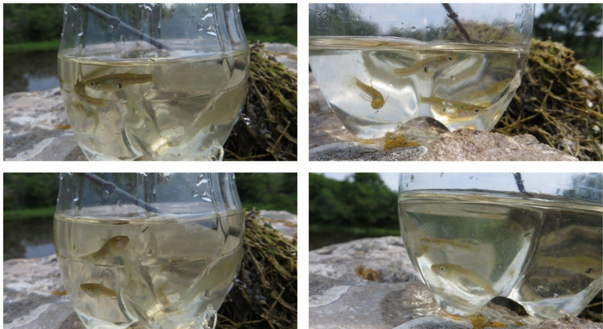
Slika 41 Gambuzije u lokvi Misučajnica