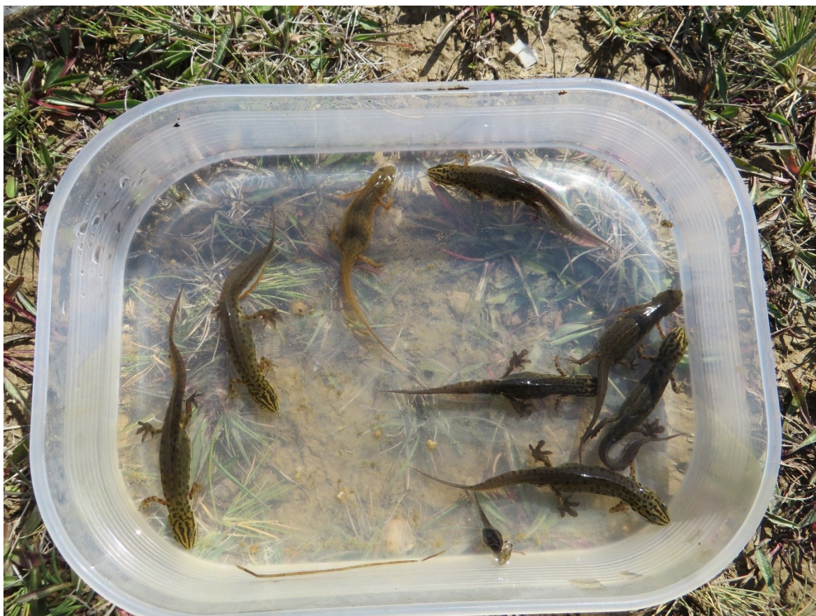
Slika 37 Vodenjaci uhvaćeni u Novoj lokvi 3