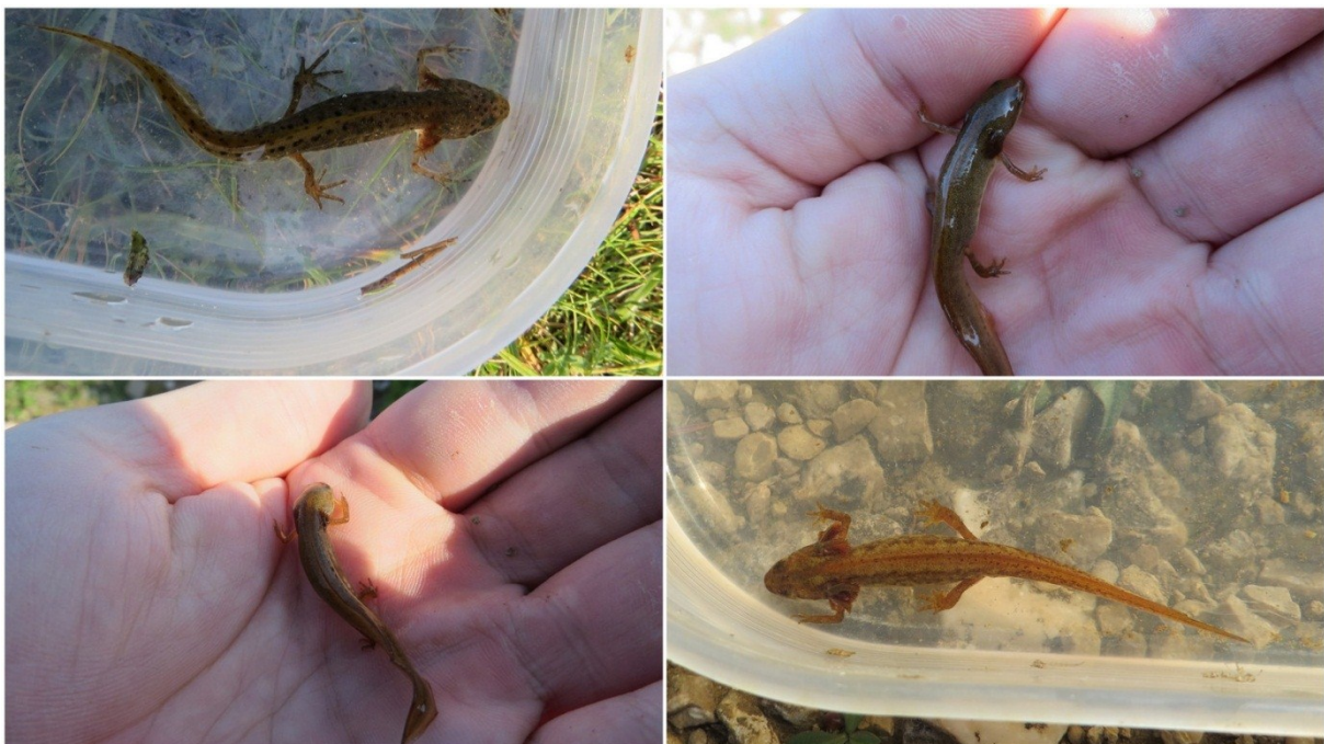
Slika 3 Juvenilni primjerci vodenjaka (ličinke)

Parenje započinje oko mjesec dana nakon migracije u vodu. Ženka polaže oko 200-300 smečkastih jaja promjera 1,3-1,8 mm, pojedinačno ih umatajući u listove vodenog bilja. Razvoj embrija traje 8-14 dana, što najviše ovisi o temperaturi vode. Ličinke su prilikom izlaska iz jaja duge 6-10 mm te ostaju u tom obliku 6-8 tjedana kada se događa preobrazba (slika 3)