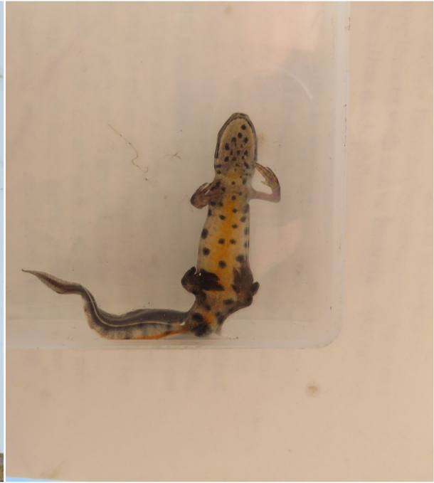
Slika 1 Mali vodenjak mužjak

Ženke su svjetlije obojene, svijetlo smeđe do maslinaste, bez izražajnog leđnog grebena i sa slabije izraženim i manjim crnim mrljama (slika 2)