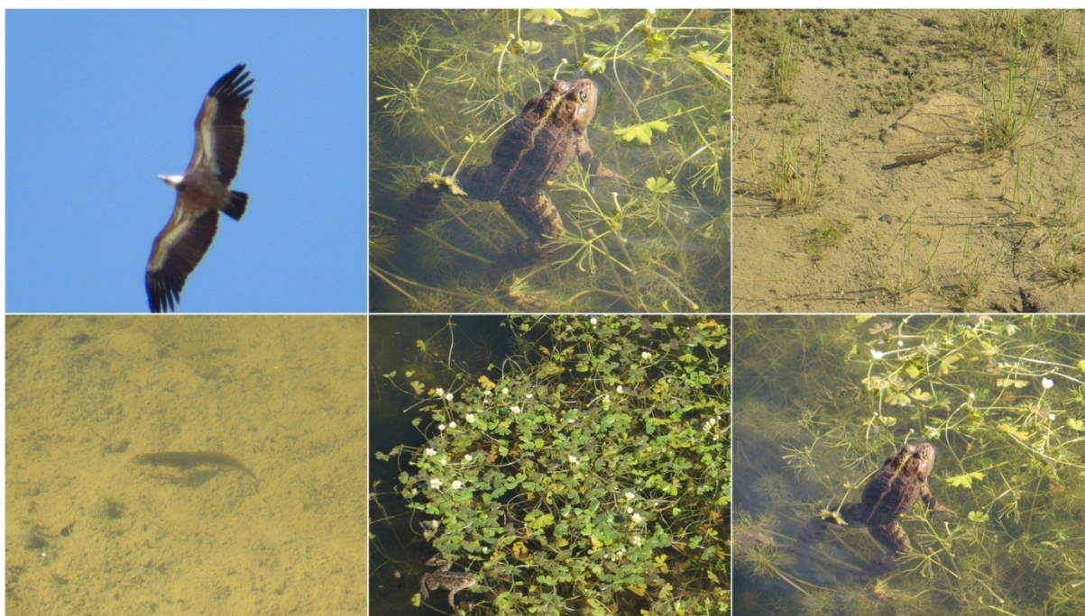
Slika 19 Ostale biljne i životinjske vrste u Novoj lokvi 3