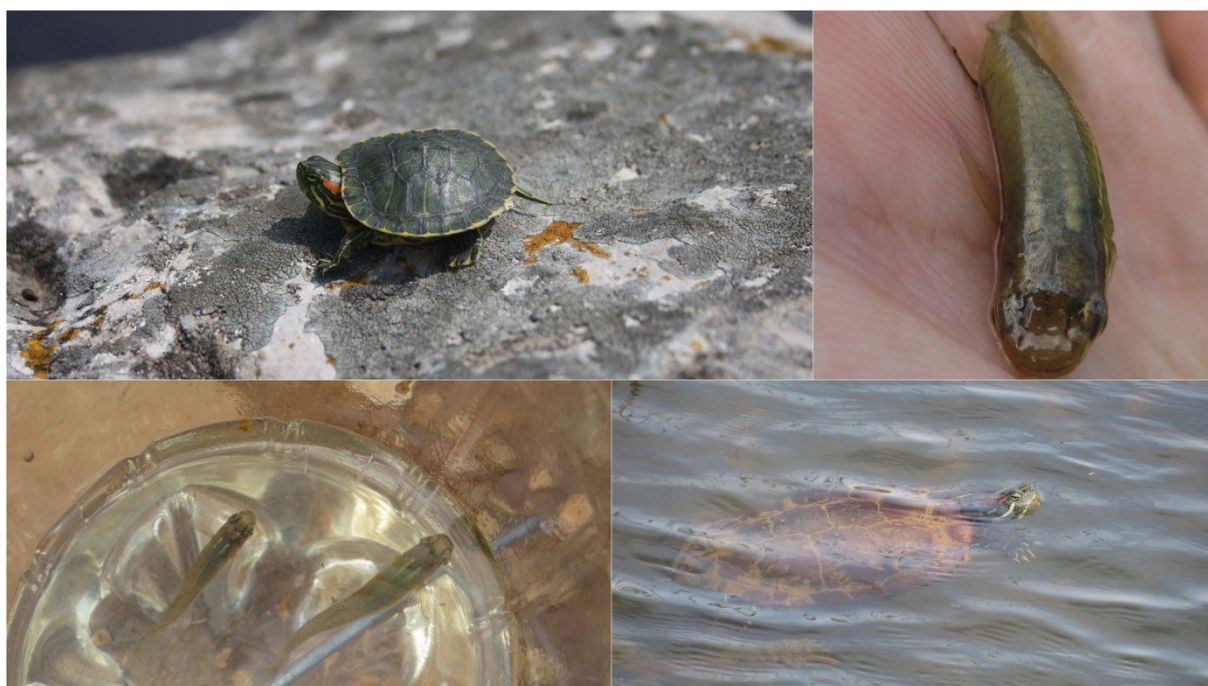
Slika 39 Gambuzije i crvenouhe kornjače u lokvi Kimpi

U nastavku je dat prikaz odabranih fotografija (Slika 39 - 41)