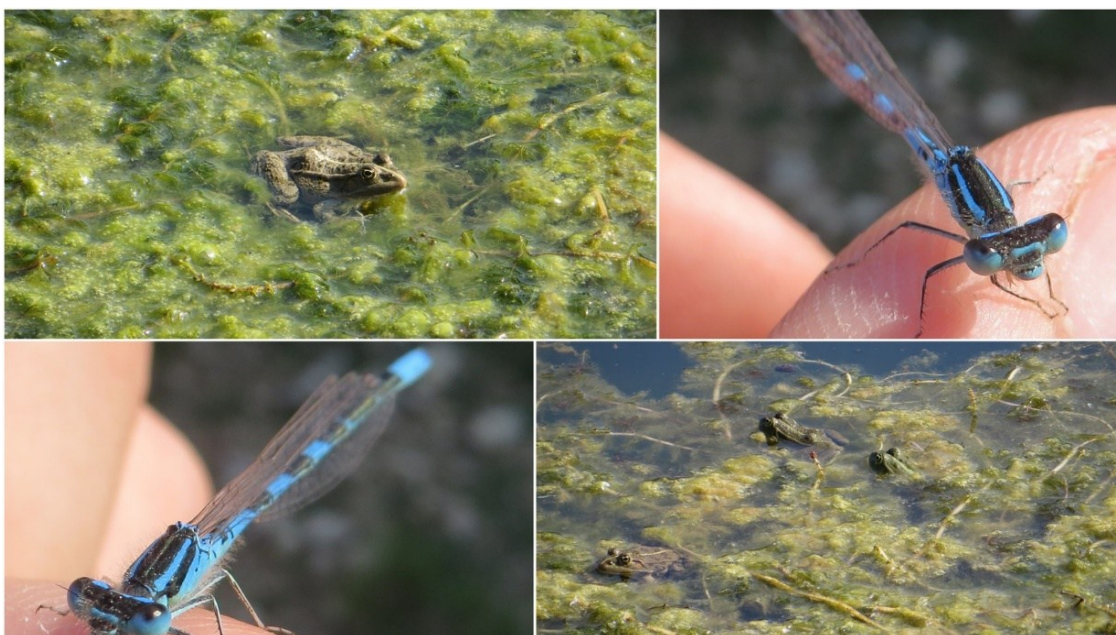
Slika 15 Biljne i životinjske vrste u lokvi Skala