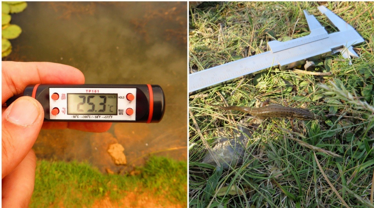
Slika 28 Instrumenti za vršenje raznih mjerenja

Prilikom vršenja terenskih istraživanja korištena je i ostala oprema kao što su mjerni instrumenti: termometar za mjerenje temperature vode i zraka, digitalna vaga za mjerenje težine uhvaćenih primjeraka vodenjaka te pomična mjerka za mjerenje duljine vodenjaka (slika 28).