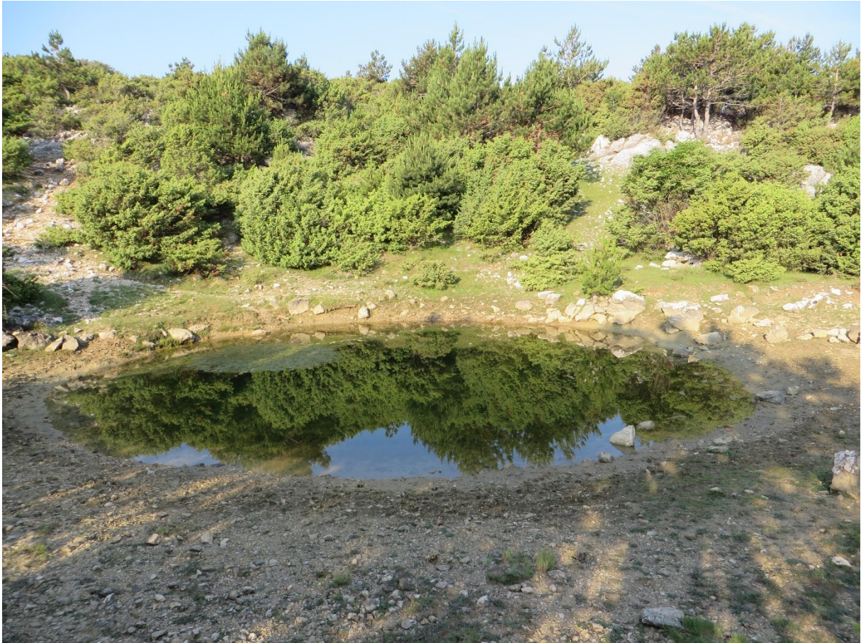
Slika 13 Lokva Skala

Lokva je okružena šumom šmrike koja se postupno tijekom godina sve više bliži samoj lokvi. Sama obala lokve je gola, a nekoliko metara od nje obrašteno je niskom travom i grmovima kupine. Dno lokve obrašteno je bujnom vegetacijom - različitim vrstama vodenih biljaka. Lokva se koristi kao važno pojilište ovaca, a budući da na tom dijelu otoka ima i divljih životinja - najčešće divljih svinja i one je često koriste. Stočarstvo je još uglavnom na ovom dijelu otoka Krka ekstenzivno pa su ovce puštene slobodne na cijelom južnom dijelu otoka Krka i prepuštene da samostalno traže vodu i hranu. U neposrednoj blizini lokve na povišenoj lokaciji nalazi se promatračnica za ovce i divlje svinje.