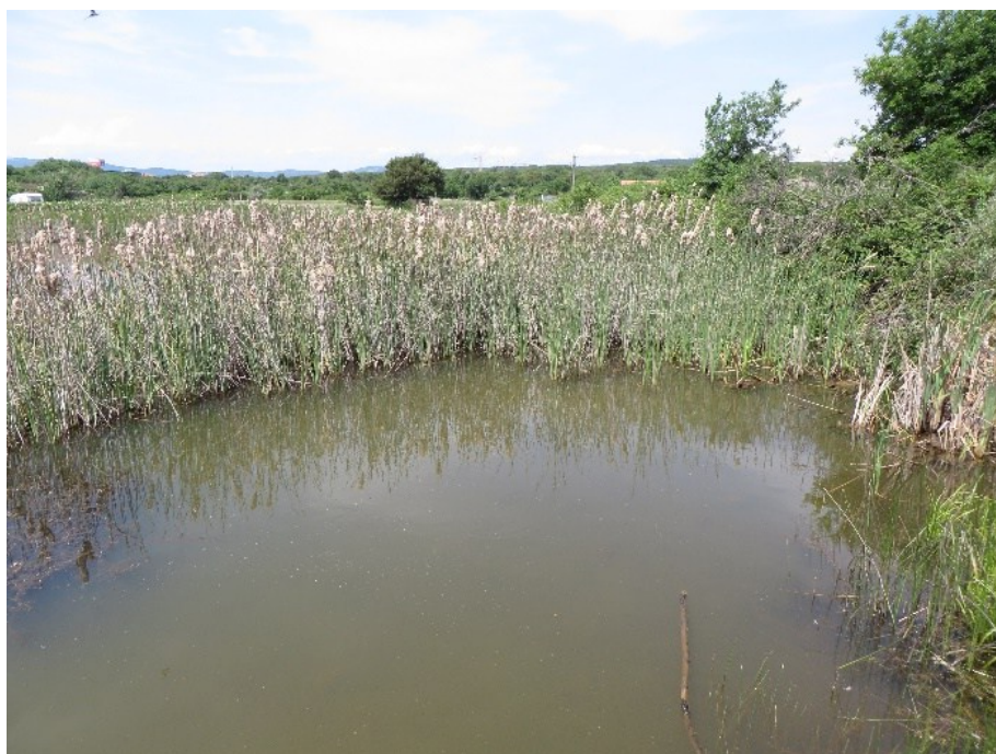
Slika 22 Lokva Kimpi

Fizikalno kemijske parametre vode u lokvi Kimpi izmjerila je Javna ustanova Priroda 18.12.2015 i oni iznose: - temperatura 4,45°C - pH 8,72 - otopljeni kisik 0,6% - salinitet 0,13 ‰ .