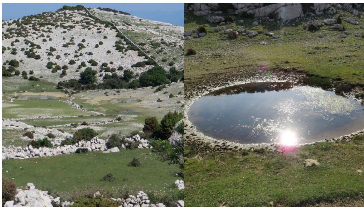
Slika 7 Umjetne lokve na južnom dijelu otoka Krka- lijevo Nova lokva 1 2 i 3, desno Nova lokva 3

Postanak lokvi na otoku Krku vezan je uz evoluciju reljefa i djelovanje čovjeka kroz povijest gdje je u većini slučajeva ipak „zaslužan“ čovjek i to svojim intervencijama u krajobrazu. Počeci gradnje umjetnih lokvi sežu u daleku povijest, još u brončano doba kada su se ljudi počeli baviti stočarstvom i zbog toga krčili šume na račun pašnjaka za stoku. S gubitkom nekadašnjih bujnih šuma na otoku, za pretpostaviti je da se smanjila količina prirodnih napajališta za stoku pa je izgradnja umjetnih lokvi (slika 7) postala od presudne važnosti. Lokve su gradili u nekoj krškoj vrtači (ponikvi) ili udubljenju terena, dno bi prekrili slojem nepropusne gline i dobro nabili. Ukoliko je lokvu koristila i krupna stoka, to je bilo povoljnije za njezino održavanje, jer bi životinje papcima stalno utiskivale i popravljale nepropusni sloj gline.