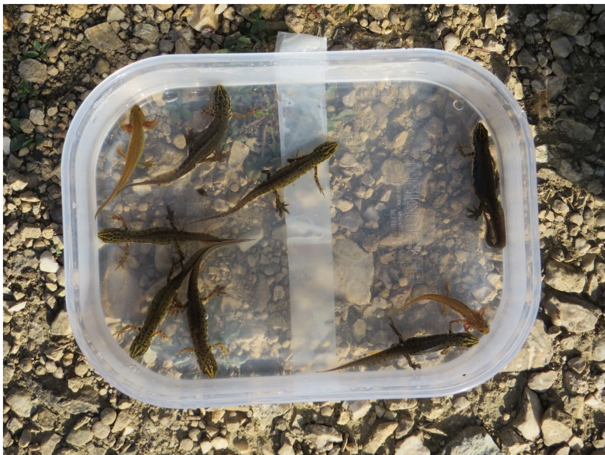
Slika 34 Vodenjaci uhvaćeni u lokvi Kaljužina

U nastavku je prikaz odabranih fotografija uhvaćenih vodenjaka u lokvi Kaljužina (slika 34-36)