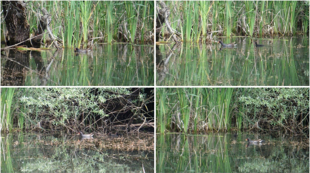
Slika 23 Ostale životinjske vrste u lokvi Kimpi (bez gambuzija i crvenouhих kornjača)