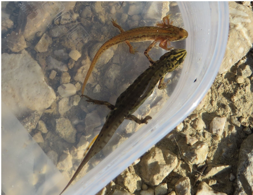
Slika 36 Vodenjaci iz lokve Kaljužina - mužjak i ličinka