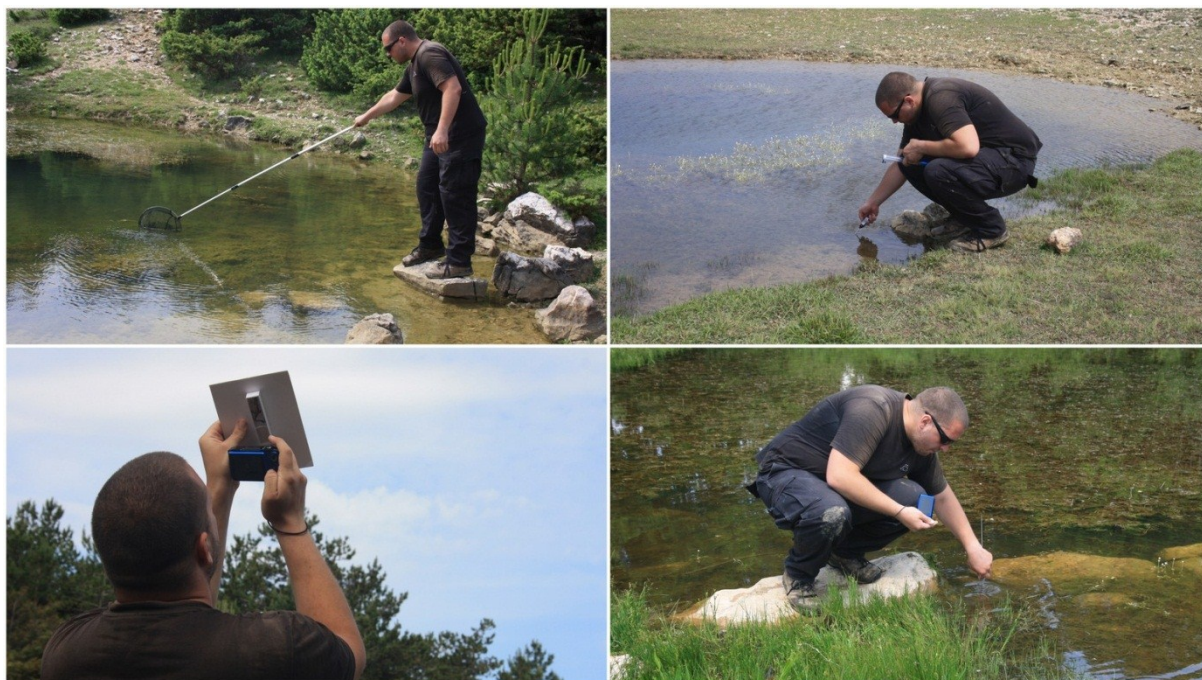
Slika 25 Istraživanja na terenu

U svrhu procjene populacije malog vodenjaka u odabranim lokvama otoka Krka vršena su terenska istraživanja (Slika 25) korištenjem slijedećih metoda: vizualno pretraživanje terena (uključuje vodenu i kopnenu površinu lokaliteta) i bilježenje svake uočene jedinke te hvatanje vodenjaka kako bi se provela mjerenja na terenu duljina tijela, duljina repa, duljina glave, širina glave, težina (slika) Prilikom lova određivan je i spol jedinki. Nakon provedenih mjerenja i bilježenja podataka koja su trajala između 1-2 sata po svakoj lokaciji svi su primjerci vraćeni potpuno zdravi i neozlijeđeni natrag u svoje stanište. Tijekom istraživanja se pokazalo da primijenjeni način lova ne povećava mortalitet jedinki i da se njihove šanse za preživljavanje nakon lova nisu smanjile .