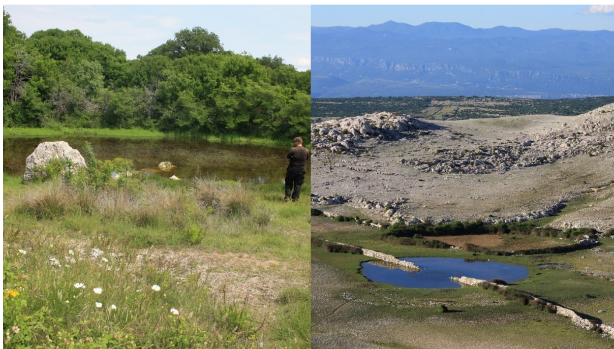
Slika 5 Prirodne lokve na južnom dijelu otoka Krka

U krškom području lokve predstavljaju izvor vode, male slatkovodne oaze u površinski bezvodnom kršu. Važne su posebice za stoku, navodnjavanje polja, gašenje požara, a nekad su ih ljudi koristili i kao izvor pitke vode. Radi široke primjene, lokve su ljudi čuvali kao veliku dragocjenost. Prema postanku dijele se na prirodne (slika 5) koje su nastale na vodonepropusnom zemljištu akumulacijom vode, uslijed djelovanja hidroloških, klimatskih i geoloških čimbenika ili su antropogenog porijekla.