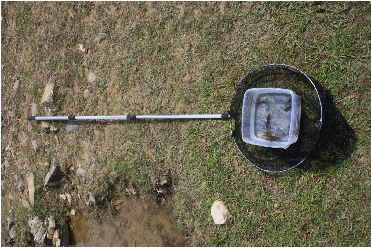
Slika 26 Mreža za hvatanje vodenjaka

Za hvatanje vodenjaka korištena je mreža koja se sastojala od teleskopskog aluminijskog drška dugog 2 m na koji je na metalnom okviru promjera 30 cm bila pričvršćena mreža. Mreži je promjer 30 cm, a dimenzije okana na mreži su 0,2 x 0,2 cm. (slika 26)