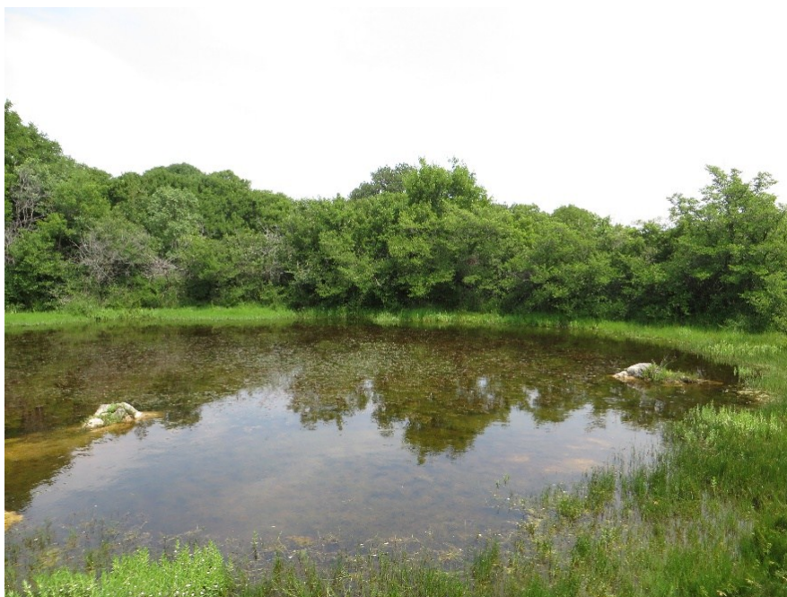
Slika 20 Lokva Misučajnica

Lokva Misučajnica (slika 20) smještena je uz samu cestu između Punta i Vrbnika na 180 m n/v i također je prirodnog porijekla i stalna. nalazi se na N45° 03.288' E14° 39.017' sjeverne geografske širina i E14° 39.017'istočne geografske dužine a dimenzije su joj 30 x 20 metara Fizikalno kemijske parametre vode u lokvi Misučajnica izmjerila je Javna ustanova Priroda 18.12.2015 i oni iznose: - temperatura 5,01°C - pH 7,99 - otopljeni kisik 33,7% - salinitet 0,18 ‰ .