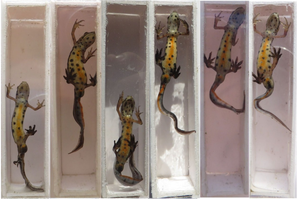
Slika 42 Usporedba vodenjaka po točkama na truhu

Identifikacija na temelju raspoznavanja točaka je u novije vrijeme sve popularnija zbog svoje jednostavnosti, niskog troška postupka te zbog toga što životinjama ne uzrokuje ozljede niti veliki stres. Glavni nedostatak te metode je taj da se raspoznavanje mora vršiti manualnim pregledom i analizom svake fotografije što može postati vrlo zamoran posao ako se radi o identifikaciji velikog broja jedinki i tijekom više godina. Za potrebe lakšeg pregledavanja baze podataka razvijeni su posebni programi za određivanje i spremanje individualnih identifikacijskih karakteristika. Jedan od takvih programa je i I 3 S Interactive Individual Identification system, a razvijen je primarno za raspoznavanje različitih vrsta morskih pasa čije je tijelo prekriveno točkama. Kasnije je razvijeno još nekoliko verzija programa za vrste koje nemaju točke, ali imaju neke druge identifikacijske karakteristike. Za vodenjake se koristi I 3 S spot u kojem se osim same pozicije točaka može odrediti i njihova veličina i oblik što kod vodenjaka i daždevnjaka značajno povećava točnost (ANONYMUS 2016)