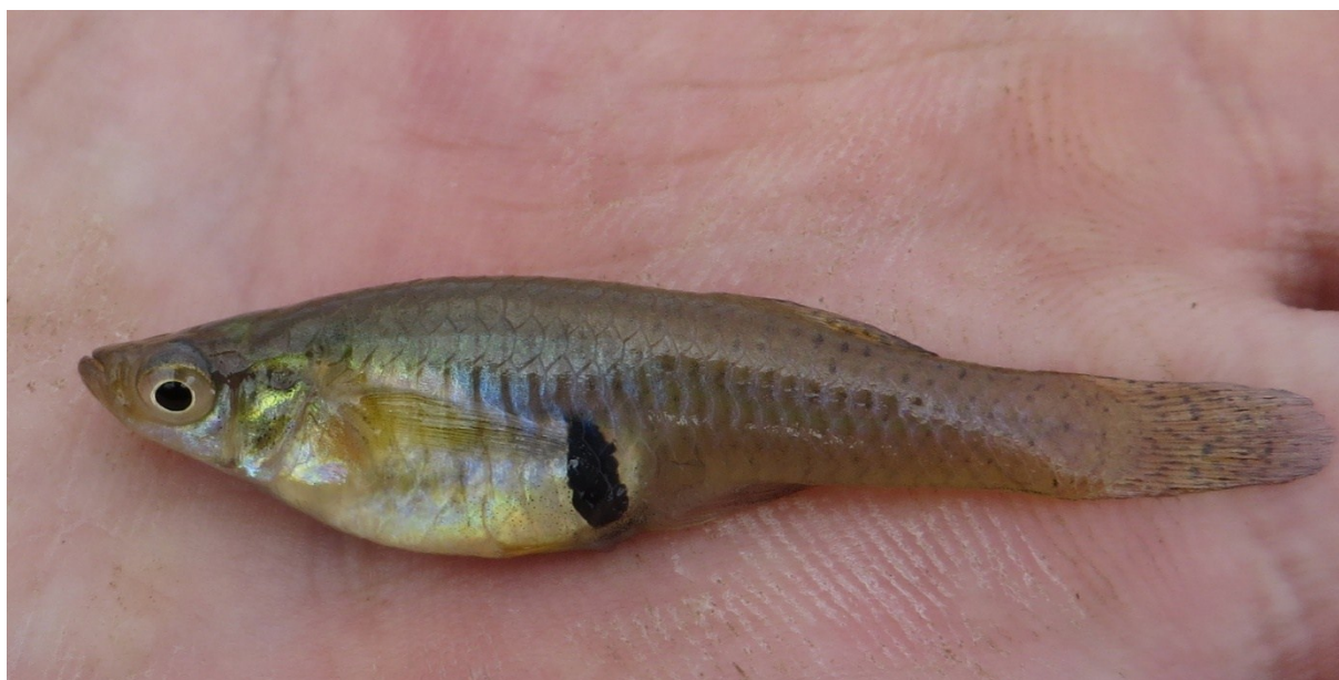
Slika 10 Gambuzija ( Gambusia affinis )

Ljudi su djelovali ne samo na same lokve nego i na živi svijet lokvi. Još početkom 20-tog stoljeća lokve na otoku Krku bile su leglo malaričnih komaraca i izvori zaraze. Malarija je harala pojedinim dijelovima otoka, a stručnjaci za suzbijanje malarije počeli su koristiti ribice gambuzije kao vrlo efikasnu biološku metodu za borbu protiv komaraca. Iako je time potvrđena učinkovitost biološke metode uz znatno smanjenje korištenja kemijskih sredstava potrebnih za suzbijanja ličinki komaraca, unošenje strane agresivne i invazivne ribe gambuzije koja se hrani jajima i ličinkama malih vodenjaka i drugih vodozemaca ali i drugim sitnim organizmima može imati jako negativne učinke na bogatstvo i raznolikost autohtonog otočnog živog svijeta (slika 10). Istraživanjima je potvrđeno da u lokvama u kojima žive gambuzije nema malog vodenjaka.