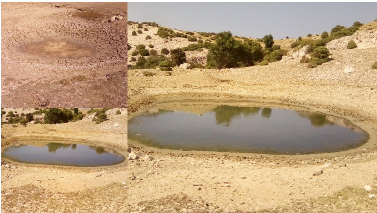
Slika 44 Nova lokva 3 i dvije umjetne lokve u blizini ljeti.

Navedeni obilazak lokacija i provjera stanja potvrdio je da tijekom ljeta vodenjaci prelaze na kopno gdje se skrivaju na vlažna i skrovita mjesta u neposrednoj blizini vodenog staništa, a izlaze samo za kišnih noći. Tu uglavnom ostaju do početka ožujka naredne godine te prilikom ovog ljetnog obilaska (16.08.2018) nisu primijećeni u lokvama. Ostalih stanovnika u lokvama ima – u lokvi Kaljužina punoglavci su u fazi odbacivanja repa a u lokvi Skala već ima i malih žabica.