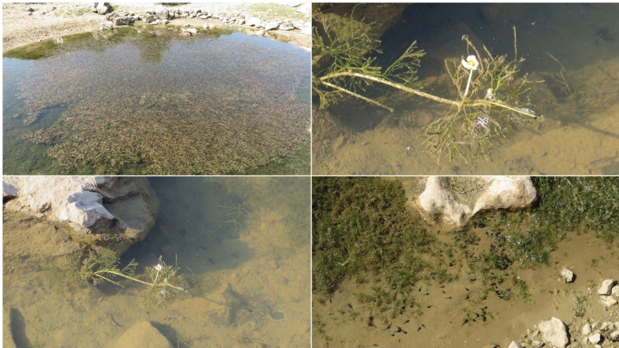
Slika 17 Biljni i životinjski svijet lokve Kaljužina