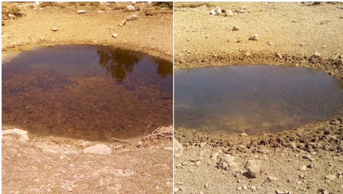
Slika 43 Lokva Skala (lijevo) i lokva Kaljužina (desno) ljeti

Prilikom dodatnog obilaska 3 lokve u kojima obitavaju vodenjaci (16.8.2018) primijećeno je da je suša koja je vladala tijekom srpnja i kolovoza različito djelovala na lokve: lokva Skala ima dovoljno vode, u lokvi Kaljužina vodostaj je značajno smanjen - prepolovljen (slika 43)