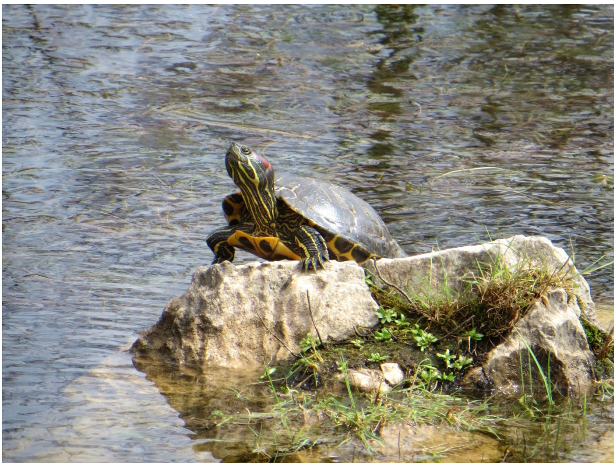
Slika 11 Crvenouha kornjača ( Trachemys scripta elegans )