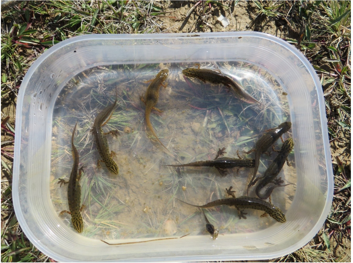
Slika 37 Vodenjaci uhvaćeni u Novoj lokvi 3