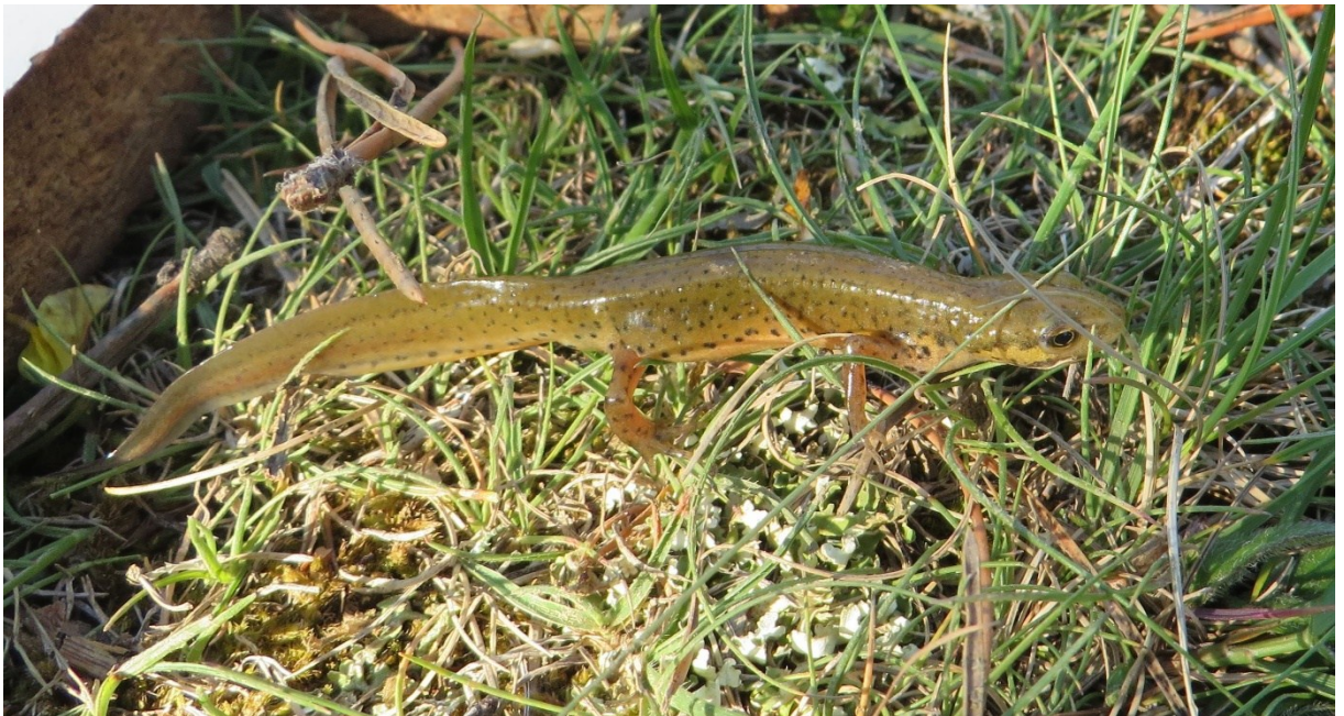
Slika 31 Vodenjak iz lokve Skala - ženka