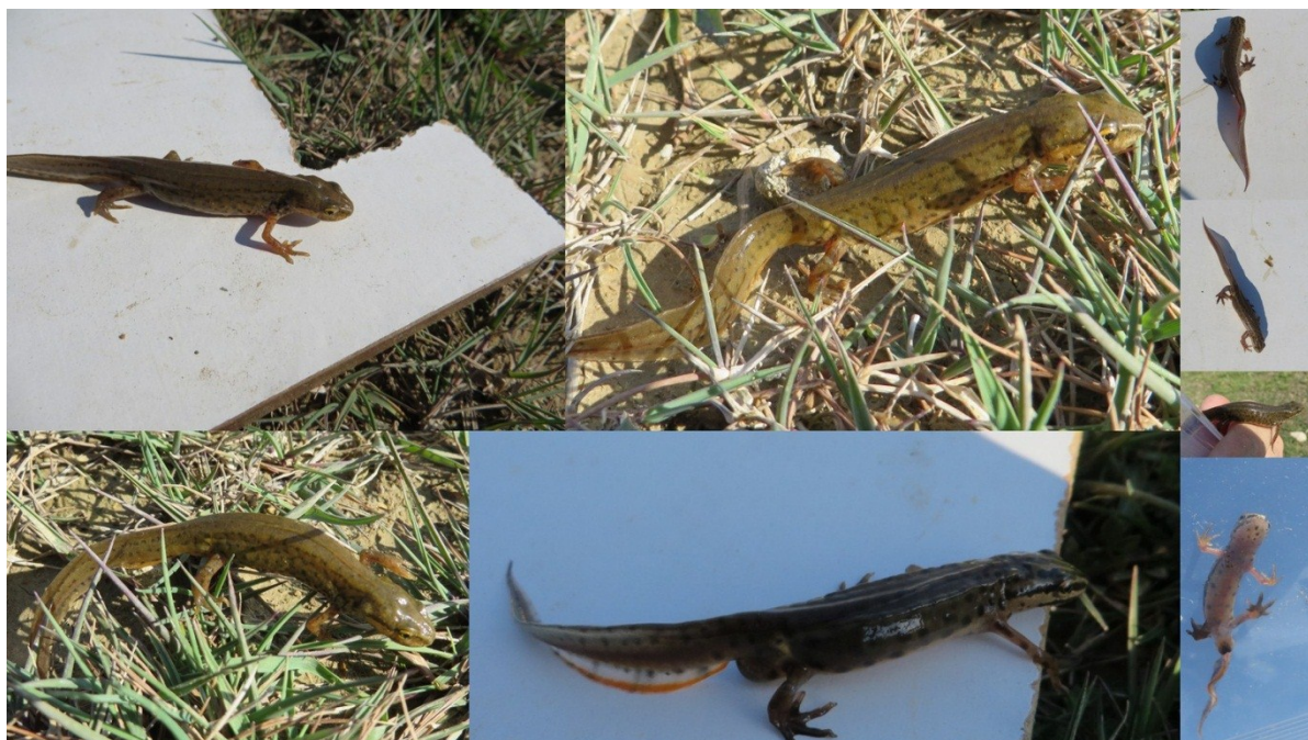
Slika 38 Vodenjaci uhvaćeni u Novoj lokvi 3