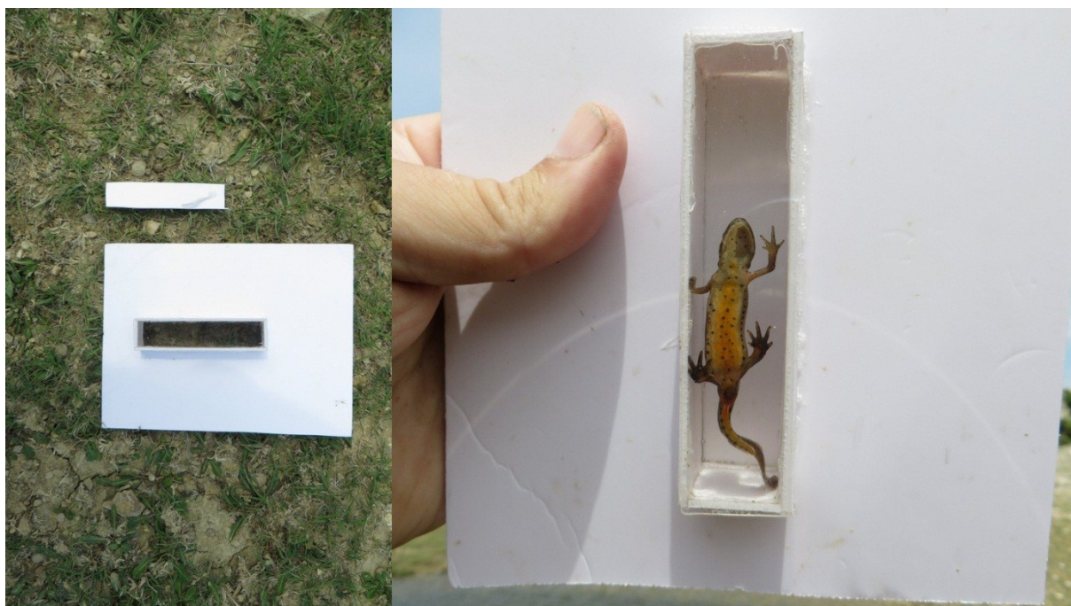
Slika 29 Kutijica za fotografiranje vodenjaka

Za potrebe fotografiranja trbušne strane malih vodenjaka u 2017 g korišten je proziran poklopac plastične kutije, dok je u 2018.g. korištena prozirna plastična kutijica te naprava vlastite izrade napravljena od PVC „foamboard“ materijala koja se sastoji od ravne ploče s prorezom u obliku pravokutnika 10x3 cm. S donje strane ploče od istog materijala izrađen je kvadar dubine 3 cm u koji je na dnu umetnut prozirni pleksiglas (Slika 29)