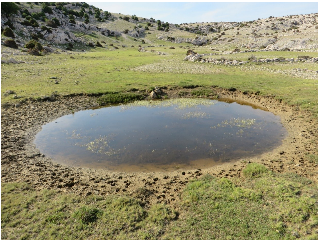
Slika 18 Nova lokva 3

Nova lokva 3 nalazi se na N45^{\circ} 00.457' sjeverne geografske širina i E14^{\circ} 40.990' istočne geografske dužine. Nova lokva 3 je gotovo okrugla dimenzija 5x5m, a njezina je dubina u najpovoljnijem dijelu godine oko 1 m. Podaci o fizikalnim i kemijskim parametrima vode koje je izmjerila Javna ustanova priroda 13.11.2015 iznose kako slijedi: temperatura 9,55^{\circ}\text{C} , pH 8,32, otopljeni kisik 56,2% te salinitet 0,22‰ .