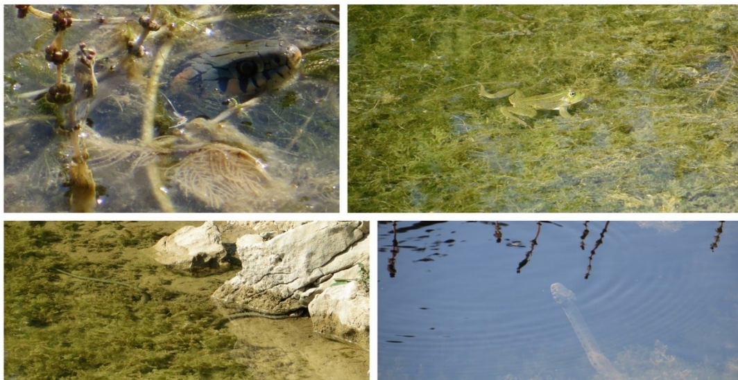
Slika 14 Autohtone biljne i životinjske vrste u lokvi Skala

Najčešće životinjske vrste u lokvi i kraj lokve uz malog vodenjaka su zelena žaba ( Pelophylax ridibundus ), bjelouška ( Natrix natrix ), vretenca i razni vodeni kukci (slike 14. i 15)