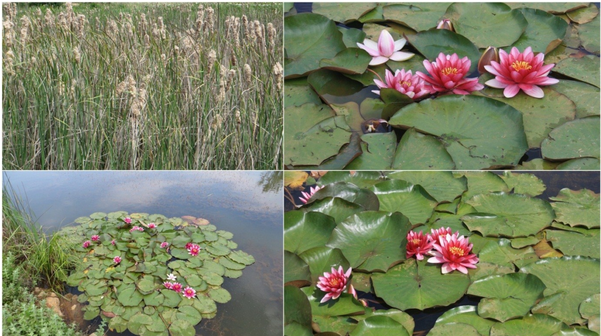
Slika 24 Biljni svijet lokve Kimpi