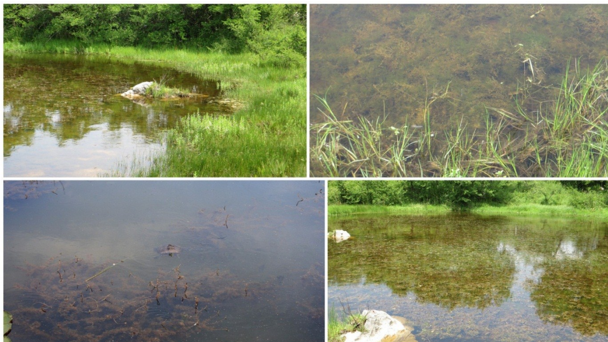
Slika 21 Autohtone biljne i životinjske vrste u lokvi Misučajnica

Bioraznolikost u lokvi je znatno smanjena zbog prisutnosti invazivnih vrsta. U lokvi živi vrlo velik broj gambuzija i tridesetak jedinki crvenouhe kornjače. Od autohtonih životinjskih vrsta prisutan je manji broj zelenih žaba i kukaca, znatno manje nego u lokvama bez invazivnih vrsta. Mali vodenjak nije prisutan. (slika 21)