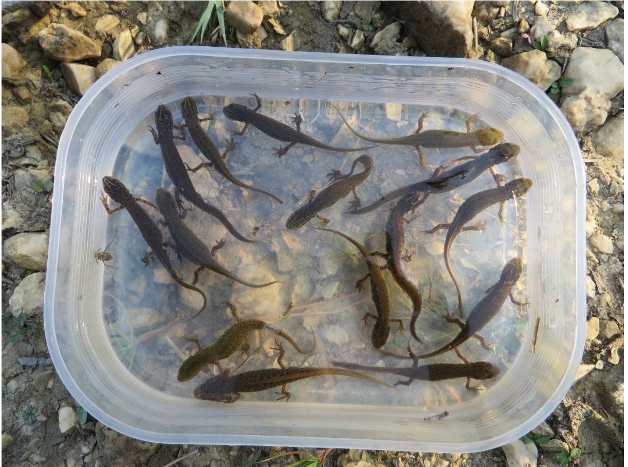
Slika 30 Vodenjaci uhvaćeni u lokvi Skala