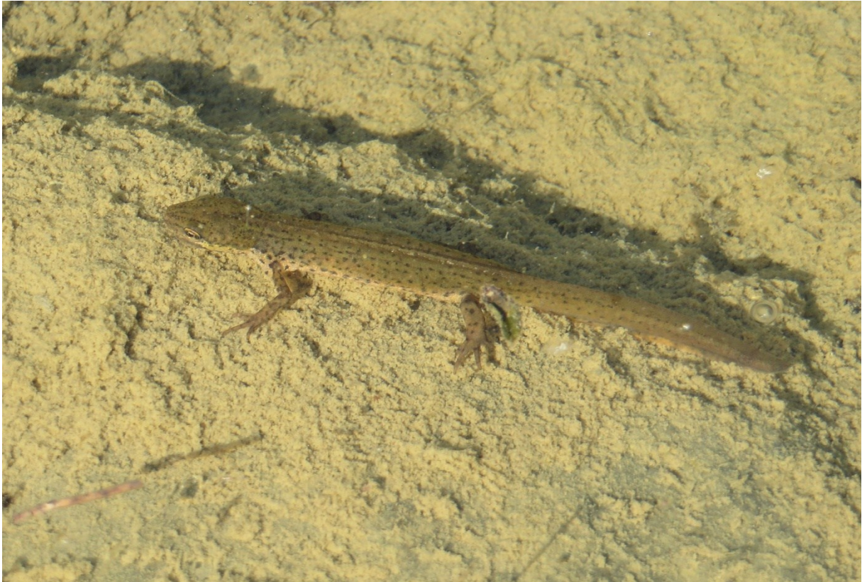
Slika 32 Vodenjak u lokvi Skala – ženka