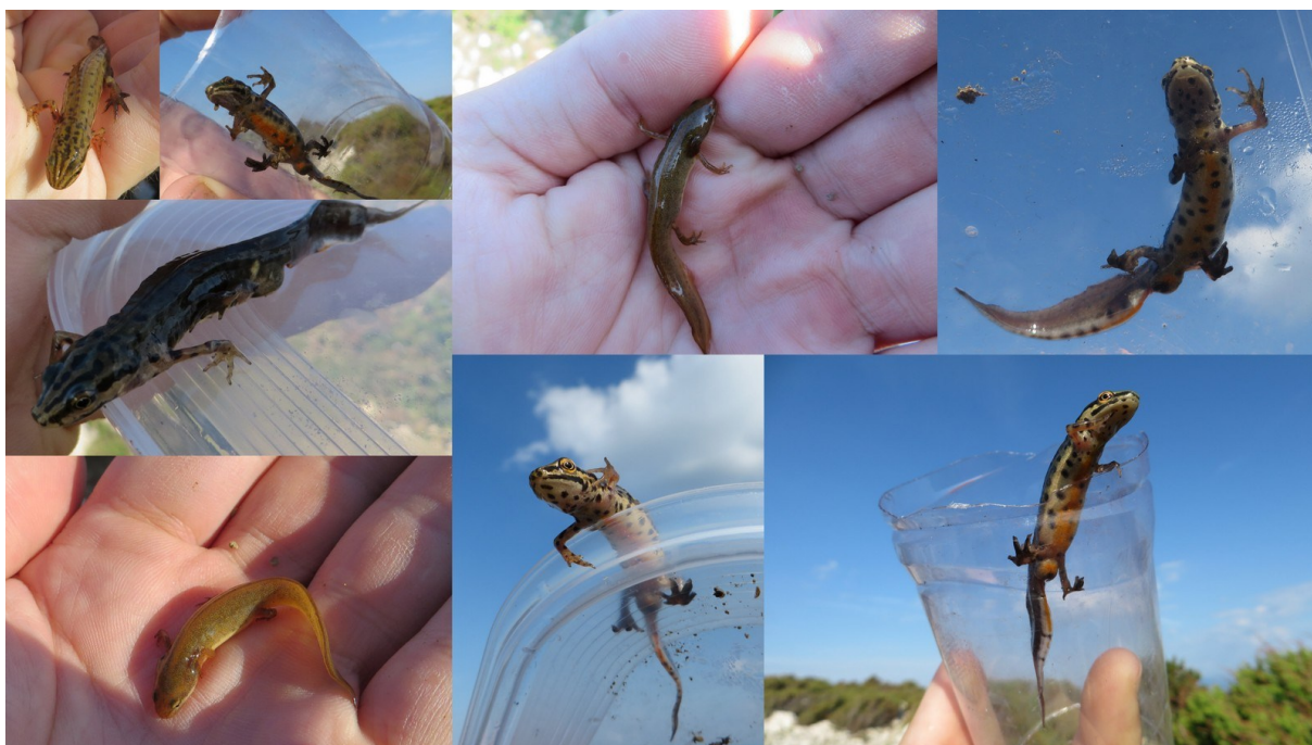
Slika 35 Vodenjaci uhvaćeni u lokvi Kaljužina