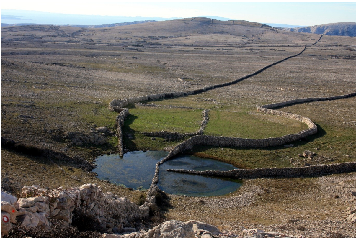
Slika 8 Lokva Diviška pregrađena suhozidima

Tako je bilo sve dok nije uvedena tekuća voda i dok se nije prešlo na lakše oblike privređivanja odnosno dok tradicionalno stočarstvo nije sve više počeo zamjenjivati turizam. Te su promjene uvjetovale smanjenje a ponekad i potpuno zapuštanje pojedinih tradicijskih aktivnosti i gubitak i zaborav baštinjenih znanja vezanih uz lokve.