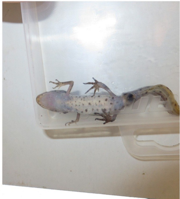
Slika 2 Mali vodenjak ženka