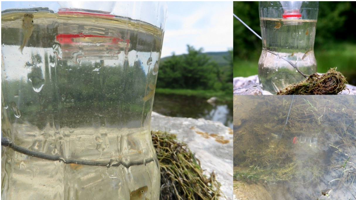
Slika 27 Živolovka

Prilikom vršenja terenskih istraživanja korištena je i ostala oprema kao što su mjerni instrumenti: termometar za mjerenje temperature vode i zraka, digitalna vaga za mjerenje težine uhvaćenih primjeraka vodenjaka te pomična mjerka za mjerenje duljine vodenjaka (slika 28).