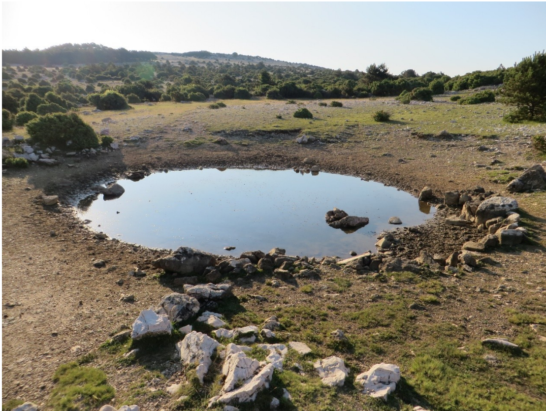
Slika 16 Lokva Kaljužina

Podatke o fizikalnim– kemijskim parametrima vode u lokvi Kaljužina utvrdila je Javna ustanova Priroda. Parametri na datum 12.1.2016 iznosili su temperatura 8,93°C - pH 8,09 - otopljeni kisik 49,1% - salinitet 0,12‰ .