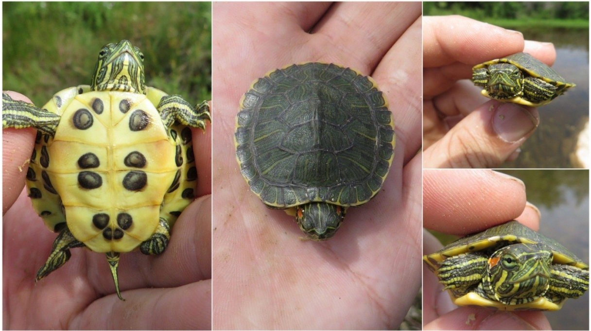
Slika 40 crvenouhe kornjače u lokvi Misučajnica