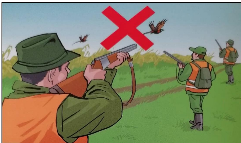
Sl.6. Opasan lov preko prostora drugih lovaca [8]

Isto tako pri upotrebi lovačkog oružja pojedinci ne vode brigu o smjeru pucanja, pa ranjavaju kolegu lovca ili šetača misleći da je divljač [8].