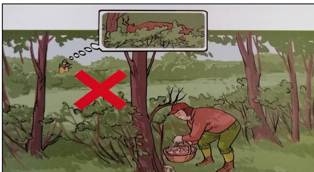
Sl.8. Opasan lov ne razmišljajući o smjeru lova [8]