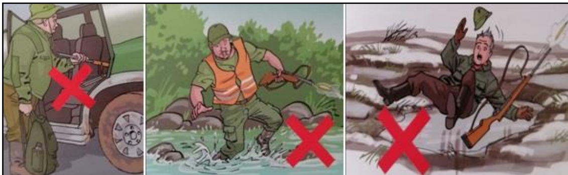
Sl. 10. Opasnosti pojedinačnog lova [8]

Kod pojedinačnog lova koji je jednostavan i ne zahtjevan za razliku od skupnog lova, sigurnosne mjere su odgovorno rukovanje oružjem, te korištenje zaštitne opreme poput prsluka i odgovarajuće zaštitne obuće.