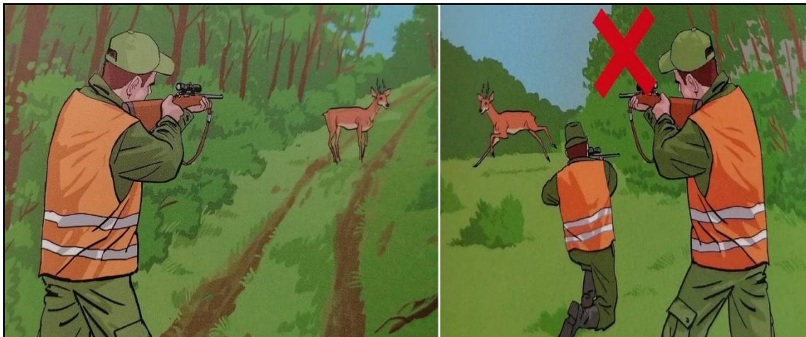
Sl.7. Primjer sigurnog i opasnog lova [8]