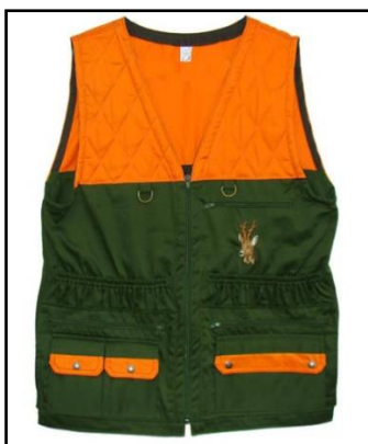
Sl. 13. Lovački prsluk s reflektirajućim elementima [12]

Kako bi lovcima bio što ugodniji lov, oni sa sobom ne nose torbe za osobne stvari i streljivo, već sve to nose u prsluku. Upravo zato je bitno da prsluk ima puno džepova i podebljane džepove za nositi streljivo, odnosno metke, te se i iz tog razloga smatra elementom zaštite. Podebljani džepovi štite streljivo od vanjskih oštećenja, te tako omogućava ispravno funkcioniranje u vatrenog oružja i samim time očuvanje lovca od ozljeda koje nastaju korištenjem neispravnog streljiva.