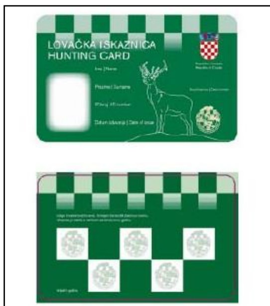
Sl. 2. Izgled lovačke iskaznice [4]

Lovačka iskaznica je javna isprava kojom se lovcu dokazuje da je osposobljen za obavljanje lova, izdaje ju Hrvatski lovački savez na zahtjev lovca, s rokom trajanja na pet godina, uz važeću identifikacijsku markicu koja se izdaje za pojedinu lovnu godinu.