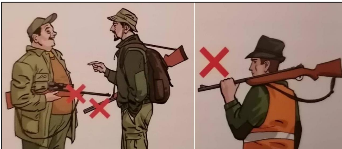
Sl. 9. Nepravilno držanje oružja u lovu [8]

Također među ove opasnosti spada i neadekvatno nošenje oružja, koje predstavlja veliku opasnost ukoliko se nosi vodoravno, te ga je potrebno nositi okomito na leđima da cijev gleda u zrak. Isto to oružje se treba prenositi u koferima ili navlakama, te se držati u posebnom ormaru pod ključem odvojenim od streljiva.