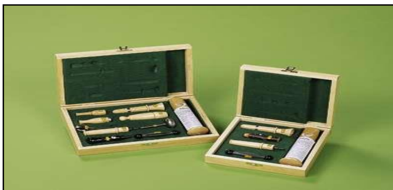
Sl. 5. Prikaz nekad korištenih vabilica [5]

Vabljenje kao način lova se primjenjuje na lov običnog jelena, jelena lopatara, srnjaka, lisica i šojki kreštalica. Također lov vabljenjem treba biti u točno određeno vrijeme, tako se primjerice jelenska divljač vabi za vrijeme sezone parenja, a lisica oponašanjem glasanja njenog plijena.