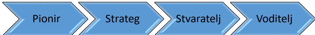
Slika 1: Vrste poduzetnika

Životni ciklus poslovanja poduzeća sastoji se od nekoliko faza. U svakoj pojedinoj fazi nalazi se određeni tip poduzetnika koji ima i pripadajuće osobine. S obzirom na to poduzetnike klasificiramo na četiri grupe.