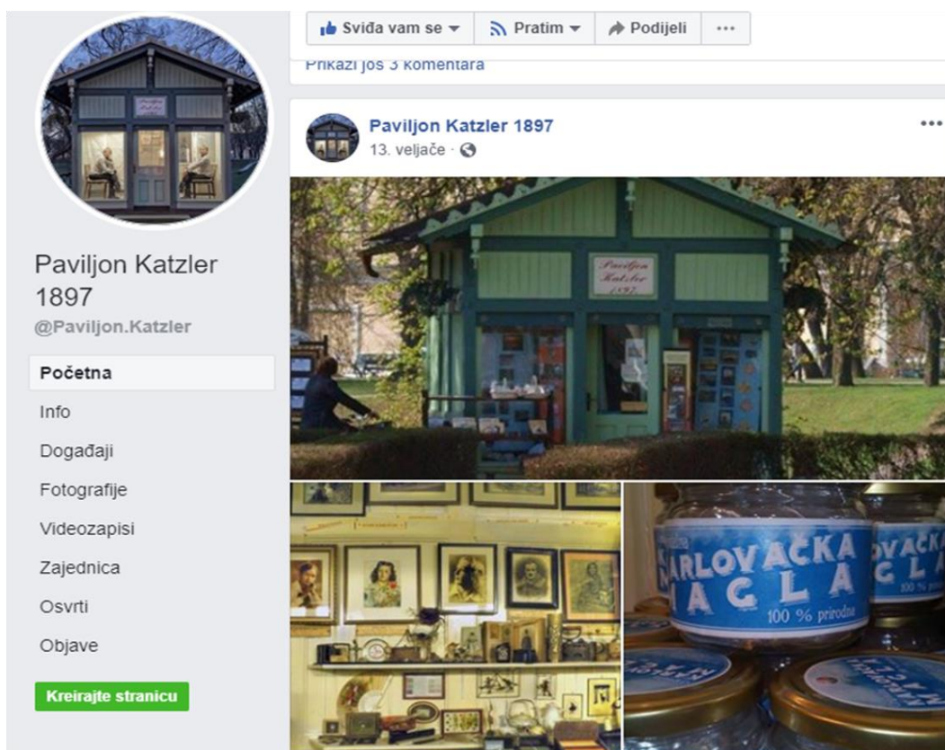
Slika 12. Facebook stranica Paviljona Katzler 1897.