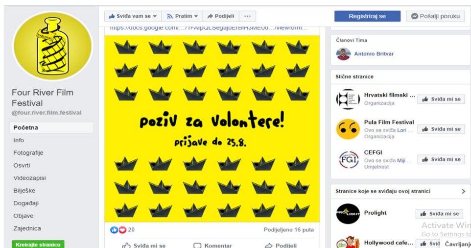
Slika 18. Facebook stranica FRFF-a