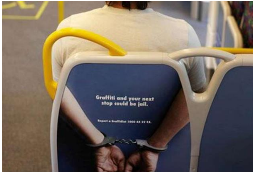
Slika 8. Naljepnice na sjedalima australskih autobusa i vlakova