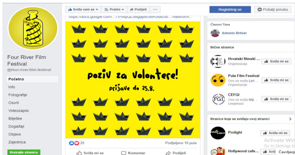
Slika 18. Facebook stranica FRFF-a