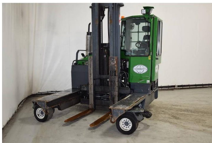
Sl. 20. Osiguranje radne sigurnosti

Nakon završetka rada s viličarom, isti je potrebno parkirati na za to označeno mjesto. Potrebno je izvršiti preventivni vizualni pregled kako bi sljedeće korištenje viličara bilo sigurno i bez opasnosti za vozača i druge osobe na radu. Potrebno je: vilice spustiti na tlo, poravnati teleskop u neutralni položaj, povući ručnu kočnicu kako bi se izbjeglo neželjeno gibanje viličara, postaviti sve komande u neutralni položaj.