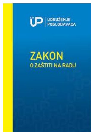
Sl. 14. Knjiga Zakona o zaštiti na radu

Na kraju nastave polaznici pišu test znanja. Test znanja obuhvaća pitanja iz svih cjelina koje obuhvaća nastava. Na svako pitanje zaokružuje se jedan odgovor. Potrebno je riješiti 80 % točno testa znanja. Za praktičnu nastavu izdaje se potvrda. Kada polaznik uspješno položi test znanja i praktičnu nastavu izdaje mu se uvjerenje