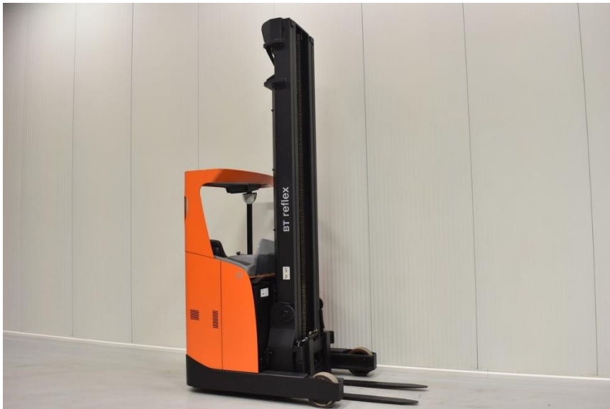
Sl. 7. Regalni viličar

Regalni viličar – jesu stacionirani uređaji namijenjeni upravljanju teretom u visoko automatiziranim i dobro organiziranim skladištima. Konstrukcijsko rješenje regalnih viličara bazira se na tome da se sklop uređaja za podizanje tereta oslanja na čvrstu točku oko koje se može okretati 90° lijevo i 90° desno od uzdužne središnjice. Cijelom sklopu omogućeno je kretanje po poprečno postavljenim vodilicama od krajnje lijeve do krajnje desne bočne točke viličara, što stroju omogućava potpuni manevar.