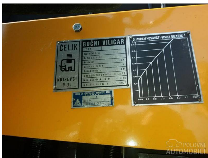
Sl. 9. Nosivost viličara

Nosivost viličara je veličina u kilogramima ili tonama, koju bez posljedica, sigurno diže, nosi i prevozi viličar pri ispravnom rukovanju i normalnim uvjetima u radnom okolišu. Nosivost je strogo definirana i limitirana kategorija o kojoj vozač i organizatori moraju voditi posebnu brigu. Svako prekoračenje iste može prouzročiti višestruku štetu na teretu i vozilu kao i opasnost za vozača. Nosivost viličara upisana je u dokumentaciji koja ide uz njega, dok je na viličaru označena ili u pravilu upisna na pločici koja je pričvršćena na vidnom mjestu u kabini vozača.