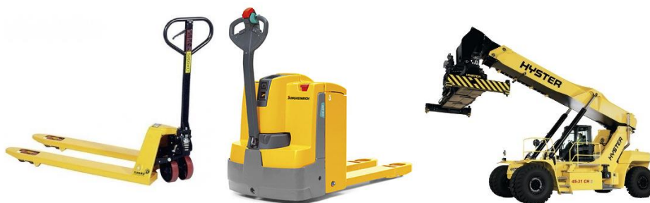
Sl. 8. Viličari različitih namjena