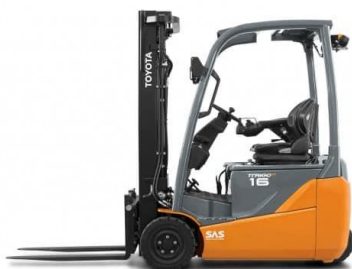
Sl. 5. Čeoni viličar

Čeoni viličar – najzastupljeniji tip viličara. Podizanje i spuštanje tereta obavlja vilicama vođenim po grani koja je smještena u prednjem dijelu i u smjeru gledanja vozača, zbog čega je i nazvan čeoni. Proizvodi se za sve standardizirane nosivosti od 1.2 tone nadalje. Funkcionalnost čeonog viličara ostvaraju se uzajamnim radom mehaničkih, hidrauličkih i elektro sklopova te pogonske jedinice. Svi sklopovi smješteni su u zatvorenoj i robusnoj metalnoj konstrukciji. U svakodnevnoj praksi susrećemo različite tipove čeonih viličara, koji se međusobno razlikuju po nizu detalja, bilo da se radi o ustroju funkcije ili izgledu. Prijenos snage kod čeonih viličara može se vršiti električnim, pneumatskim, mehaničkim ili hidrauličnim putem. Pri tome se pod hidrauličkim prijenosom snage podrazumijevaju dvije vrste prijenosa: hidro-statički i hidro-dinamički. [1]