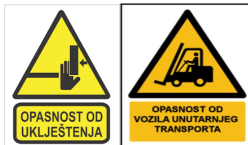
Sl. 16. Znakovi opasnosti

Poslodavac je obavezan na mjestima rada i sredstvima rada trajno postaviti postaviti sigurnosne znakove na vidljivim mjestima. Ako sigurnosni znakovi nisu dovoljni za djelotvorno informiranje osoba na radu, poslodavac je obavezan postaviti i pisane obavijesti i upute o uvjetima i načinu korištenja sredstava rada i sl. Sigurnosne oznake moraju biti postavljene na vidljivim mjestima.