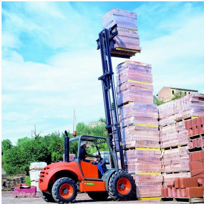
Sl. 18. Propisani prilaz teretu