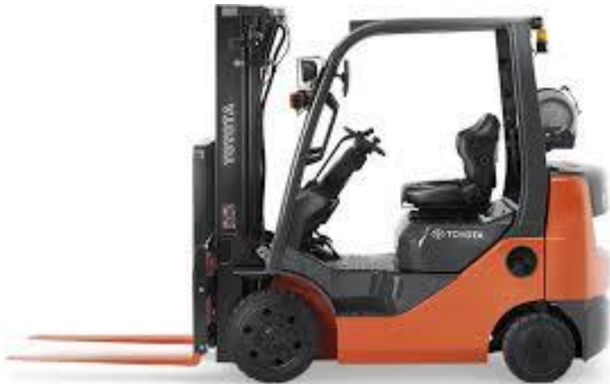
Sl. 2. Moderna izvedba viličara

U nastavku rada biti će opisano osposobljavanje i mjere zaštite pri radu s viličarom, određeni pravilnici koji diktiraju pravila ponašanja te vrste, karakteristike i građa viličara.