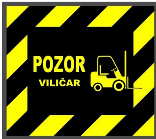
Sl. 4. Opasnost od vozila unutarnjeg transporta

Vrlo učinkovita i edukativna mogu biti razna upozorenja izražena crtežima u kombinaciji sa prometnim znakom. U velikim i dobro organiziranim skladištima u kojima je prometna frekvencija vrlo velika ugrađuju se i dvostruka vrata s označenim pješačkim dijelom prolaza.