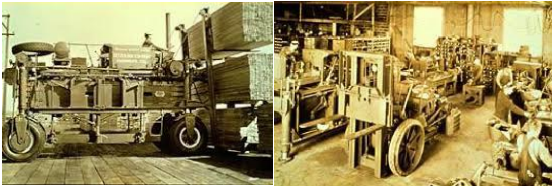
Sl. 1. Prve izvedbe viličara

Viličari su razvijeni iz dizala, koja su se koristila kao osnovno sredstvo za podizanje i premještanje teških tereta različitih oblika u kasnim godinama 19. stoljeća. Ova dizala su u suštini sastavljena od lanaca i poluga te se nakon toga pojavljuju drvene platforme u obliku kamiona. Ubrzo nakon toga, drveni kamioni dobivaju elektromotore i baterije.