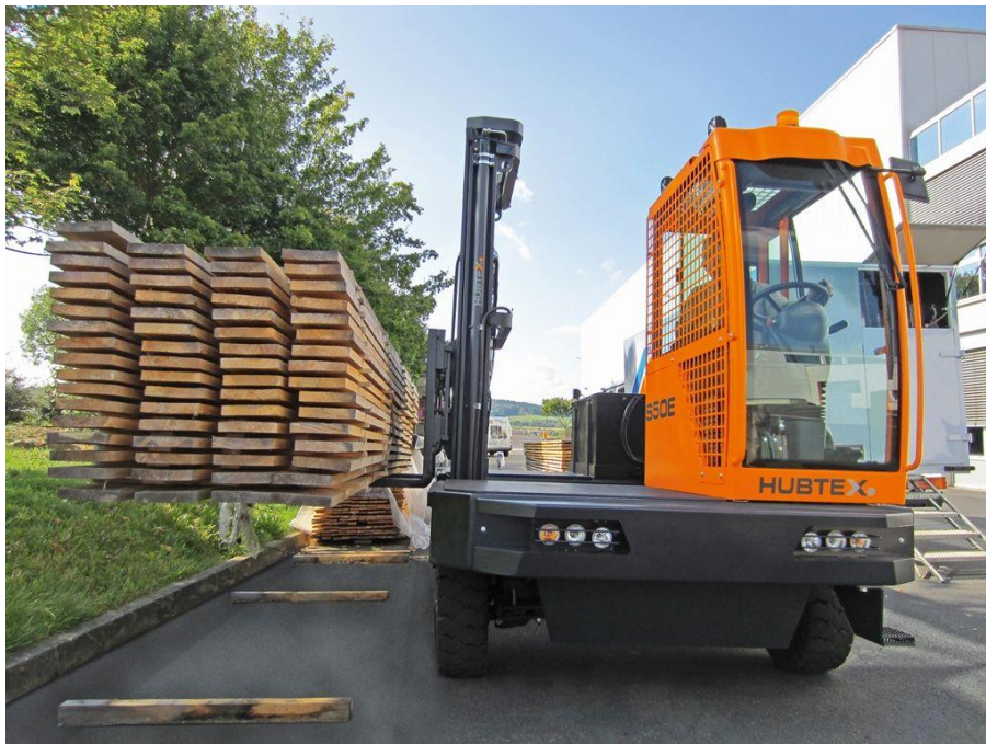
Sl. 6. Bočni viličar

Bočni viličar – ovu vrstu viličara sačinjavaju isti ili vrlo slično riješeni sklopovi kao i kod čeonog viličara, ali je uređaj za podizanje tereta na njegovom desnom boku. Premještanjem vilica, s čela na bok, uz odgovarajuću izmjenu konstrukcije, dalo je klasičnom konstrukcijskom rješenju viličara novu kvalitetu – mogućnost horizontalnog i vertikalnog pomicanja tereta. Bočni viličar namijenjen je za manipulacije tereta većih težina i dimenzija, stoga je vrlo dobro prihvaćen u drvnjoj i metaloprerađivačkoj industriji. Bočni viličar karakterizira velika stabilnost i maksimalno izvučen uređaj za podizanje tereta, a na tu stabilnost utječe relativno velik razmak kotača, niska točka težišta, te raspored tereta koji neutralizira aktivne dinamičke sile, dok je ukupna težina raspoređena na sva četiri kotača.