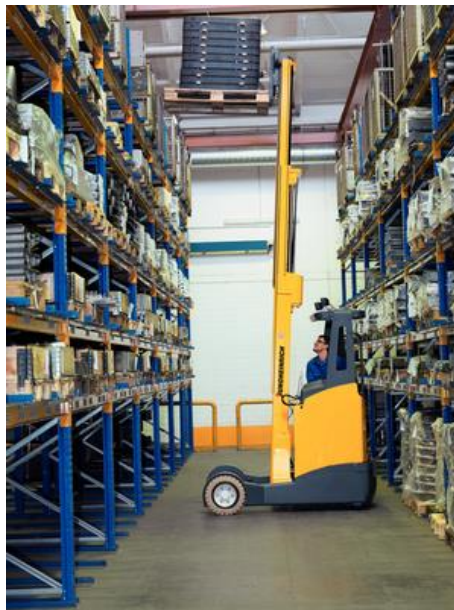
Sl. 19. Skladištenje tereta