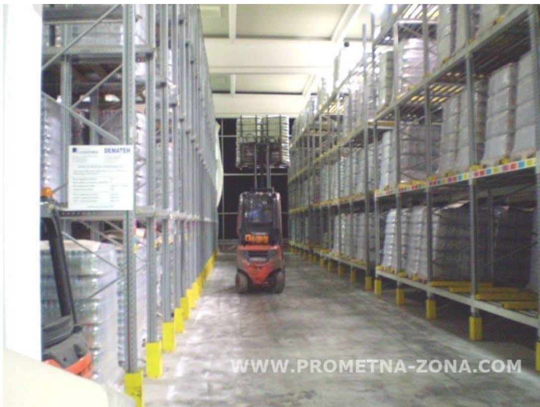
Sl. 10. Prohodnost viličara u radu

Kako su transportni putevi različiti s obzirom na kosine i ravnine, mogućnost savladavanja puteva je različita kod pojedinih viličara. Prohodnost viličara je sposobnost viličara da savlada nepropisne profile puta. Prohodnost viličara određena je slobodnom visinom viličara. Također je bitna napomenuti da na prohodnost viličara utječu njegova veličina i sama organizacija radnog prostora. Čest je slučaj da je prohodnost viličara u skladištima ograničena, ne samo zbog tehnički uvjeta, nego i zbog nepropisnog odlaganja tereta i nestručnog vođenja samog skladišta.