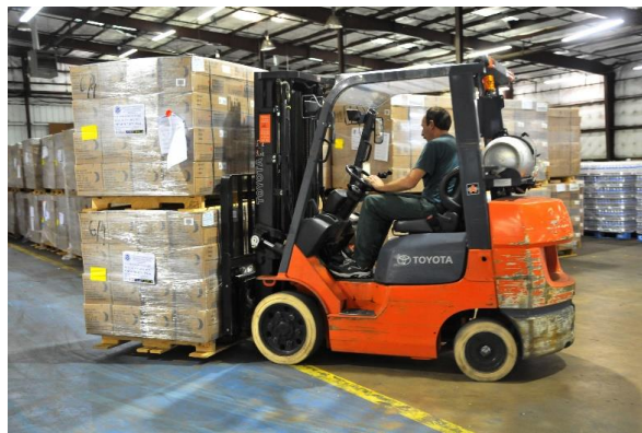
Sl. 3. Viličar u unutarnjem transportu

Neizravan ili izravan lanac transporta je prisutniji u svakodnevnoj praksi, a u njegovom čvorištu javljaju se dodatne transportno-upravljačke i utovarno-pretovarne operacije što zahtjeva i novu aktivnost viličara. Kako bi se smanjile posljedice nedostataka, koji rezultiraju povećane troškove, odnosno da bi se oni sveli na podnošljivu mjeru, provedeno je u transportu i rukovanju niz racionalizacija. Rezultat je nekoliko novi kombiniranih i integralnih sustava transporta, kao što su paletizacija, kontenerizacija, ro-ro i drugi, pri kojima efikasnost viličara dolazi do izražaja. Univerzalna primjenjivost viličara posebno dolazi do izražaja pri njegovom korištenju kao sredstva za obavljanje unutrašnjeg transporta. U tom sustavu viličari su nerijetko sastavni element tehnološkog procesa. [1]