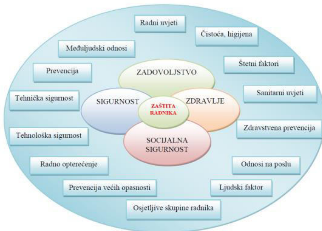
Slika 1. Aspekti rada koji utječu na zaštitu radnika