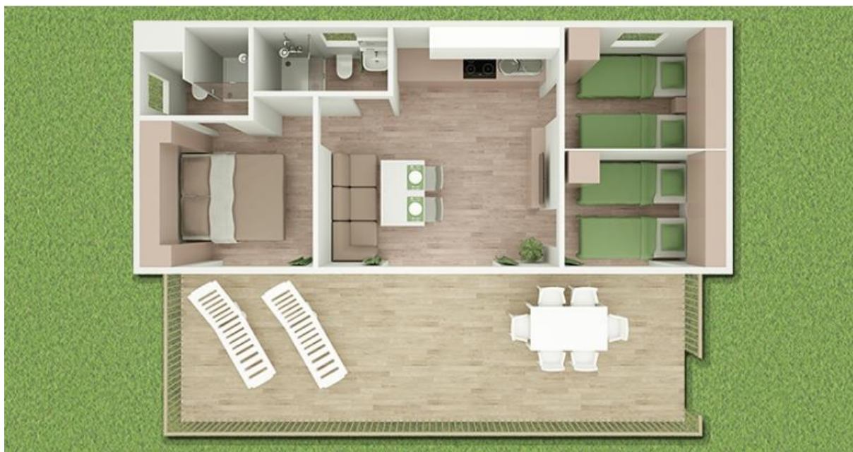
Slika 3. Lungomare premium camping homeovi sa spektakularnim pogledom