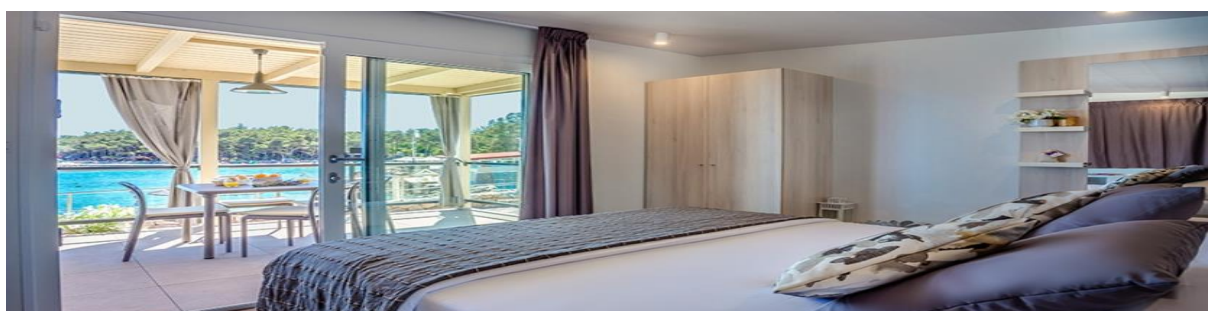
Slika 5: Lungomare Premium Romantic Camping Chalet