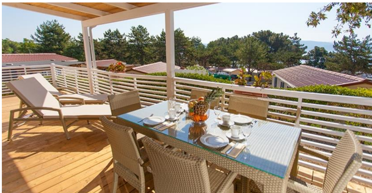
Slika 2: Mobilna kućica Lungomare Premium Family