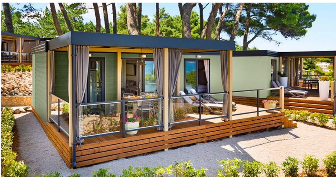
Slika 4. Family Camping Home u Kampu Ježevac