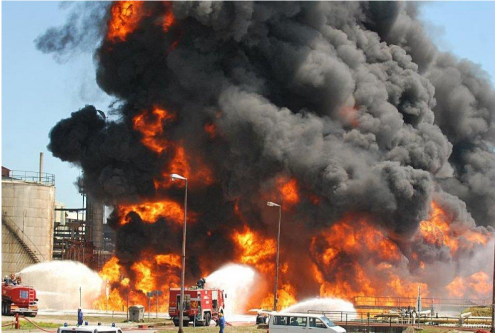
Slika 5. Požar u rafineriji nafte Sisak [31]

američkim sustavom Patriot. Uz američki sustav mnoge zemlje koriste i ruski obrambeni raketni sustavi S-300 ili najnoviji S-400 Triumph.