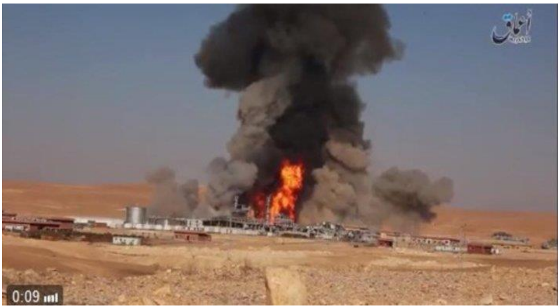
Slika 3. Plinsko postrojenje INA-e u Siriji dignuto u zrak [29]

priprema velike ofenzive sirijske vojske i boraca Hezbollaha za povratak grada Palmire koji se nalazi blizu tih polja, kojeg je ISIL ponovno u munjevitoj ofanzivi zauzeo 11. prosinca 2016., te kako u slučaju ponovnog zauzimanja od strane režima ne bi imali koristi od tog plinskog postrojenja.