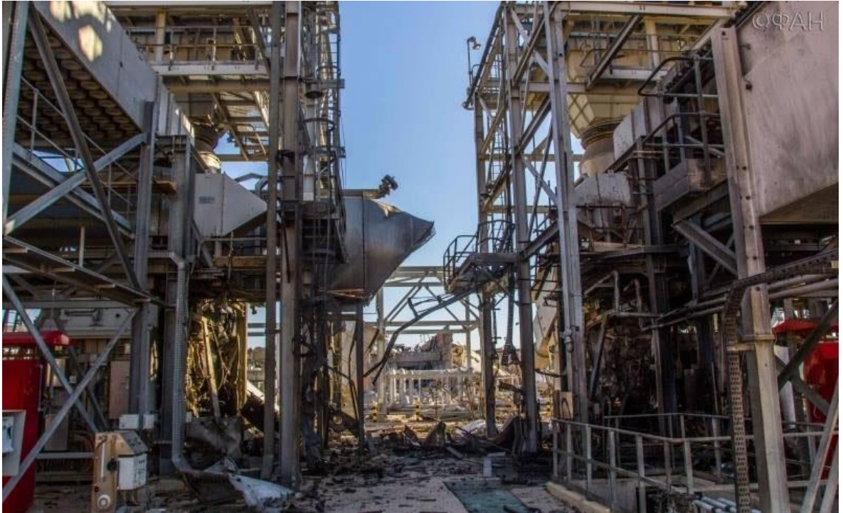
Slika 4. Bivše bušotine INA-e u Siriji nakon napada [30]

https://www.logicno.com/wp-content/uploads/2017/02/bivsa-inine-busotine-1.jpg