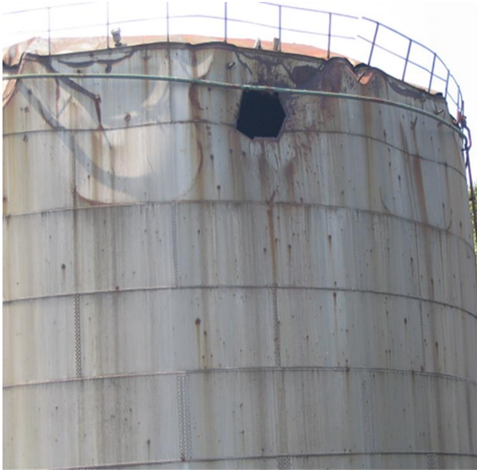
Slika 1. Spremnik nafte pogoden granatom [27]

Benković, Tehnička zaštita industrijskog postrojenja za preradu nafte od terorizma, UDK:331.45:323.285