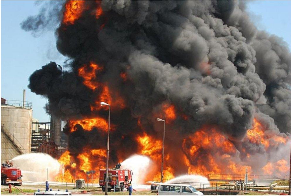
Slika 5. Požar u rafineriji nafte Sisak [31]

američkim sustavom Patriot. Uz američki sustav mnoge zemlje koriste i ruski obrambeni raketni sustavi S-300 ili najnoviji S-400 Triumph.