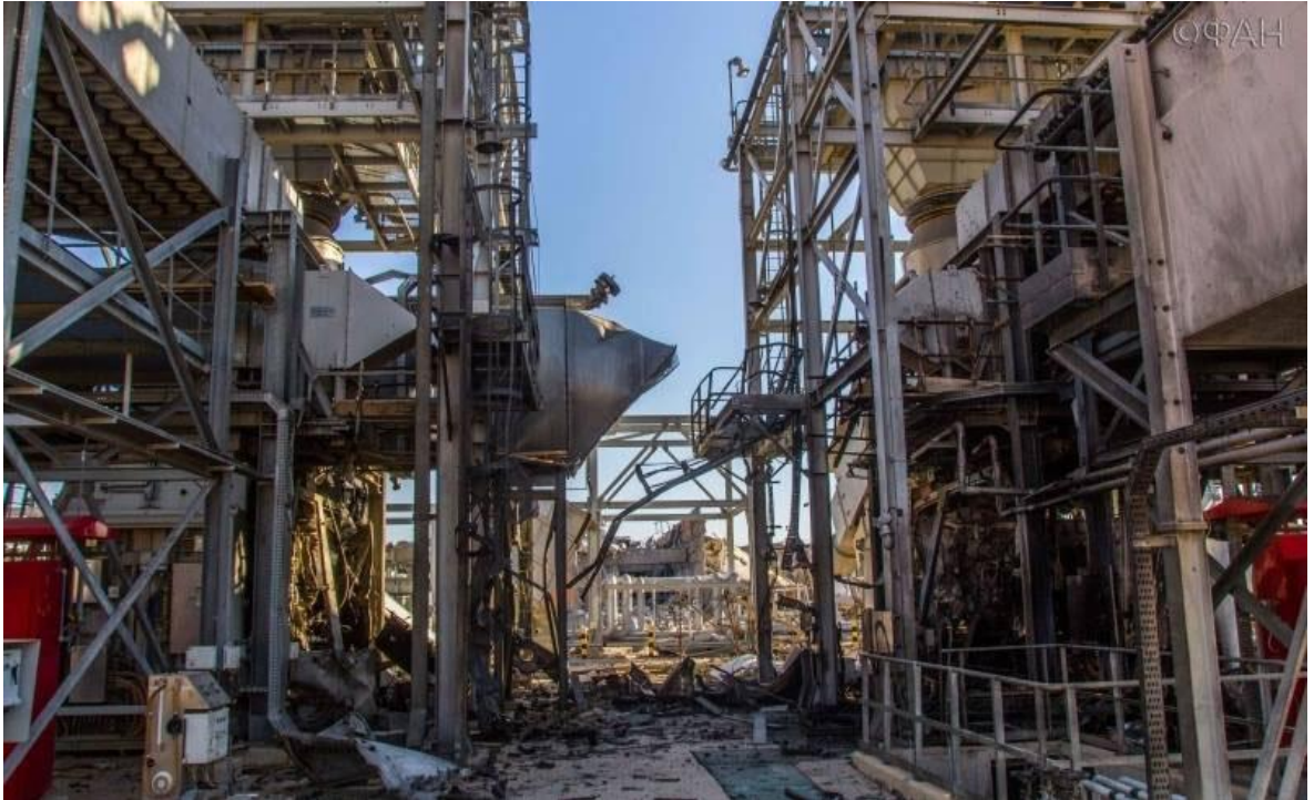
Slika 4. Bivše bušotine INA-e u Siriji nakon napada [30]

https://www.logicno.com/wp-content/uploads/2017/02/bivsa-inine-busotine-1.jpg