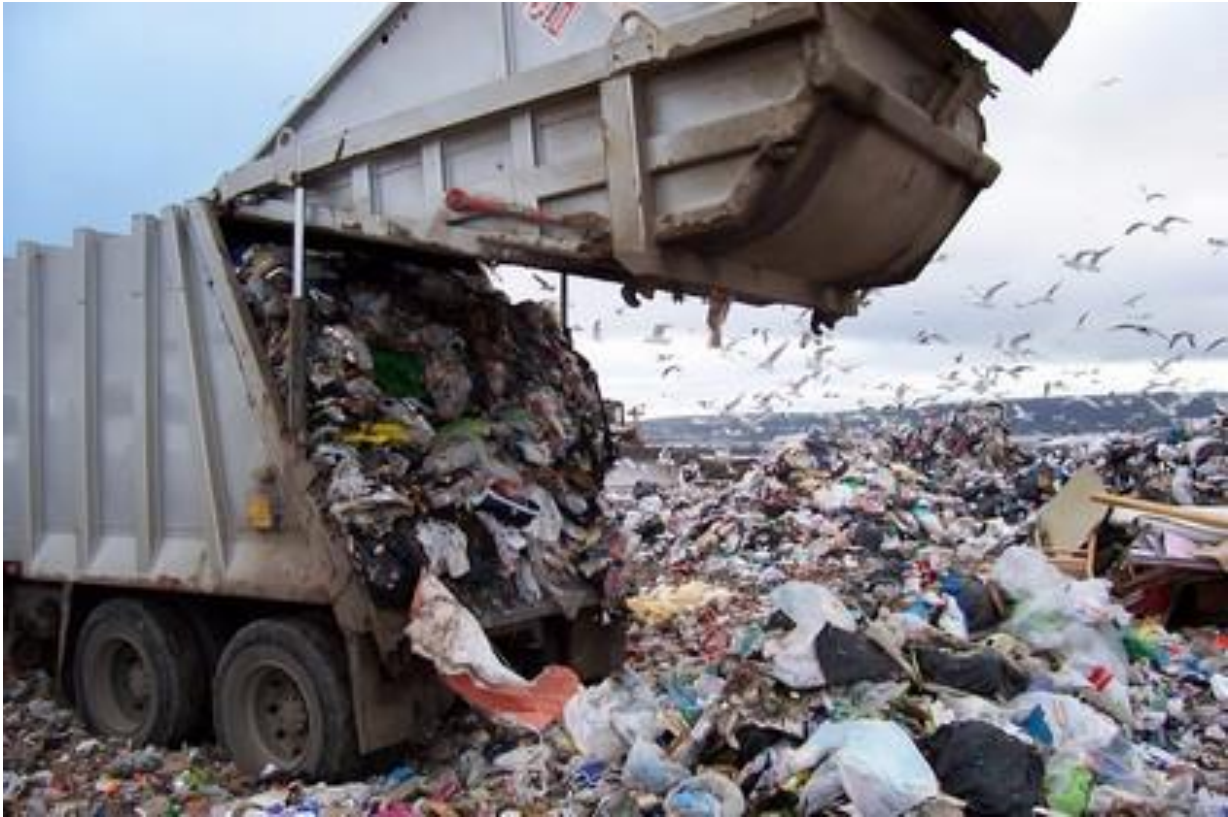
Slika 7: Otpad

Tlo čovjek i industrija onečišćuju ne samo kemijskim toksičnim tvarima nego i odlaganjem velikih količina glomaznog otpada – od ambalaže do glomaznoga komunalnog otpada: starih hladionika, televizora, strojeva za pranje rublja, automobila, automobilskih guma, limenih konzervi, plastičnih vrećica, boca i tome slično. Sporom razgradnjom taj otpad ostaje u ljudskom okolišu dugotrajno, a sve veće nove količine otpada smanjuju raspoložive površine tla. Kao sinonim za otpad često se rabi izraz smeće, kojim se inače označuje i pomiješani otpad iz kućanstva, industrije itd.