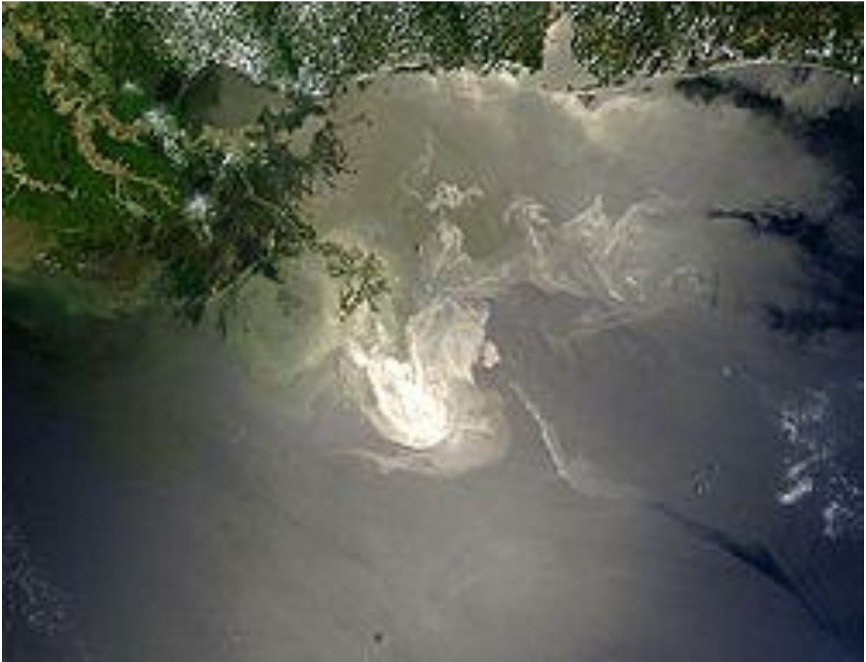
Slika 3: Satelitska snimka izljeva nafte, 24. Svibnja2010.

Izljev nafte u Meksičkom zaljevu 2010., znan i kao Izljev nafte BP-a, Deepwater Horizon katastrofa i Macondo puknuće, je bio masovni 3-mjesečni izljev nafte u Meksičkom zaljevu koji se dogodio 20. Travnja 2010. Godine te je nakon mjesec dana nezaustavljivog širenja naftne mrlje proglašena najvećom naftnom ekološkom katastrofom američke povijesti, čime je čak nadvisila katastrofalni izljev nafte iz Exxon Valdeza 1989.