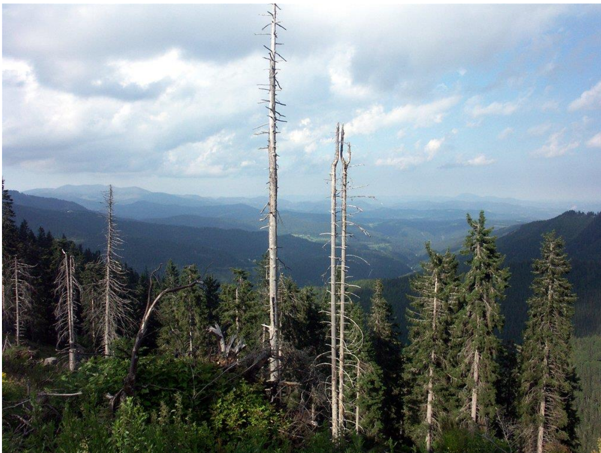
Slika 2: Najčešći uzrok nestajanja šuma su kisele kiše