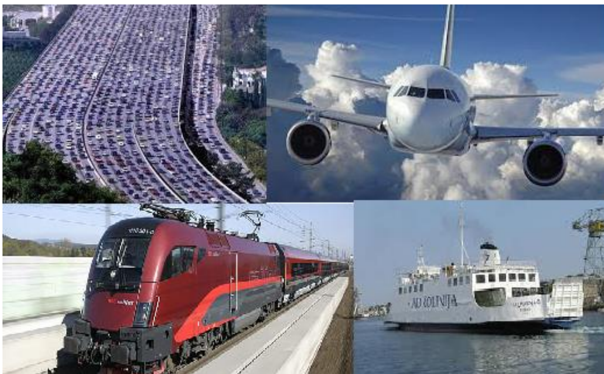
Slika 6: Vrste prometa

Promet je ne samo važan, već i nezaobilazan čimbenik gospodarskog i društvenog razvoja, osobito nakon industrijske revolucije do danas.