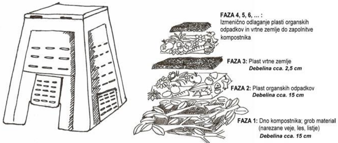
Slika 9: Kompostiranje

Da bi se smanjila količina otpada preporučuje se potaknuti i poučiti građane da sami kompostiraju vlastiti dio organskog otpada. Tako mogu proizvesti vlastiti kvalitetan kompost, bez značajnijeg ulaganja u opremu, s minimalnim vlastitim radom.