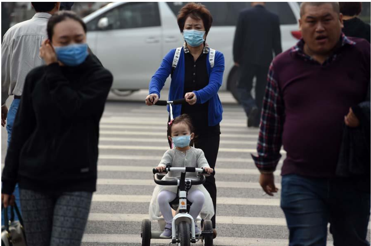
Slika 13: Svakidanašnjica ulica Pekinga