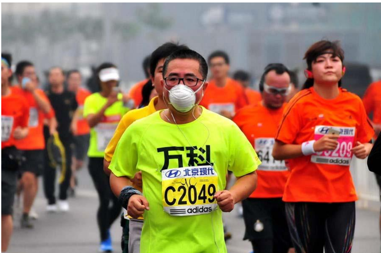
Slika 14: Maratinci u Pekingu

Razina štetnih čestica u zraku (PM2.5), koje se povezuju s izazivanjem bolesti srca i pluća, iznosila je 244 mikrograma po metru kubičnom. To je čak 14 puta više od razine koju Svjetska zdravstvena organizacija smatra sigurnom.