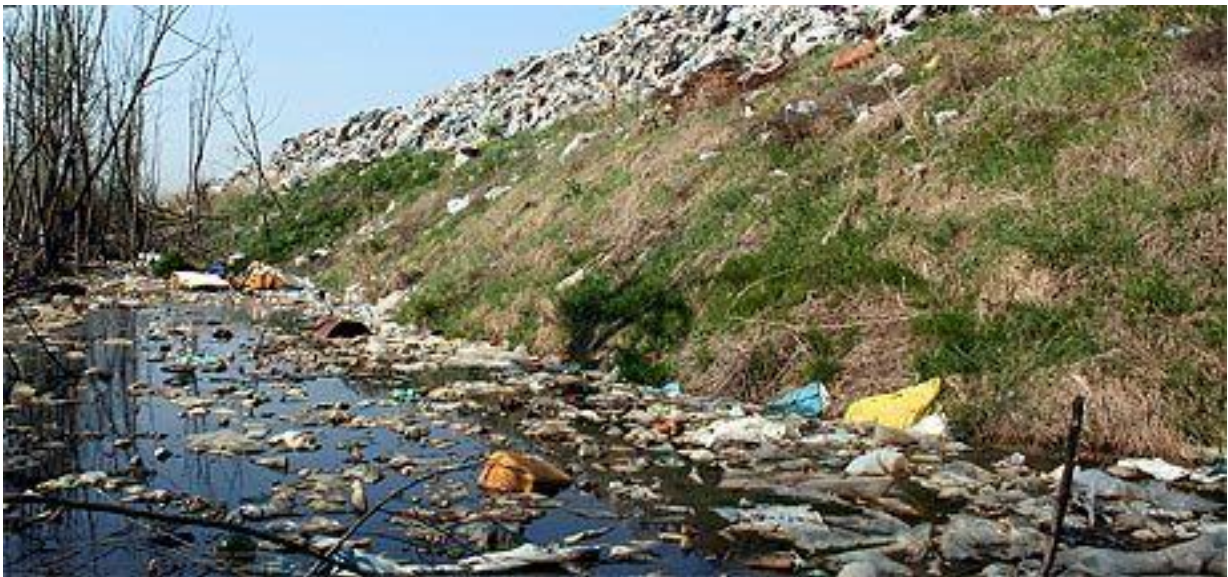
Slika 10: Deponij u Karlovcu, Ilovac

su 1994. godine prihvatile propis o izgradnji trajnih odlagališta otpada, a u pripremi je i novi propis o odlaganju otpada. Njime će se ograničiti odlaganje otpada koji bude sadržavao više od 5 % ugljika organskog podrijetla. Otpad koji se odlaže vrlo je aktivan. Procesom raspadanja organskog dijela nastaje deponijski plin, a u dodiru otpada s vodom nastaju procjedne vode.