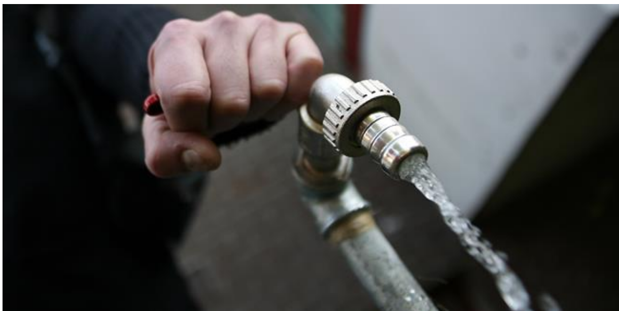
Slika 15: Zabranjena voda iz slavine

"Stanovnici pogođenih područja Zapadne Virginije se mole da ne koriste vodu iz slavine za piće, kuhanje, pranje ili kupanje", priopćio je guverner te države. Zdravstveni radnici su upozorili da bi se voda trebala koristiti samo za ispiranje WC školjki i gašenje požara.