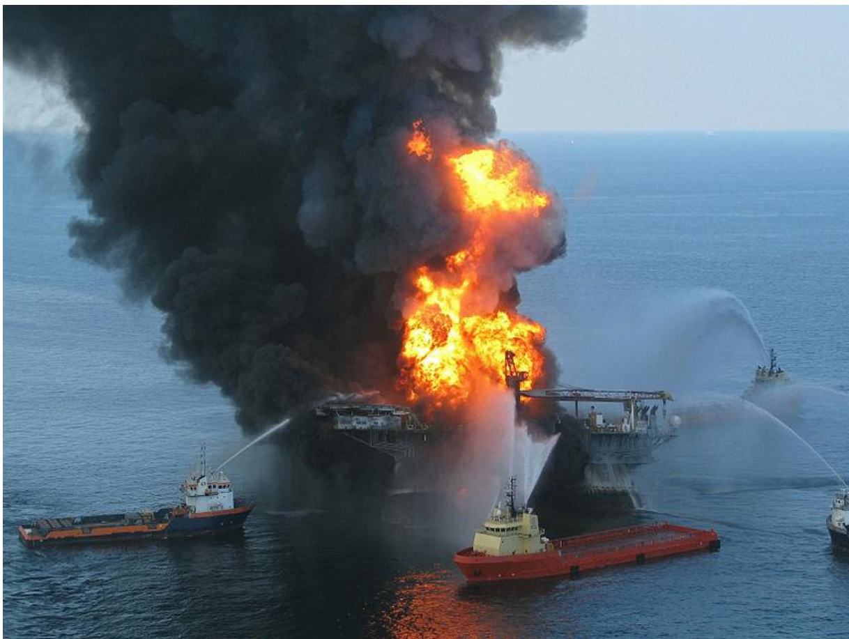
Slika 4: Naftna platforma Deepwater Horizon nakon eksplozije

Uzrok je erupcija nafte sa morskog dna koja je nastala nakon puknuća i eksplozije naftne platforme Deepwater Horizon 20. Travnja 2010 u Atlantskom oceanu u blizini savezne države Louisiana. Za platformu je bio odgovoran British Petroleum.