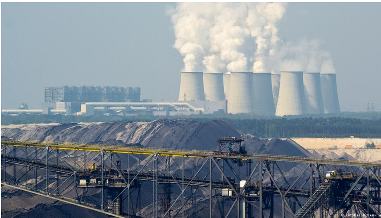
Slika 1: Njemačka je jedan od najvećih zagađivača zraka