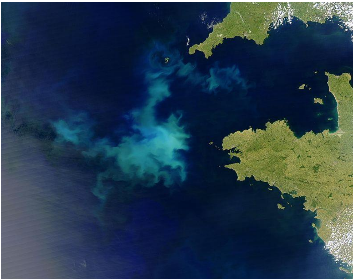
Slika 5: Cvjetanje algi u Atlantiku

Posebnu štetu tlu pa i cjelokupnom ekosustavu nanose brojni i raznoliki pesticidi, tj. preparati za zaštitu kojima se u poljoprivrednoj proizvodnji uništavaju nametnici i štetnici, tj. uzročnici različitih bolesti, korov i drugo.