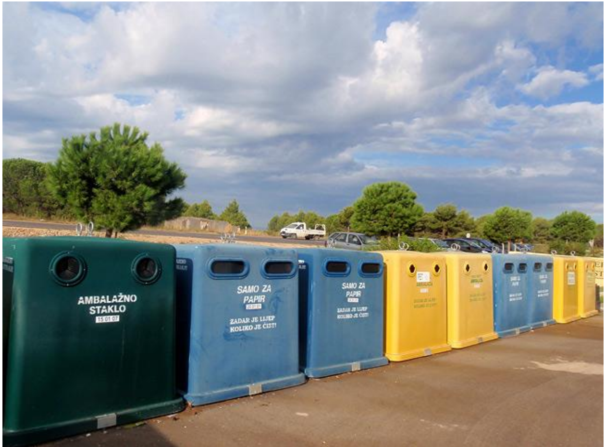
Slika 8: Odvojeno sakupljanje otpada

Prije industrijske upotrebe ovako skupljeni materijali moraju se sortirati, jer je inače teško postići da se u pojedinom spremniku ne nađe i nešto što se ne bi smjelo u njemu naći. Udio izdvojenih otpadnih materijala ovisi o organiziranosti u društvu i o kulturi življenja.