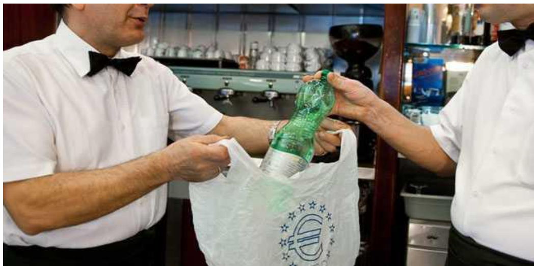
Slika 16: Upotreba plastičnih vrećica

BRUXELLES - Vijeće Europske unije izglasalo je prijedlog Komisije o prijedlogu direktive koja ima za cilj smanjenje uporabe plastičnih vrećica, a koji je Hrvatska nastojala promijeniti kako bi zaštitila domaće proizvođače tih vrećica, doznaje se iz europskih izvora.