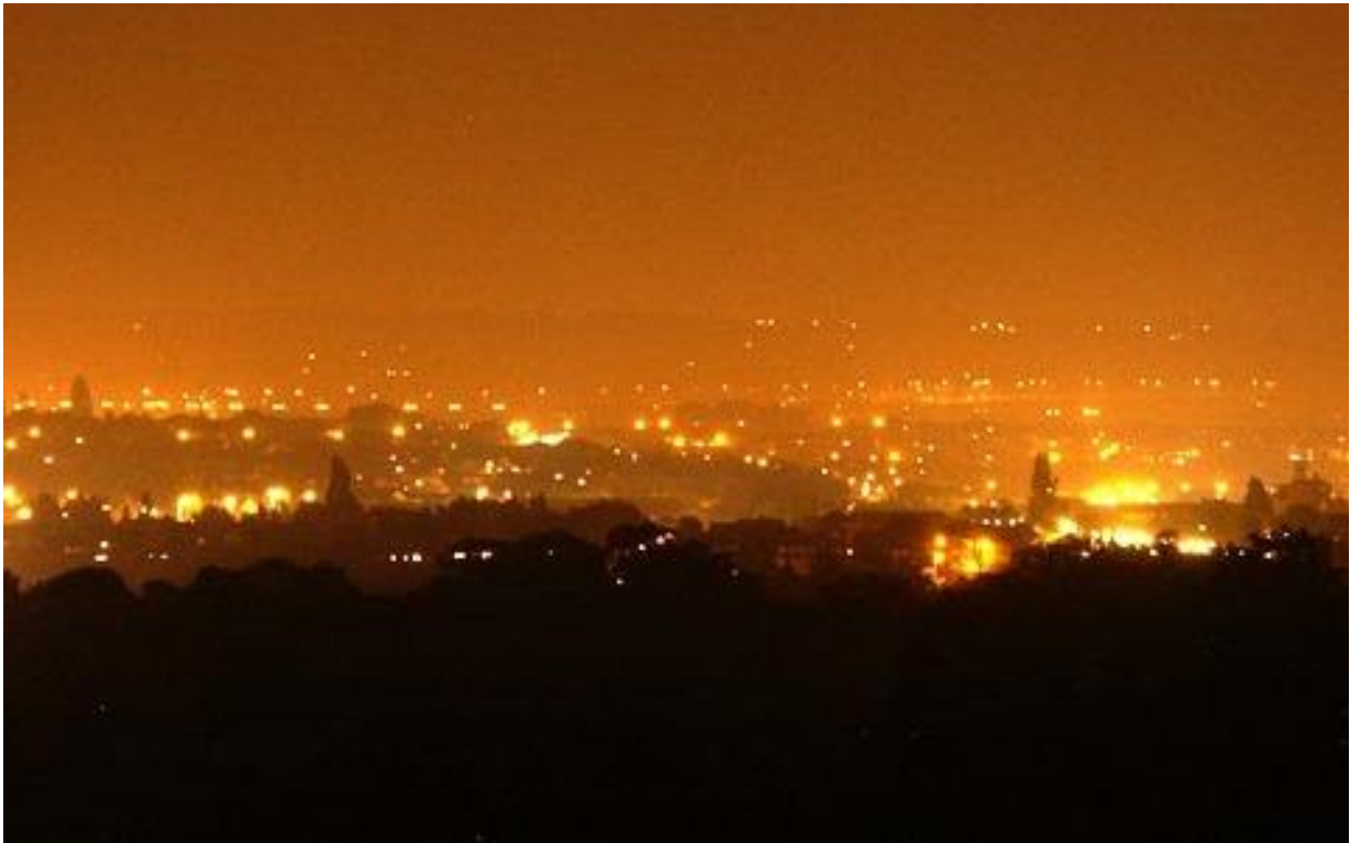
Slika 11. Svjetlosno onečišćenje

Svjetlosno onečišćenje (zagađenje) svako je suvišno rasipanje umjetne svjetlosti izvan područja, koje je potrebno osvijetliti (nepotrebna i prekomjerna rasvjeta), tj. promjena razine prirodne svjetlosti u noćnim uvjetima uzrokovana unošenjem svjetlosti proizvedene ljudskim djelovanjem. Uzrokuje mnoge štetne pojave poput zdravstvenih problema, narušavanja ekosustava te remećenja astronomskih promatranja. Od 80-ih godina 20. Stoljeća razvio se pokret protiv svjetlosnog onečišćenja s ciljem njegova smanjenja. U mnogim državama postoje zakoni koji reguliraju ovu problematiku. Najveće svjetlosno onečišćenje prisutno je u razvijenim industrijskim državama.