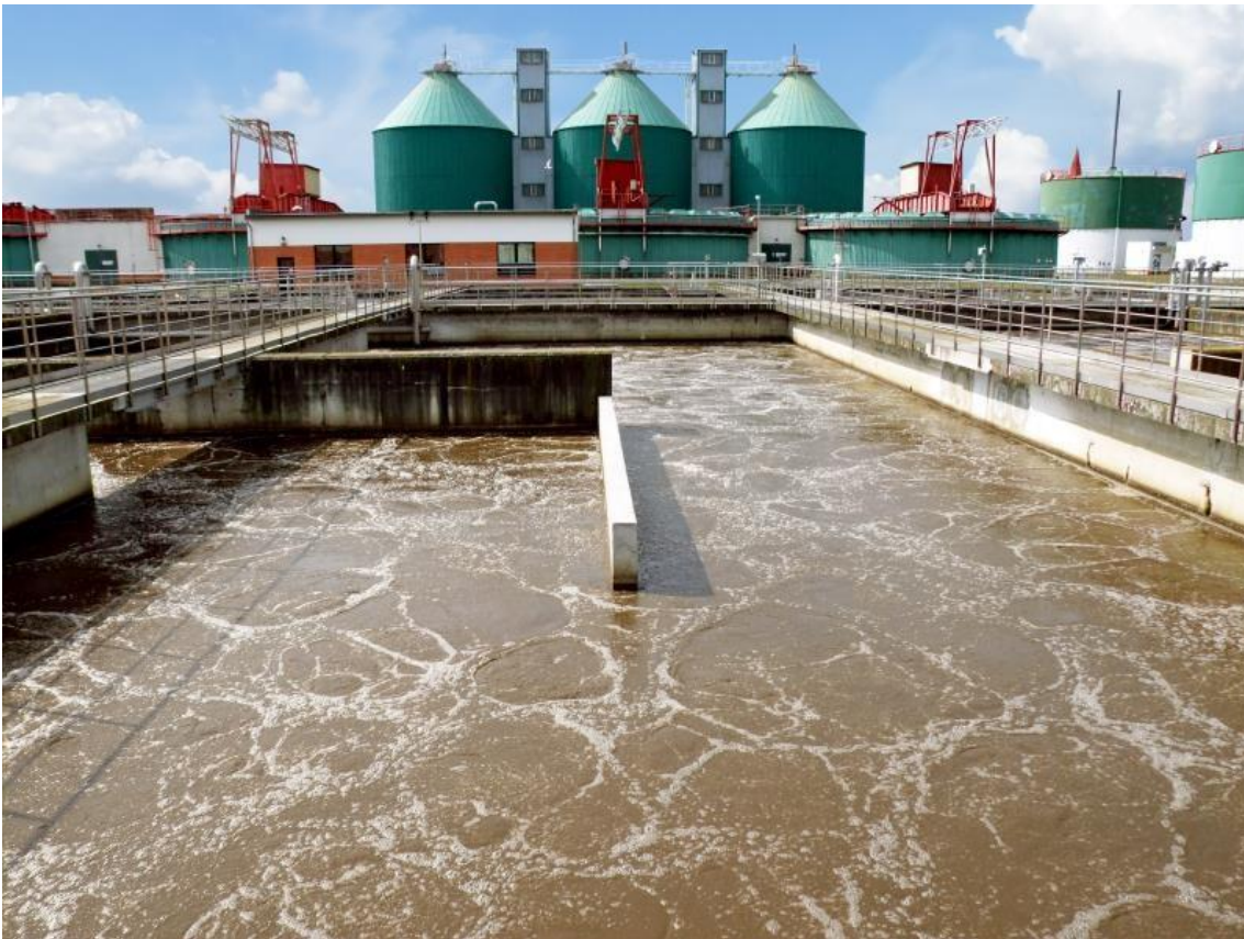
Slika 2. Industrijske otpadne vode [2]

Na slici 2. u nastavku vidljiv je prikaz industrijskih otpadnih voda.