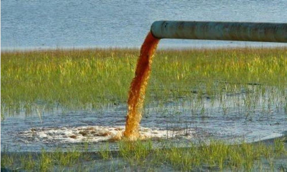
Slika 3. Poljoprivredne otpadne vode [3]