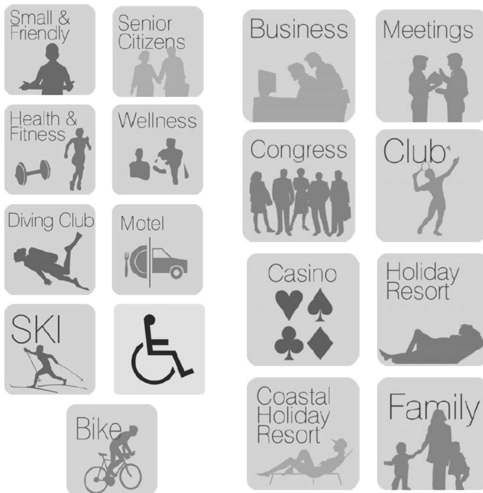
Slika 1: Ploče za označavanje posebnih standarda – grafička rješenja

Izvor: Prilog A. – uvjeti za hotel baština ( heritage ) Pravilnika o razvrstavanju, kategorizaciji i posebnim standardima ugostiteljskih objekata iz skupine hoteli, Narodne novine [online] https://narodne-novine.nn.hr/clanci/sluzbeni/dodatni/440747.pdf (Pristupljeno 12.06.2019.)