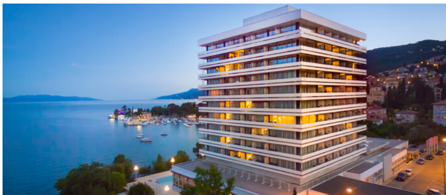
Slika 2: Ambassador hotel Opatija