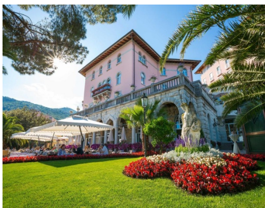
Slika 4: Amadria Park Hotel Milenij

WELLNESS &SPA hotela Ambasador podrazumijeva: whirlpool u zatvorenom prostoru, fitness, sparelux zona, beauty sobe - razni kozmetički tretmani, masažne sobe. S druge strane, Milenij Grand Hotel koji nudi simularan sadržaj, pripada kategoriji hotela sa 4 do 5 zvjezdica.