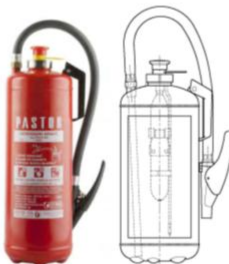
Slika 5. Vatrogasni aparat sa bočicom. [5]

Vatrogasni aparati s bočicom rade tako da igla preko udarnog gumba probuši membranu na bočici i dolazi do istjecanja CO 2 kroz uzбудnu cijev. CO 2 izlazi u spremnik gdje se nalazi prah kojeg rastresa te se stvara tlak u spremniku aparata od 12 – 15 bara. Kod aktivacije ove vrste vatrogasnog aparata potrebno je pričekati nekoliko sekundi od aktivacije do korištenja vatrogasnoga aparata da isteče sav CO 2 iz bočice. Kada jednom aktiviramo ovaj vatrogasni aparat ne možemo ga više naknadno koristiti već je potrebno obaviti servis kod ovlaštene osobe. [4]