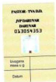
Slika 13. Naljepnica masa bočice. [1]

Masa bruto bočice ima određenu toleranciju mase koju je propisao proizvođač vatrogasnih aparata u tablici 7., odnosno koliko grama smije odstupati od propisane vrijednosti za pojedinu vrstu vatrogasnih aparata.