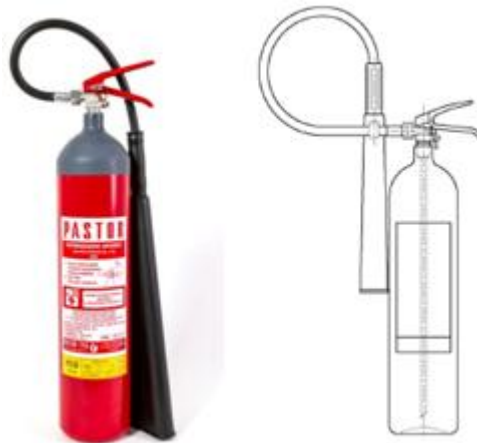
Slika 7. Vatrogasni aparat CO 2 5 kg. [5]

Vatrogasni aparati s CO 2 jednostavne su konstrukcije. Sastoje se od spremnika, usponske cijevi, ventila i mlaznice. Plin CO 2 se u njima nalazi u tekućem stanju. Nakon aktivacije CO 2 ekspandira i uz pomoć mlaznice ga usmjeravamo prema požaru. Namijenjeni su za gašenje požara u zatvorenom prostoru pod naponom, te razreda B i C. Kod upotrebe ovih vrsta vatrogasnih aparata postoji opasnost od gušenja u zatvorenom prostoru te je potrebno nakon upotrebe izvjetriti prostor. Ovaj tip vatrogasnih aparata proizvodi se u prijenosnoj verziji od 3 i 5 kg te u prijevoznoj verziji 10, 30 i 60 kg. [4]