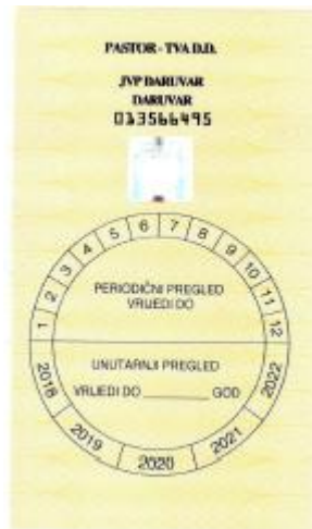
Slika 18. Naljepnica periodični pregled. [1]

Upisivanjem svih podataka u evidenciju servisa vatrogasnih aparata završen je servis vatrogasnog aparata.