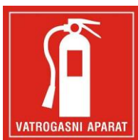
Slika 12. Naljepnica za označavanje mjesta vatrogasnih aparata [8]

Pravilnikom je definirano postavljanje vatrogasnih aparata te način označavanja vatrogasnih aparata sa naljepnicom koja mora biti sukladna normi HRN EN 3 – 7 i u boji RAL 3000.