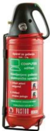
Slika 8. Vatrogasni aparat sa zamjenskim sredstvom za halon. [6]

Vatrogasni aparati sa halonom više se ne proizvode i ne mogu se stavljati u prodaju jer je istraživanjima utvrđeno da haloni oštećuju ozonski omotač. Upotrebljavali su se halon 1301 u stabilnim sustavima za gašenje požara i halon 1211 u vatrogasnim aparatima. Danas se još koriste u nekim industrijama poput vojne, avionske i svemirska gdje zamjenska sredstva ne mogu djelovati efikasno kao haloni, a da se ne ugroze ljudski životi. [4]