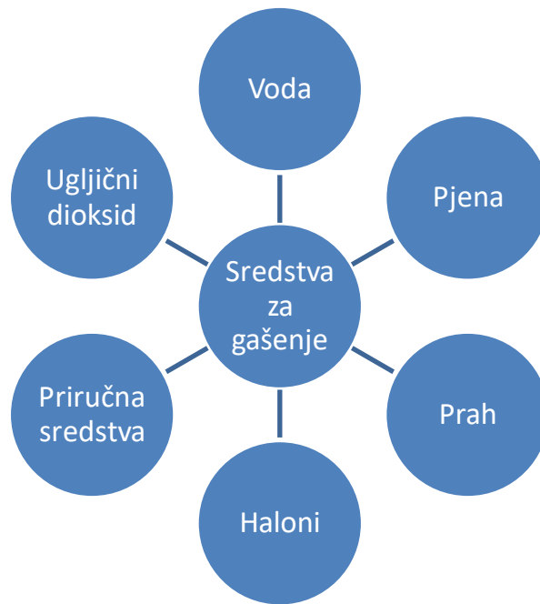
Slika 4. Pregled i podjela sredstava za gašenje. [1]