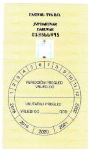
Slika 15. Naljepnica periodični pregled. [1]

Upisivanjem svih podataka u evidenciju servisa vatrogasnih aparata završen je servis vatrogasnog aparata.