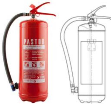
Slika 6. Vatrogasni aparat pod stalnim tlakom. [5]