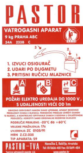
Slika 14. Naljepnica sa uputama za rukovanje vatrogasnim aparatom S9. [1]

Pregledom je ustanovljeno da je oštećena naljepnica s uputama za rukovanje vatrogasnim aparatom te se postavlja nova naljepnica.