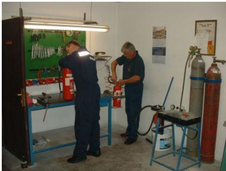
Slika 19. Servis vatrogasnih aparata JVP Grada Daruvara. [1]

Upisivanjem svih podataka u evidenciju servisa vatrogasnih aparata završen je servis vatrogasnog aparata.