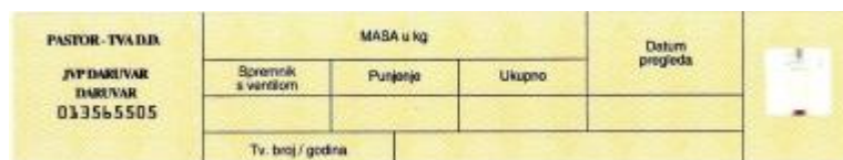
Slika 17. Naljepnica masa aparata. [1]

Vatrogasni aparat je potrebno izvagati da bi mu se ustanovila ukupna masa koja se kontrolira naljepnicom od prethodnog servisa na usponskoj cijevi. Pošto se ustanovilo da se masa poklapa s prethodnim servisom, na novu naljepnicu mase aparata upisuje se masu spremnika s ventilom, masa praha, ukupna masa, datum periodičnog pregleda i serijski broj aparata sa godinom proizvodnje te se lijepi na usponsku cijev.