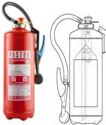
Slika 10. Vatrogasni aparat sa vodom. [5]

Konstrukcija ovog vatrogasnoga aparata slična je kao vatrogasnog aparata s bočicom koji koristi prah kao sredstvo za gašenje te je i aktiviranje identično. Razlika je samo u mlaznici gdje kod vatrogasnih aparata sa vodom imamo mlaznicu za raspršenu vodu, tzv. tuš mlaznicu te je unutrašnjost spremnika zaštićena od korozije. Nikako nisu pogodni za gašenje uređaja pod naponom te trebaju imati upozorenje na uputstvu ili dodatnu naljepnicu da se ne smiju gasiti uređaji pod naponom. Ovi vatrogasni aparati pogodni su za gašenje požara razreda A i B. Vodi se mogu dodati dodatci kojima se poveća efekt gašenja. [4]