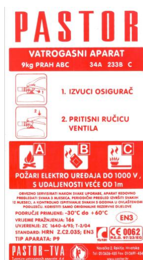
Slika 16. Naljepnica sa uputama za rukovanje vatrogasnim aparatom P9. [1]

Pregledom njegovog vanjskoga stanja uočeno je da je naljepnica s uputama za upotrebu oštećena te ju je potrebno zamijeniti, nedostaje magnet na mlaznici i nedostaje plomba na osiguraču. Ugrađuje se novi magnet i lijepi nova naljepnica s uputama za vatrogasni aparat P9.