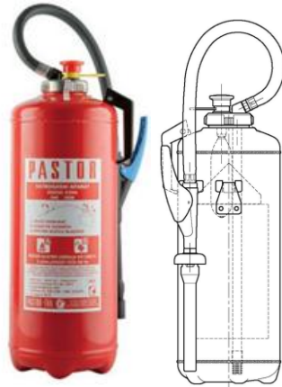
Slika 9. Vatrogasni aparat sa pjenom. [5]