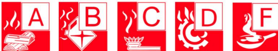
Slika. 3 Prikaz razreda požara po Europskoj normi. [3]

tako razlikujemo razrede požara A, B, C, D i F (Slika 3). Ovisno o vrsti gorive tvari potrebno je upotrijebiti sredstvo za gašenje požara koje gasi tu vrstu odnosno razred požara. [2]