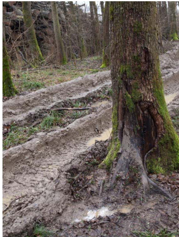
Slika 12: Staro oštećenje žilišta

Pod ovim se oštećenjima podrazumijevaju oštećenja nastala djelovanjem vatre (pougljena površina), tragovi od ozljeda (ožiljci), suhi dijelovi debla i strana tijela u deblu (posljedica ratnih djelovanja- meci, geleri i drugi metali). Mehaničke su ozljede različite zarasle i nezarasle povrede stabala koje mogu nastati u doba rasta stabala, kao i kod sječe, izrade i privlačenja. Greške drva od mehaničkih povreda sastoje se u promjeni boje, teksture, tvrdoće i čvrstoće oko ozljede i okolnog staničja, a često ih prate i napadi gljiva što dovodi do još većih oštećenja, a samim time i možebitnog propadanja cijelog stabla. Mehanička oštećenja nastala zbog grešaka u procesu sječe,