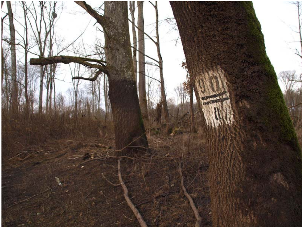
Slika 4: Izvozne vlake u promatranom odjelu

Odsjek 90a predstavlja mješovitu sastojinu poljskog jasena s hrastom lužnjakom i podstojnim grabom na gredi. Fitocenološka je to zajednica Leucoio – Fraxinetum angustifoliae Glavač 1959 (Šuma poljskog jasena s kasnim drijemovcem). Sastojina je površine 13,26 ha, nejednolike je debljinske strukture i osrednje kakvoće, a u nižim dijelovima odsjeka se nalaze grupe čistog jasena (nize). Starost odsjeka je 105 godina. Sklop u odsjeku je nepotpun, a jasen koji je dostigao ophodnju je većinom pri žilištu šupalj, vjerojatno zbog dugotrajnog zadržavanja vode u odsjeku te od oštećenja žilišta prilikom prijašnjih radova vuče. Tip tla u odsjeku je močvarno-glineno. Odsjek je redovito svake godine plavljen u jesenskom, zimskom i proljetnom periodu, te su poplave većinom u trajanju od 20 do 40 dana u jesen i zimu, i tridesetak dana tijekom proljeća. Iako se uz odsjek nalazi kanal Sepčina (čini južnu granicu odsjeka), odvodnja suvišne površinske vode nije dobro riješena prekapanjem kanala pa se u mikrodepresijama (nizama) voda nalazi tokom cijele godine. Zbog dugotrajnog zadržavanja vode u odsjeku, stabla koja su dočekala ophodnju redovito stradavaju od leda u zimskom periodu, te je prirodna obnova otežana. Obnova u