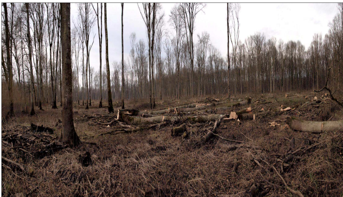
Slika 1: područje nizinskih šuma - UŠP Sisak - šumarija Sisak

Uzgajanje šuma je znanstvena i stručna disciplina koja se bavi osnivanjem, njegom i pomlađivanjem šumskih sastojina s ciljem optimalnoga i trajnoga ispunjenja gospodarskih i općekorisnih funkcija. Uzgajanje šuma izučava procese i metode kojima je u najkraćem mogućem razdoblju, uz što manje troškove i očuvanje proizvodne sposobnosti tla moguće osnovati, podići te oblikovati šumsku sastojinu koja će optimalno i trajno pružati gospodarske i općekorisne blagodati.