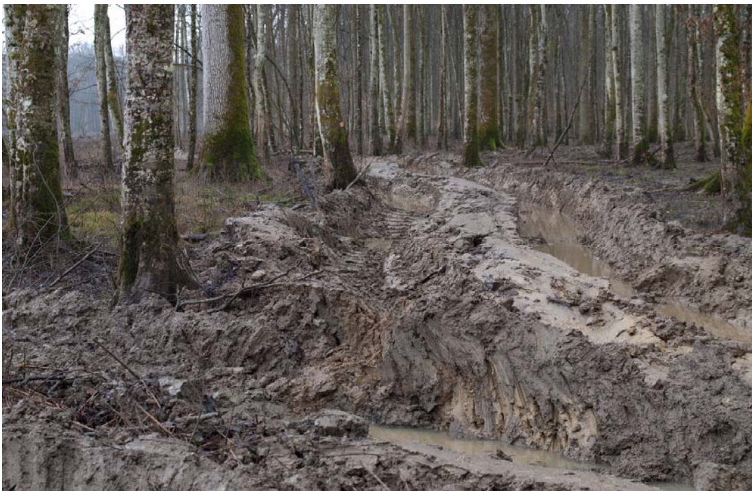
Slika 11: Duboki kolotrazi nakon višekratnog prolaza forvardera

sortimenata kod oštećenih i neoštećenih stabala istog debljinskog stupnja. Kao što je već navedeno, manje štete su evidentirane na stablima oštećenim prilikom sječe (jače oštećena, polomljena i izvaljena stabla u sastojini nisu ni vidljiva, već su prilikom sječe trebala biti doznačena kao Add. Stabla, što opet u Osnovi gospodarenja nije vidljivo u razduženju u obrascu O-2), nego što su to štete nastale guljenjem korijena i pridanka stabala lancima ili gusjenicama na kotačima forvardera. Ovisno o stupnju oštećenja pridanka, potrebno je bilo dijelove, po prirodi najvrijednijih sortimenata, primiti u niži razred kakvoće, bonificirati duljinu ili prikratiti sortiment što opet, uz ekonomski, predstavlja i vremenski gubitak te u sastojini ostaje više režijskih ostataka koji ometaju razvoj pomlatka u smislu da mu zauzimaju površinu, a i nagrđuju izgled sječine.