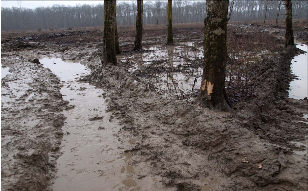
Slika 9: Prikaz kolotruga u promatranoj sastojini

dopuštenu dubinu kolotruga ( više od 10 cm ) te ulaze u kategoriju neprihvatljivo dubokih kolotruga ( više od 20 cm ). Fotografije prikazuju ekstremne situacije gdje je dubina kolotruga jednaka visini klirensa forvardera ( 680 mm ).