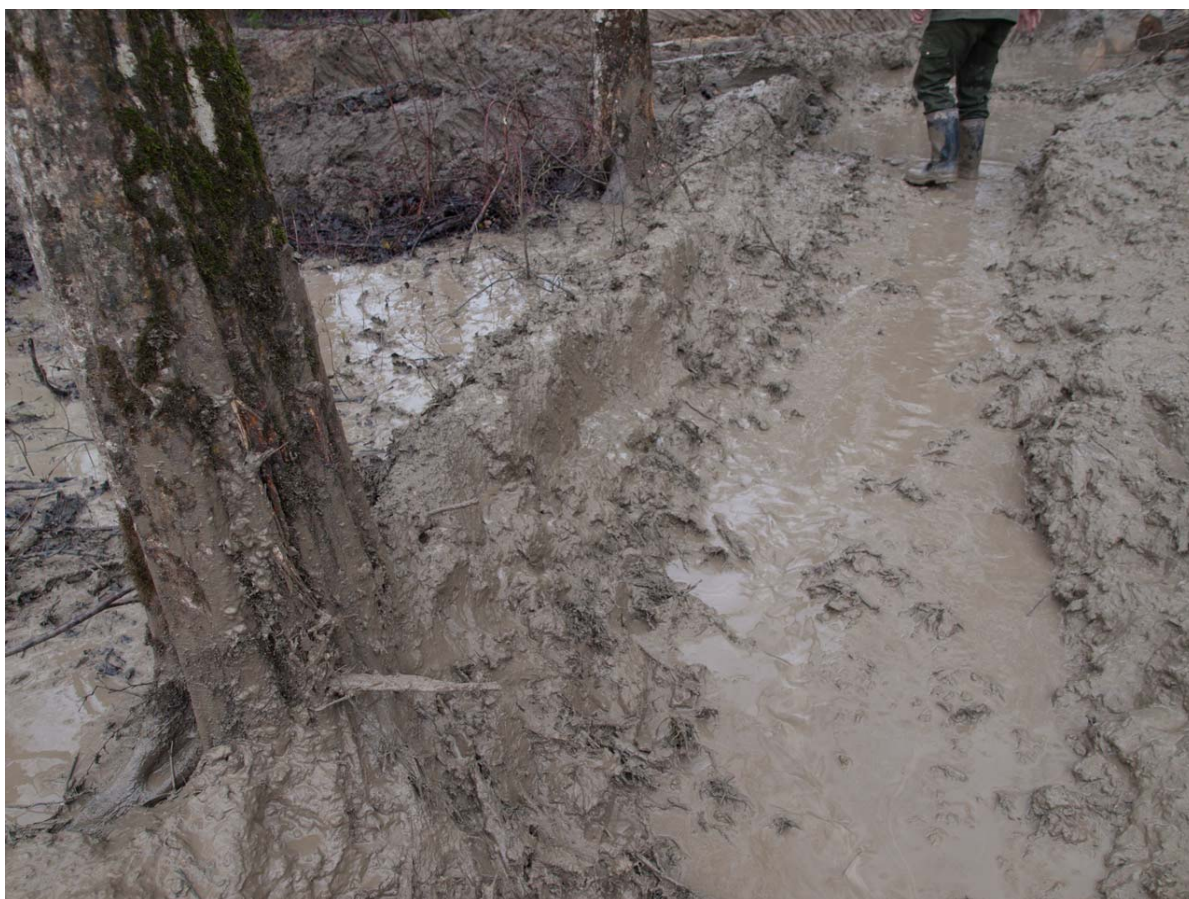
Slika 10: Oštećenje žilišta uslijed prolaza forvardera

Iz istog razloga potrebno je nakon nekoliko prijelaza istim tragom premješati se izvan utabanog kolotruga jer je u potpunosti onemogućen iznos drvnih sortimenata. To za posljedicu ima kretanje forvardera po cijeloj površini odjela, a samim time i uništavanje pomlatka. Prije nego što je započela sječa, u odjelu je za potrebe ovog rada, izvršeno terensko istraživanje u vidu morfološke procjene oštećenosti stabala prilikom sječe i privlačenja u prethodnom sijeku (naplodni sijek). Utvrđeno je da je u većoj ili manjoj mjeri, što od posljedica obaranja, što od forvardera, oštećeno 3,46 stabala/ha ili 4,30 posto od broja preostalih stabala nakon naplodnog sijeka. Oštećenja od sječe na preostalim stablima najviše se očituju u više ili manje oštećenim krošnjama te oguljenim deblima u gornjoj zoni stabla, dok su oštećenja od forvardera najveća i najočitija na najosjetljivijim (korijen) i najvrijednijim (pridanak) dijelovima stabla što za posljedicu ima stvaranje gljiva truležnica i gljiva razarača drva te u konačnici jako negativan odraz na kvalitetu i cijenu drvnih sortimenata. Paralelno sa sječom, u odsjeku se vršilo prikrajanje i preuzimanje izrađenih drvnih sortimenata te je prilikom istoga bilo moguće komparirati kakvoću i udio najvrijednijih