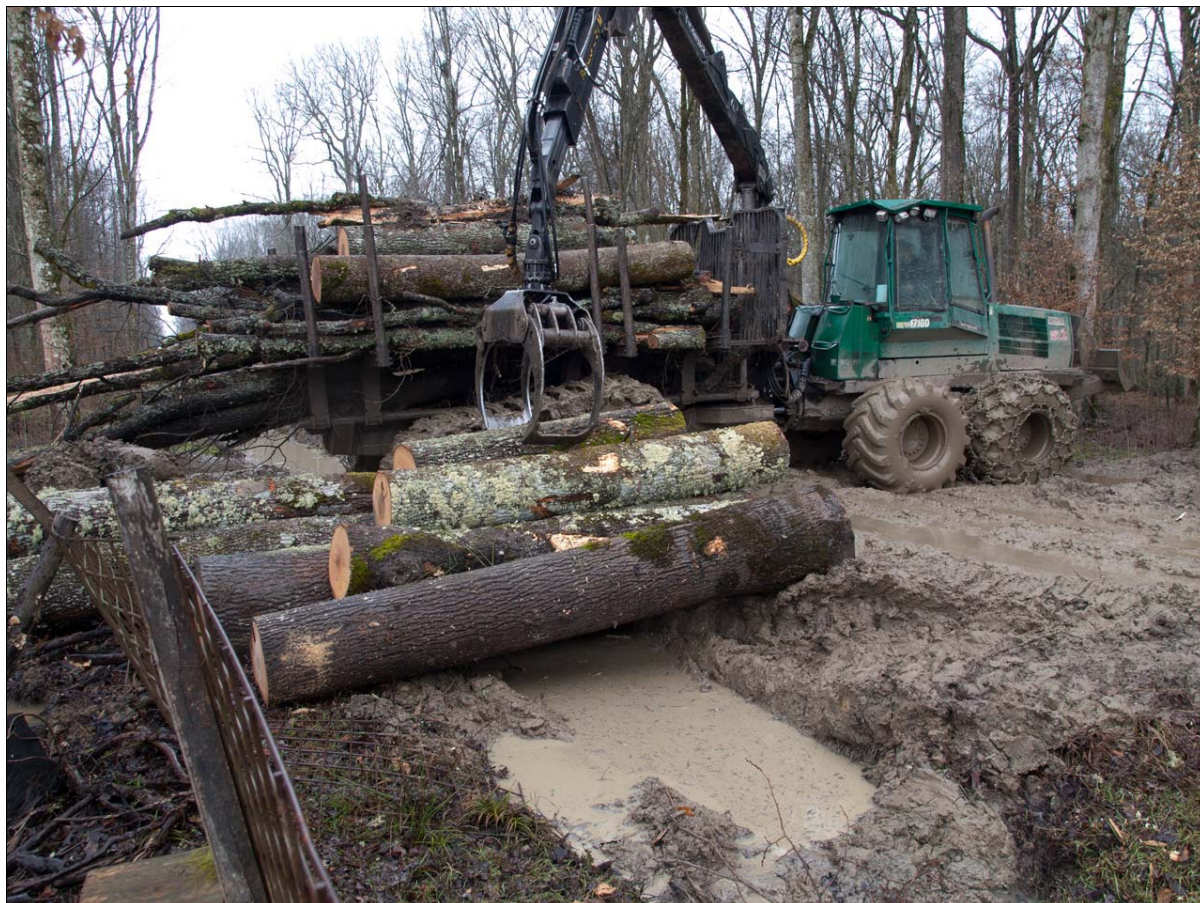
Slika 5: Prikaz rada forvardera na stovarištu

Forvarder Timberjack 1710B je šesterotračno šumsko zglobno vozilo finske proizvodnje, formule pogona 6 x 6 s bogi sustavom na stražnjoj osovini. Namijenjen je transporu drva po šumskom bespuću i izgrađenim transportnim sustavima s mogućnošću samoutovara i istovara.