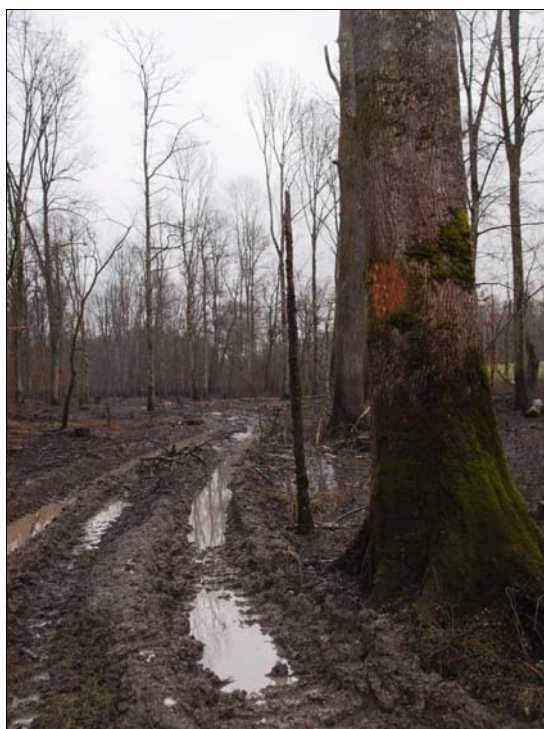
Slika 8: Oštećenja na stablima

Situacija je obrnuta na mjestima višekratnog, a ponekad i jednokratnog prolaska forvardera pri kretanju po tlu nepovoljne nosivosti. Širina gaženja tla raščlanjena je na širinu gaženja tla voznim sustavom forvardera (gume kotača) i širinu gaženja tla vozilom (širina koja obuhvaća i prostor između voznog sustava forvardera). Širina gaženja tla voznim sustavom forvardera ovisna je o dimenzijama prednjih guma forvardera (700/70-34). Širina gaženja tla vozilom dodatno je raščlanjena na širinu pri jednokratnom i višekratnom prolasku vozila. Širina jednokratnog prolaska vozila određena je gabaritnom širinom forvardera (3,05 m). Uslijed višekratnog kretanja forvardera „istim tragom“, širina se gaženja vozilom povećava. Za procjenu razine oštećenja staništa uslijed kretanja forvardera pri izvoženju drva može se primijeniti skandinavski model (Wästerlund 2002) koji procjenjuje razinu oštećenja tla na osnovu dva parametra: izgažene površine sječne jedinice i dubine kolotruga. Treba napomenuti da je u odsjeku 90a močvarno-glejno tlo izuzetno male nosivosti, sam odsjek je plavljen u tri godišnja doba-proljeće, jesen, zima te su radovi sječe i privlačenja mogući samo zimi ( oplodne sječe) kad se voda povuče. Također treba spomenuti da su izvozni putevi obilježeni, ali je svejedno potrebno kretanje forvardera između njih. Zbog male nosivosti tla, kolotrasi dubinom uvelike premašuju