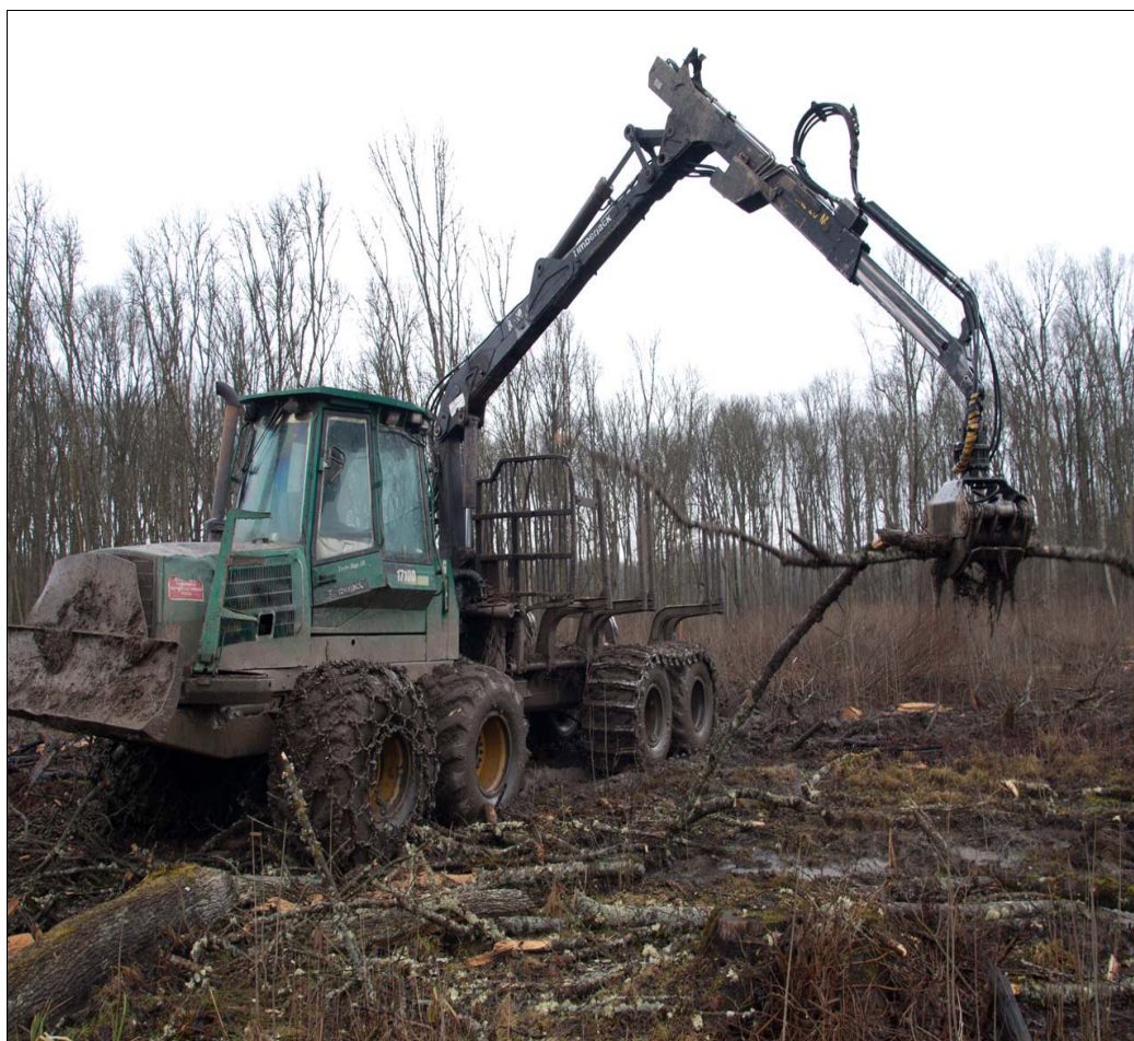
Slika 6: Sakupljanje i formiranje tovara u sječini