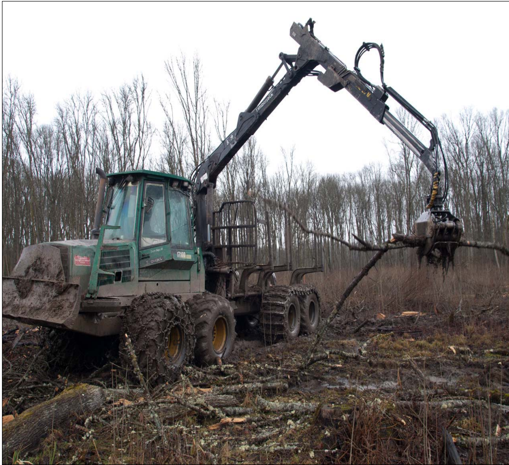
Slika 6: Sakupljanje i formiranje tovara u sječini