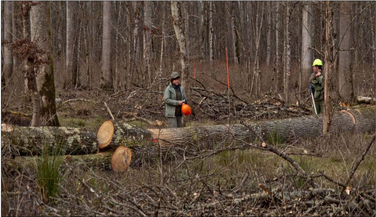
Slika 13: Primanje drvnih sortimenata

i udio najvrijednijih sortimenata kod oštećenih i neoštećenih stabala istog debljinskog stupnja. Kao što je već navedeno, manje štete su evidentirane na stablima oštećenim prilikom sječe (jače oštećena, polomljena i izvaljena stabla u sastojini nisu ni vidljiva, već su prilikom sječe trebala biti doznačena kao Add.