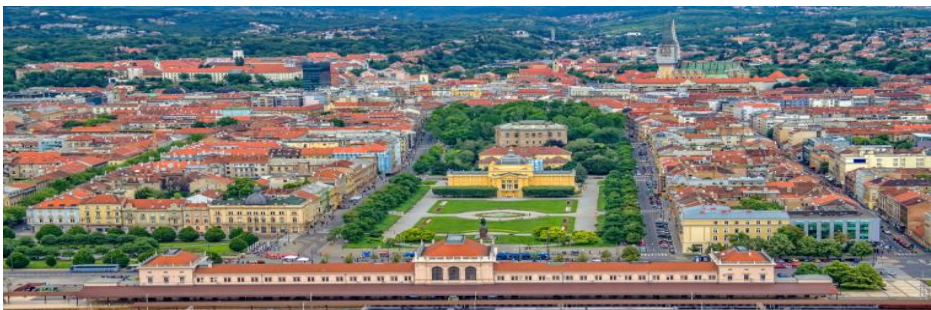
Slika 1: Grad Zagreb