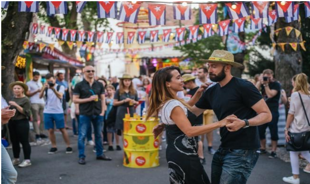
Slika 8: Ljeto na štroso