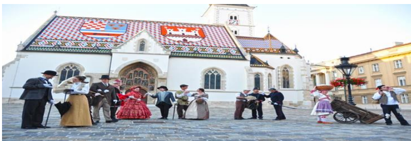
Slika 15: Zagrebački vremeplov na Markovom trgu