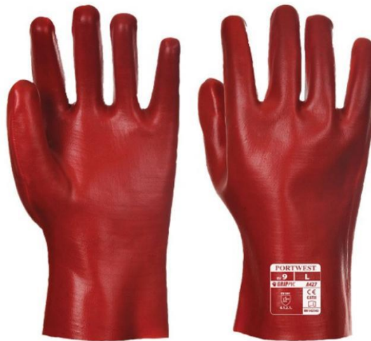
Slika 12. Zaštitne rukavice pri radu s kemikalijama

Ako poslodavac sastavlja dijelove radne opreme u funkcionalnu cjelinu ili radnu opremu prepravlja tako da joj promijeni osobine i funkcionalnost, tada postaje proizvođač radne opreme i na njega se primjenjuju propisi koji vrijede za proizvođače radne opreme.