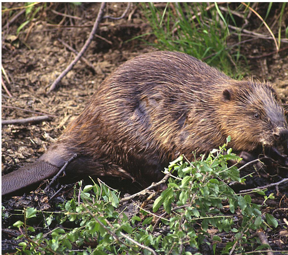
Slika 9. Europski dabar