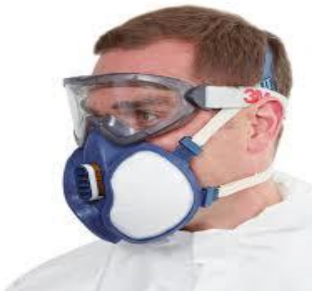
Slika 16. Zaštitna maska pri radu s kemikalijama

Radna oprema se smije upotrebljavati samo za radne zadatke i pod uvjetima za koje je namijenjena. Pri izboru radne opreme moraju se uzimati u obzir prisutne opasnosti i štetnosti na mjestu rada, odnosno druge opasnosti i štetnosti koje mogu nastati pri uporabi radne opreme.