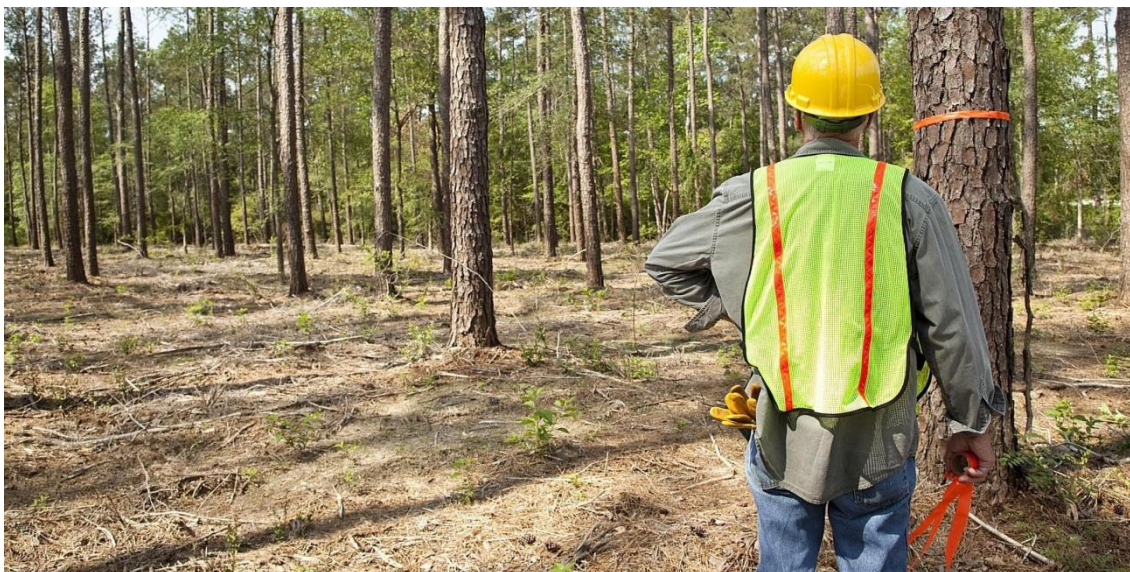
Slika 11. Radnik u šumarstvu

Pri obavljanju navedenih poslova radnici moraju biti raspoređeni tako da se međusobno ne ometaju u radu i da mogu sigurno izvoditi radne postupke. Poslovi odnosno radni zadaci ne smiju se obavljati pod nepovoljnim klimatskim ili drugim uvjetima koji bi ugrožavali sigurnost i zdravlje radnika na radu.