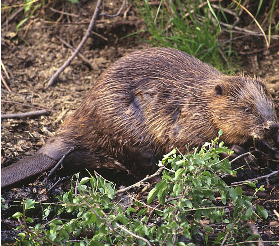
Slika 9. Europski dabar