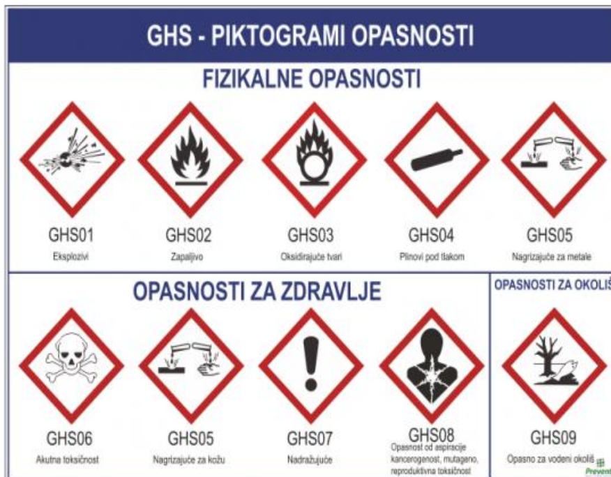
Slika 14. Znakovi (piktogrami) opasnosti

Znakovi opasnosti su piktogrami koji bojom i simbolom označuju opasnosti. Uredba CLP uvela je nov sustav razvrstavanja i označivanja opasnih kemikalija u Europskoj uniji. Piktogrami su također izmjenjeni i u skladu s usklađenim sustavom Ujedinjenih naroda (GHS).