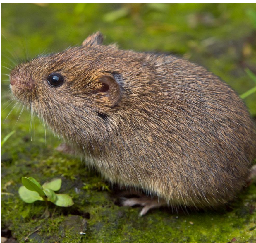
Slika 8.Livadna voluharica

Livadna voluharica ( Microtus agrestis ) preferira vlažna staništa bogata vegetacijom. Često ju se može naći i u šumama, na otvorenim površinama gusto obraslima travom. Za razliku od poljske voluharice, koja joj je izgledom jako slična, ova vrsta ima uške do pola ili u potpunosti pokrivene krznom. Aktivna je i noću i danju, a najveću aktivnost pokazuje u sumrak i zoru. Ova vrsta gradi kuglasta gnijezda od izgrizene trave. Gnijezda se nalaze na površini u travi tijekom suhih ljeta, a za vrijeme hladnih i vlažnih perioda ispod zemlje.