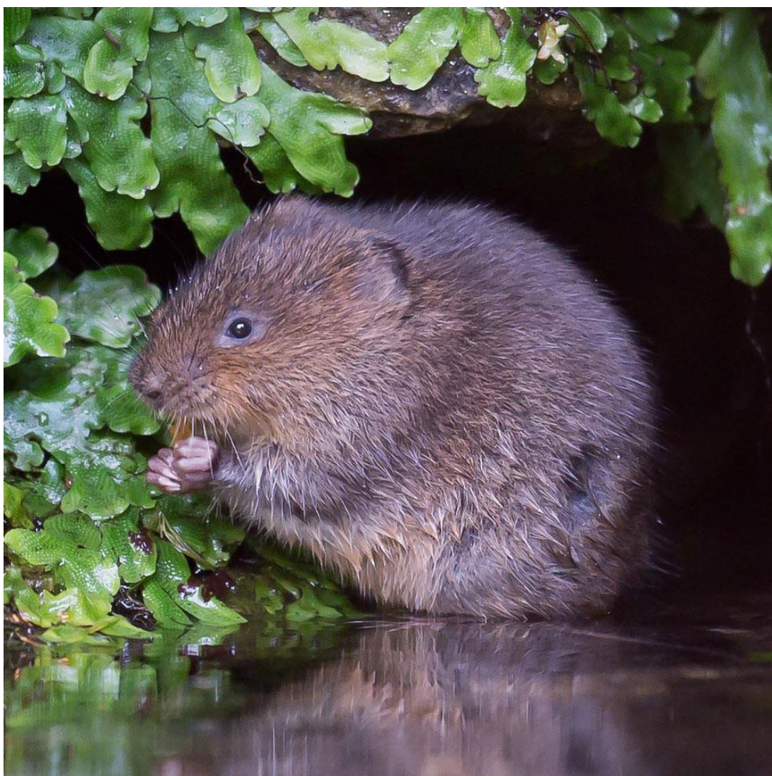
Slika 3. Vodeni voluhar

Vodeni voluhar ( Arvicola amphibius ) karakteriziraju dva različita tipa staništa. Prvi tip staništa su vlažna područja uz vodu, ali ne i močvarna područja. Na vlažnim staništima ova vrsta je aktivna na površini i često se može uočiti kako pliva, ali i roni. Drugi tip staništa su suha i vlažna staništa koja ne moraju biti u blizini vode, uključujući i šumska staništa. Na takvim staništima ova vrsta je aktivna podzemno i čini u zimskim mjesecima štete na korijenu drvenastih vrsta.