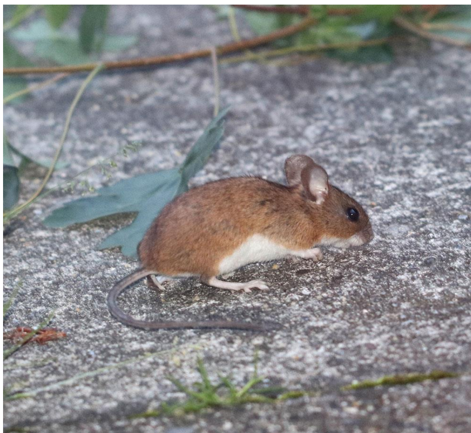
Slika 2. Žutogril šumski miš

Žutogril šumski miš ( Apodemus flavicollis ) je tipična šumska vrsta glodavca i kod nas se pojavljuje u svim tipovima šuma. Može se razlikovati od šumskog miša nešto većom građom, žutom ogrlicom ispod vrata i repom često dužim od tijela. Aktivan je noću i danju, izvrstan je penjač i često se hrani u krošnjama. Živi u napuštenim podzemnim brlozima drugih glodavaca, rupama u panjevima i deblima. U šumarstvu čini štetu na šumskom sjemenu. Kao i kod šumske voluharice s kojom dijeli stanište brojnosti populacije ove vrste ovisi o urodu šumskog sjemena.