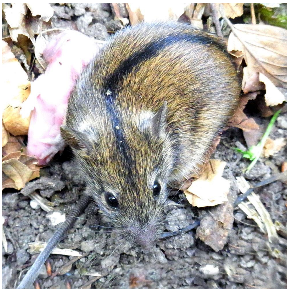
Slika 6. Poljski miš

Poljski miš ( Apodemus agrarius ) je vrsta karakterizirana jasnom crnom linijom preko cijelih leđa i nemoguće ju je zamijeniti s drugim pripadnicama roda Apodemus . Aktivna je danju i loš je penjač. Osim na navedenim staništima ovu vrstu možemo naći u kućama, podrumima i to posebice u godinama intenzivnijeg uroda šumskog sjemena. Štete čini na šumskom sjemenu.