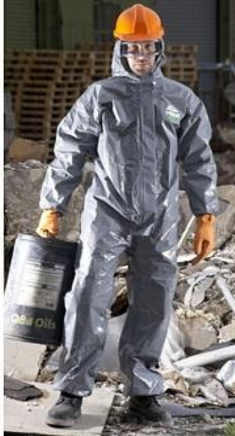
Slika 15. Zaštitno odijelo pri radu s kemikalijama

Ako sigurnost i zdravlje radnika u opasnom području radne opreme nije osigurano konstrukcijskim rješenjima, tada se moraju poduzeti odgovarajuće tehničke mjere zaštite (zaštita, zaštitni uređaj i dr.) radi sprečavanja ulaska radnika u opasno područje radne opreme za vrijeme rada.