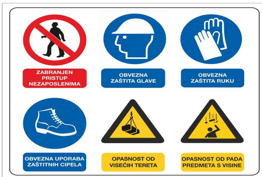
Slika 13. Znakovi (piktogrami) sigurnosti

Znakovi sigurnosti se moraju postaviti na odgovarajuća mjesta tako da budu uočljivi i otporni na atmosferlije.