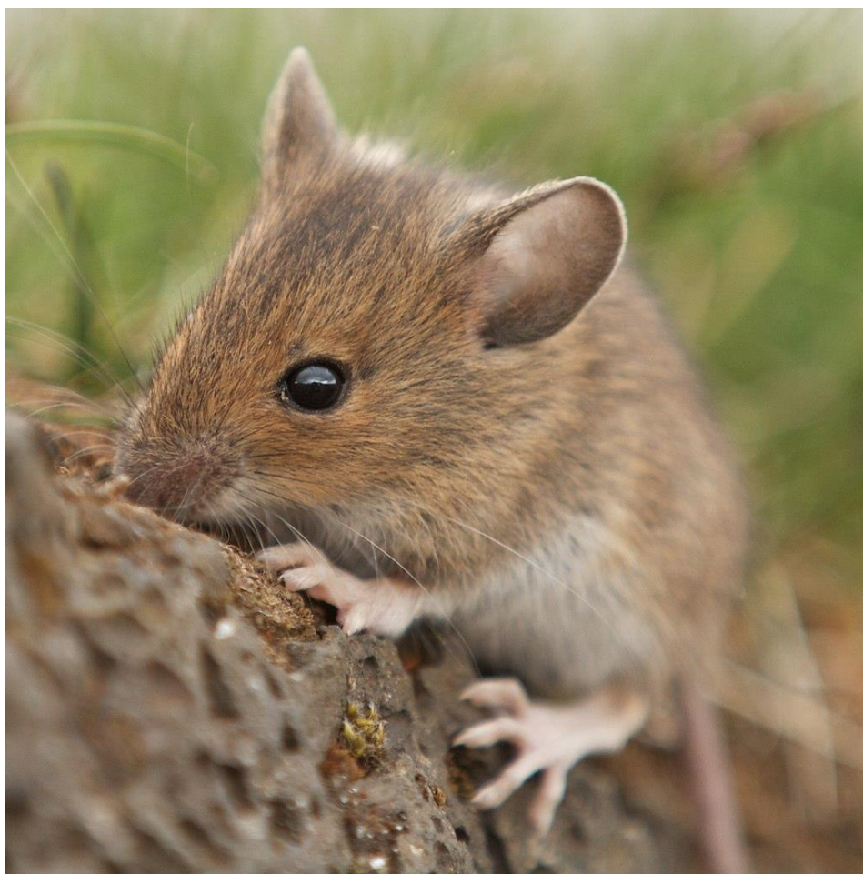
Slika 4. Šumski miš

Šumski miš ( Apodemus sylvaticus ) izgledom je slična vrsta žutogrlom šumskom mišu. Nešto je manja i rep ne prelazi dužinu tijela, dok na vratu nedostaje ili je prisutna žuta pjega. Iako samo ime šumski miš naglašava njeno stanište, za razliku od žutogrllog šumskog miša ova vrsta nastanjuje i druge tipove staništa. Aktivna je noću i izvrstan je penjač, štete čini na šumskom sjemenu.