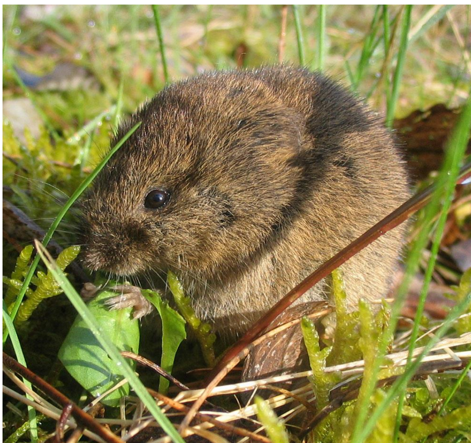
Slika 7. Poljska voluharica

Poljska voluharica ( Microtus arvalis ) specifično je prenamnožavanje u godinama kada su povoljni stanišni uvjeti koji mogu rezultirati ogromnim gubicima na poljoprivrednim površinama. Ova vrsta ne nastanjuje šumska staništa, ali ju se u malom broju može naći na šumskim površinama koje graniče sa poljoprivrednima. Štete na drvenastim vrstama uzrokuje u rasadnicama i voćnjacima. Aktivna je danju i noću te gradi podzemni brlog ( do 50cm dubine) koji ima do 6 izlaznih rupa i nekoliko prostorija.