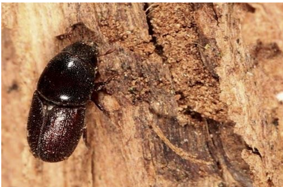
Slika 10. Potkornjak

Najveći prirodni neprijatelj potkornjaka su djetlići koji ih uništavaju i zauzimaju mjesto za nastambu, a i često se hrane njihovim ličinkama. No, čini se da su djetlići u Dalmaciji proteklih godina loše obavili svoj posao, a cvrčke koji na obali pojačavaju morski ugođaj na obali zamijenili su američki koji od mirisnih borova rade piljevinu. U obrazloženju se navodi kako je zahvaljujući globalnom zatopljenju koje pogoduje razvoju i u gradaciji potkornjaka upravo on uzrokovao sušenje oko 7000 stabala alepskog bora starih oko 70 godina, što je 13 posto od ukupno 64.000 stabala koliko ih je ukupno na Marjanu.