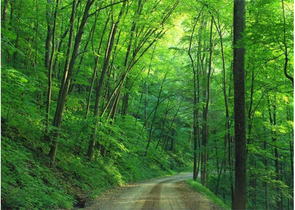
Slika 1. Primjer šumskog ekosustava – pozitivni primjer utjecaja čovjeka