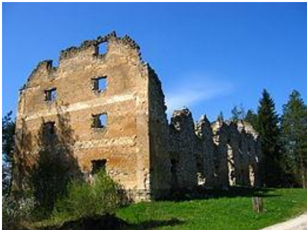
Slika 3: Napoleonov magazin