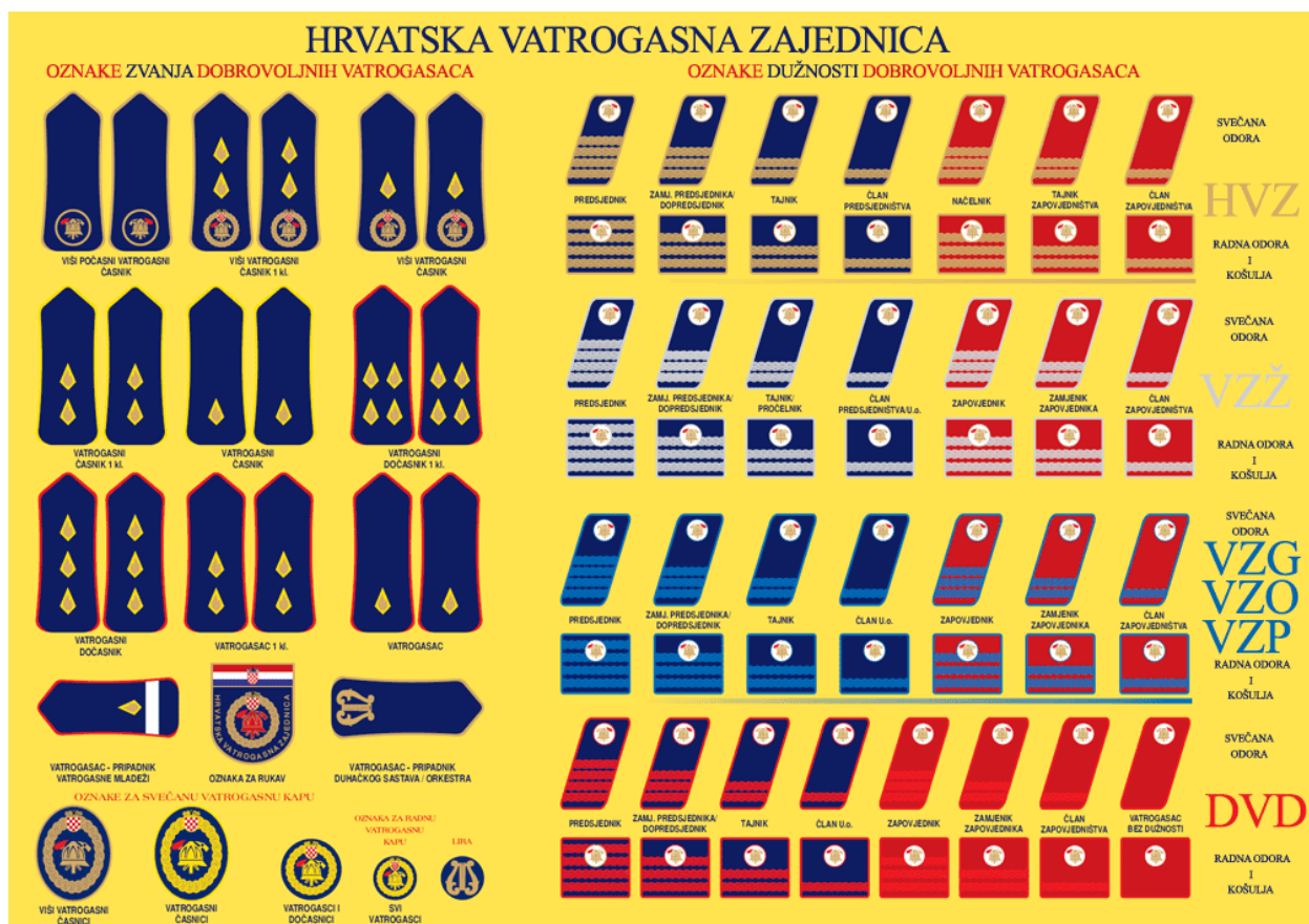
Slika 3. Vatrogasne oznake [13]

časnik i vatrogasni časnik prve klase imaju baklje opšivene ispuskom zlatne boje. Jedna baklja označava vatrogasnog časnika, dok dvije baklje označavaju vatrogasnog časnika prve klase. Viši vatrogasni časnik i viši vatrogasni časnik prve klase imaju vatrogasni znak zlatne boje i simbolizirane plamene baklje. Počasni viši vatrogasni časnik ima tri baklje s ispuskom zlatne boje. Vatrogasac pripadnik vatrogasne mladeži ima jednu traku bijele boje. Vatrogasci svoje oznake nose na vatrogasnim svečanim i radnim odorama. Izgled oznaka možemo vidjeti na Slici 3. Svečana odora nosi se prilikom vatrogasnih svečanosti kao što su obljetnice, svečani prijem i sprovodi. Svečana odora može biti muška ili ženska. Sastoji se od bluze i hlača, odnosno suknje te od svečane kape za muškarce i šeširića za žene. Radna odora jednaka je za muškarce i žene. Sastoji se od bluze, hlača i domobranke. Nosi se prilikom obavljanja svakodnevnih aktivnosti kao i kod stručnog osposobljavanja. Važno je za napomenuti da dobrovoljni vatrogasci nose i zaštitnu odoru za prilaz vatri, prolaz kroz vatru te za rad s opasnim tvarima. [1], [15]