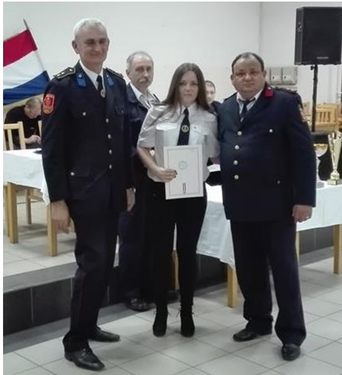
Slika 6. Dodjela priznanja članovima dobrovoljnog vatrogasnog društva Zoljan [3]

učlanjivanja, tijelima udruge, prestanku djelovanja udruge, imovini, načinu rješavanja sporova i drugo. Statut udruge može sadržavati i odredbe o teritorijalnom djelovanju udruge, znaku udruge i drugim pitanjima od značaja za udruhu. [1], [8]