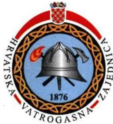
Slika 1. Oznaka Hrvatske vatrogasne zajednice [1]

vatrogasce“ izdan je 1882. godine. Obrađivao je teme kao što su: zadaci vatrogasnih društava, sredstva za gašenje i njihova upotreba, taktika gašenja požara te ustroj i oprema vatrogasnih postrojbi. Kako bi se unaprijedilo dobrovoljno vatrogastvo te zaštitili interesi dobrovoljnih vatrogasnih društava, Hrvatsko-slavonska vatrogasna zajednica je na skupštini 1899. godine utvrdila nacrt Gasnika za Kraljevinu Hrvatsku i Slavoniju. Zatražili su od Vlade da zakonom uredi vatrogastvo u Kraljevini te da izdvajaju 2% od njihovih bruto prihoda za vatrogastvo. Na kraju skupštine, dobrovoljni vatrogasci Hrvatske dobili su svoju oznaku koju nose na ovratniku, nju čine kaciga i u križ postavljeni čekić i sjekirica (Slika broj 1). To je bio početak stvaranja jedinstvenih vatrogasnih oznaka u Hrvatskoj. [1], [11]