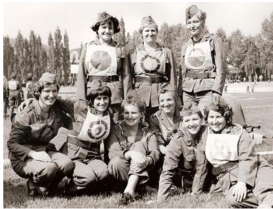
Slika 5. Dobrovoljno vatrogasno društvo na natjecanju 1970. godine [5]

Iz navedenog Pravilnika dobrovoljne vatrogasne službe i statuta konkretnog dobrovoljnog vatrogasnog društva (dobrovoljnog vatrogasnog društva Pobegi-Čežarij) možemo zaključiti kako nema velikih razlika u načinu obavljanja vatrogasne djelatnosti. [5]