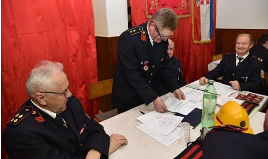
Slika 7. Godišnja skupština dobrovoljnog vatrogasnog društva u gospodarstvu [4]