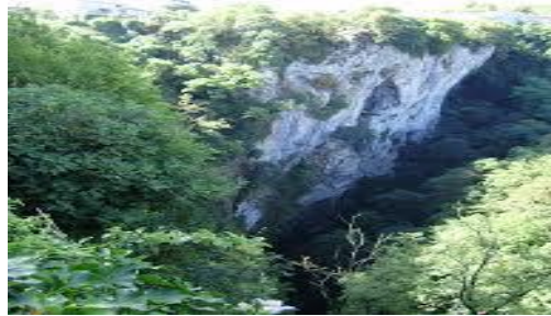
Slika 3. Pazinska jama