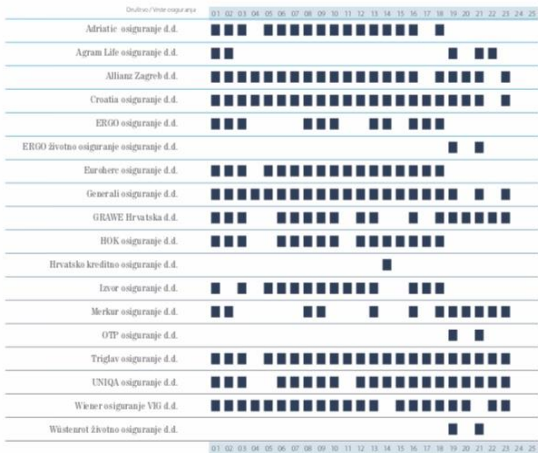
Tablica 3. Pregled po vrstama osiguranja u kojima su društva u 2018. godini uprihodovala premiju