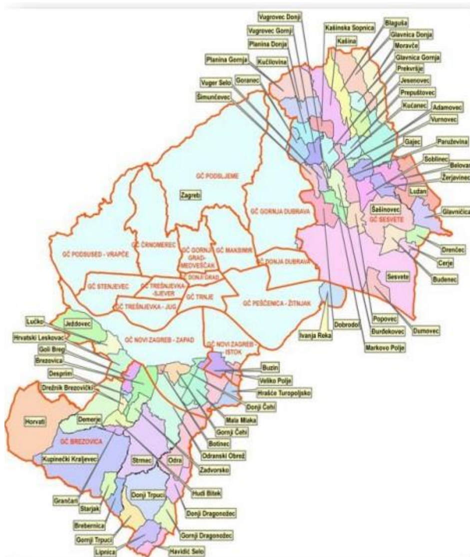
Slika 3. Gradske četvrti i mjesni odbori Grada Zagreba [6]

Osim stambenih zgrada i gospodarskih objekata u Zagrebu su smještene brojne institucije državne uprave kao što Hrvatski sabor, Ured predsjednice Republike Hrvatske, Vlada RH (Banski dvori), Ustavni sud, Vrhovni sud Republike Hrvatske, brojni ostali sudovi (županijski, općinski građanski, kazneni, visoki upravni, radni, visoki trgovački, prekršajni i slično), Državno odvjetništvo Republike Hrvatske, gotovo sva Ministarstva (28 zgrada), državni zavodi, državni i gradski uredi i slično.