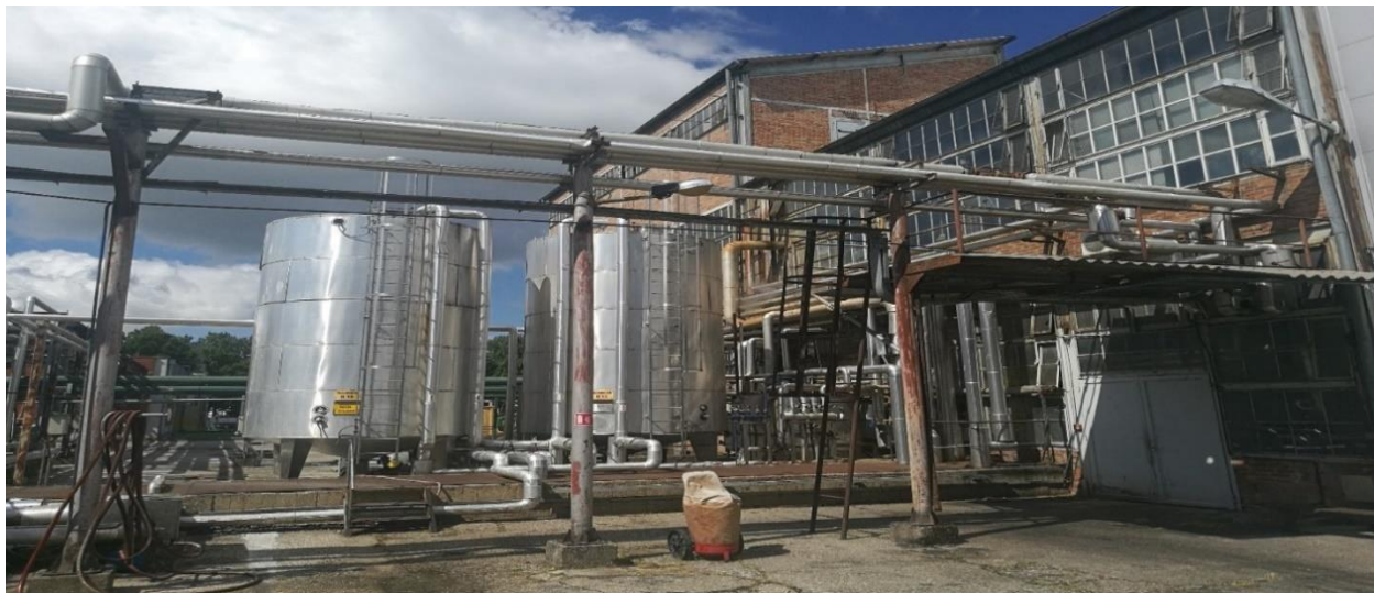
Slika 3. Pogon hidrirnice [20]

Odlukom direktora društva od 28. lipnja 2010. godine u pogonu hidrirnice je trajno obustavljen proces hidrogenacije ulja zbog značajno smanjenih potreba za hidrogeniranim biljnim mastima i dotrajalosti opreme za hidrogenaciju. Sukladno toj odluci dana 26.01. i 27.01.2011. godine obavljeno je uklanjanje kompresorskog postrojenja za vodik čime je onemogućen daljnji rad na opremi za hidrogenaciju. Sukladno odluci od 15.11.2016. obustavljen je rad i dijela pogona za deodorizaciju, a to obuhvaća i plinsku kotlovnicu pogona hidrirnice. S obzirom na gore navedeno u objektu pogona hidrirnice u upotrebi je ostala samo oprema za prijem sirovina iz auto cisterni (sa pripadajućim cjevovodima, ventilima i rezervoarima za prijem sirovina). Uz pomoć iste opreme moguće je putem cjevovoda sirovine isporučiti u pogon margarina. Pogon je zadržao naziv iz doba kada se obavljala hidrogenacija suncokretovog ulja koje u takvom stanju predstavlja sirovinu u daljnjoj proizvodnji margarina. Objekt više nije u funkciji, već zajedno sa spremnicima uz objekt služi za prihvat određenih vrsta ulja te ne predstavlja nikakav rizik za sigurnost radnika. [12]