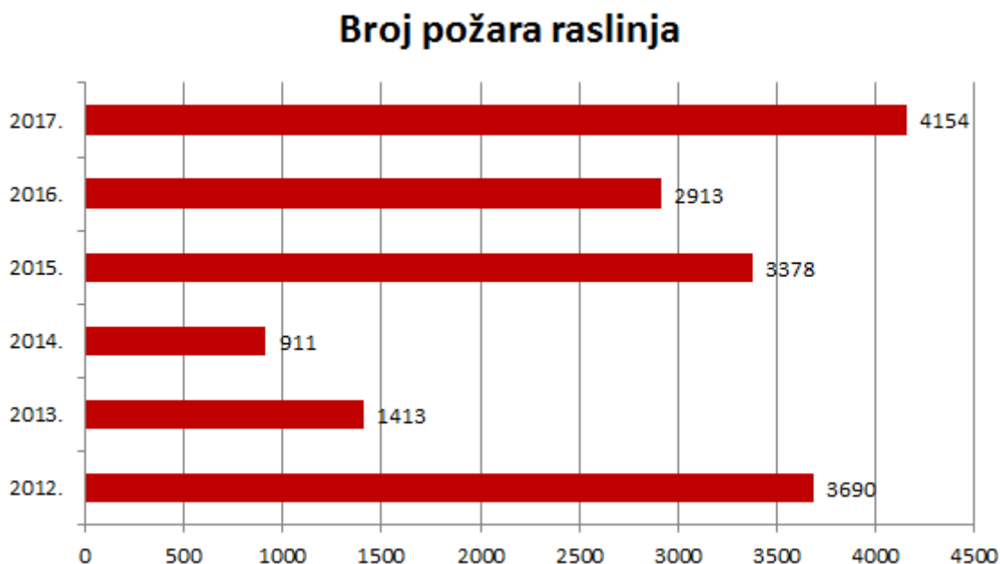
Grafikon 1. Broj požara raslinja po godinama (2012.-2017.)

Kako bi se što jednostavnije mogli uspoređivati odnosi broja požara, opožarene površine i indeksa opožarene površine (IOP) po godinama, dan je prikaz u sljedećim grafikonima. Podaci su prikazani od 2012. do 2017.