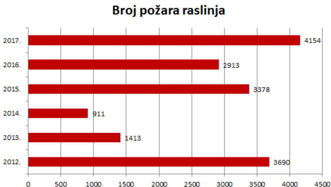
Grafikon 1. Broj požara raslinja po godinama (2012.-2017.)

Kako bi se što jednostavnije mogli uspoređivati odnosi broja požara, opožarene površine i indeksa opožarene površine (IOP) po godinama, dan je prikaz u sljedećim grafikonima. Podaci su prikazani od 2012. do 2017.