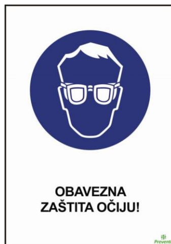
Slika 14. Znak za obveznu zaštitu očiju [10].

Postoje različiti štitnici za lice, kao što su obične naočale, zaštitne naočale, naočale za zaštitu od ultraljubičastog, infracrvenog te rendgenskog zračenja, viziri za zaštitu lica, maske za zavarivanje, sredstva s mrežicom za zaštitu očiju i lica od mehaničkih opasnosti i drugi. Sredstva za zaštitu očiju i lica, poput zaštitnih naočala ili štitnika za varioce, služe za zaštitu od ulijetanja čestica i strugotina u oči te za zaštitu očiju od štetnog zračenja kod varenja, Slika 14 [10].