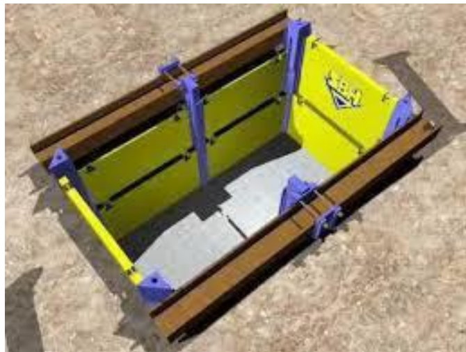
Slika 7. Zaštita bočnih strana prilikom iskopa [3].

U iskopima, kanalima, jamama i pri drugim vrstama iskopa pojavljuju se opasnosti od nenadanog urušavanja, zarušavanja, pucanja ili klizanja masa i iskopanog materijala te prodora podzemnih voda i prodora vode. Kako bi se isto spriječilo iskopi se trebaju obavljati određenom tehnikom i uz osiguranje bočnih strana zemljanih mjesta, te je također potrebno osigurati crpke za izbacivanje vode na mjestima gdje se može očekivati prodor vode. Osiguranje bočnih strana iskopa treba postaviti već kod dubine 1m, Slika 7 [3].