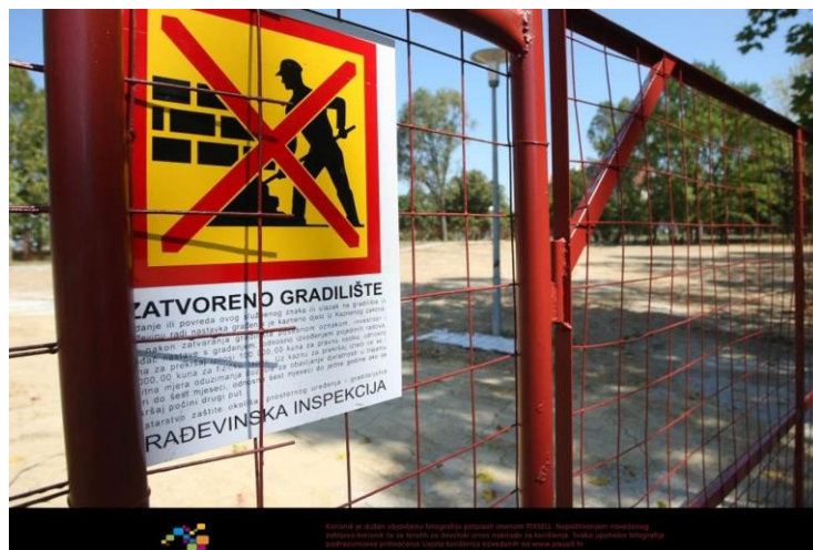
Slika 11. Oznaka zatvorenog gradilišta