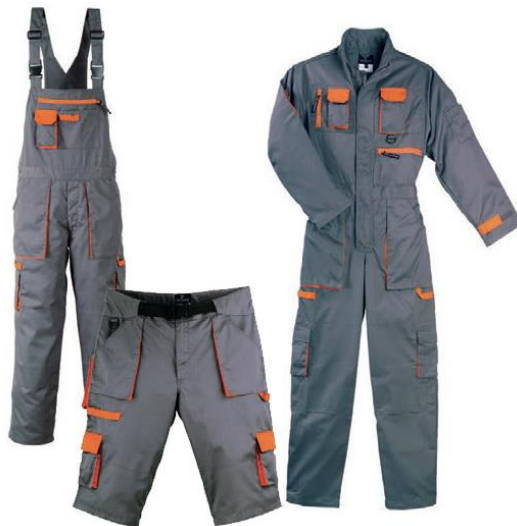
Slika 21. Zaštitno radno odijelo [22]

Sredstva za zaštitu tijela u koja spadaju zaštitne kute, kombinezoni i slično služe kao zaštita od prašine i prljanja. Također se koriste i sredstva za zaštitu od nepovoljnih atmosferskih utjecaja koja štite radnike od hladnoće, vjetrova, kiše i snijeg, Slika 21 [10].