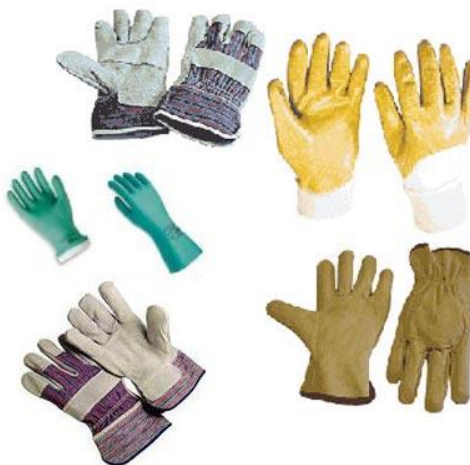
Slika 16. Zaštitne rukavice, ovisno o vrsti posla koje se obavljaju [10]

Dakle, sredstva za zaštitu ruku štite ruke od hladnoće i topline, električne energije, štetnog djelovanja kiselina, mehaničkih opasnosti i sl. Izrađuju se od gume ili kože, Slika 16 [10].