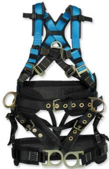
Slika 20. Zaštitni opasač [10]

Kod zaštite cijelog tijela radnik je dužan koristiti opremu namijenjenu za sprečavanje pada s visine i u dubinu, opremu za kočenje koja apsorbira kinetičku energiju kao i naprave za pridržavanje tijela, odnosno sigurnosne pojase, Slika 20 [4].