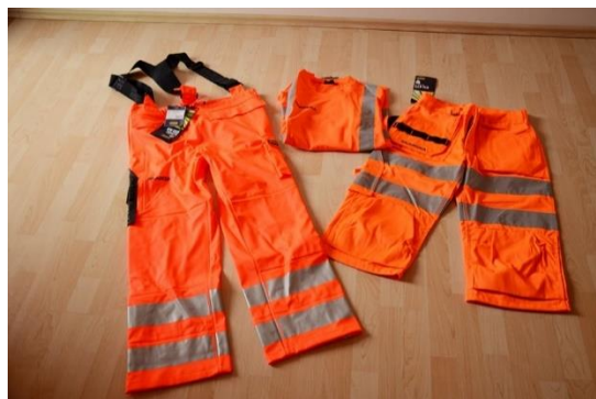
Slika 22. Zaštitna reflektirajuća odjeća [22]

Zaštitna odjeća se koristi kod radova na otvorenom na kiši i po hladnom vremenu te kod radova s vodom pri čišćenju i pranju. Radnici na gradilištima moraju nositi reflektirajuće prsluke kako bi bili jedno vidljivi, Slika 22.