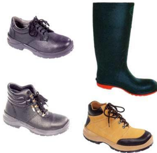
Slika 18. Različite zaštitne cipele, obzirom na vrstu posla koja se obavlja [10]

Dakle, sredstva za zaštitu nogu štite noge od padajućih predmeta (tu spadaju cipele sa čeličnom kapom), štite noge od toplinskog djelovanja, kao i od hladnoće, Slika 18 i 19.