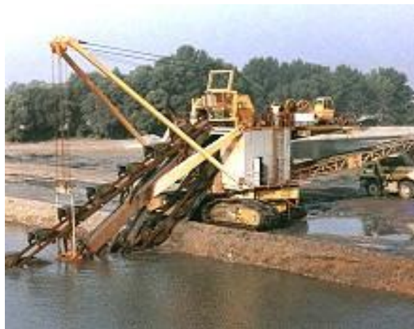
Slika 3. Bager vjedričar [4]

d) Bageri vjedričari - imaju lanac s otvorenim vjedrima za kopanje na nosaču pričvršćenom na konstrukciju bagera, koji se kreće na gusjenicama ili tračnicama, kopa cijelom dužinom nosača lanca dok se nosač ne spusti do nagiba 45 stupnjeva i istovremeno se giba niz padinu po etaži. Kao stroj velikog učinka služi za kopanje zemljišta koje nije suviše teško i u kojem nema krupnijih samaca, Slika 3 [1].