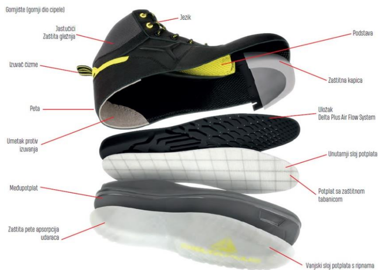
Slika 19. Dijelovi zaštitne cipele s kapicom [10]