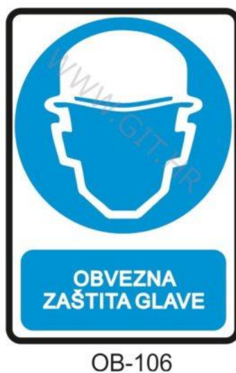
Slika 12. Obvezna zaštita glave [10].

Sredstva za zaštitu glave, na primjer zaštitni šljem mora štiti glavu od padajućih predmeta. Zaštitni šljem mora imati ugrađenu kolijevku koja ima mogućnost podešavanja po veličini s razmakom od šljema koji je između 2 i 4 centimetra, Slika 12. [10]