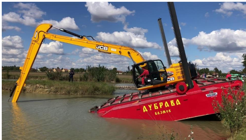
Slika 1. Bager [4].

a) Strojeve za kopanje i utovar - nazivaju se zajedničkim imenom „bager“, a to su strojevi koji objedinjuju ova dva posla. Razlikuju se bageri za rad na suhom i u vodi prema stajalištu stroja pri radu. Mogu se podijeliti i prema položaju mase koju kopaju pa se dijele na visinske, dubinske ili bagere ravnjače. Razlikujemo i bagere s grabilicom, žlicom, vjedrima, crpkom i drugo. Također, prema tijeku rada bageri se dijele na bagere za neprekidan rad i rad s prekidom, Slika 1.