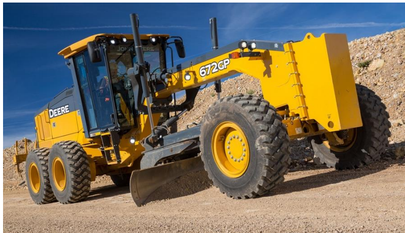
Slika 5. Ravnjačar