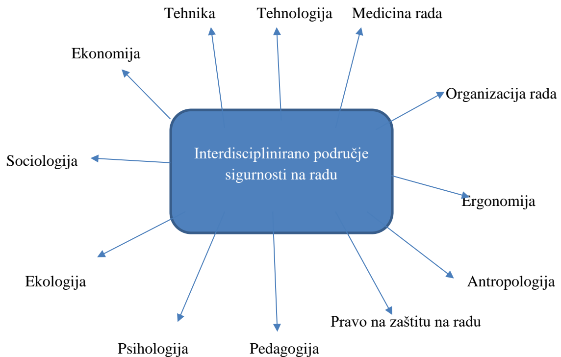
Slika 6. Shematski prikaz interdiscipliniranog područja sigurnosti na radu [8].

Počeci spoznaje zaštite na radu polaze od praktičnih postavki koje upućuju na zaključak da se zaštita na radu efikasno može ostvariti samo interdiscipliniranim pristupom svih relevantnih disciplina, a što je vidljivo iz sheme 6.