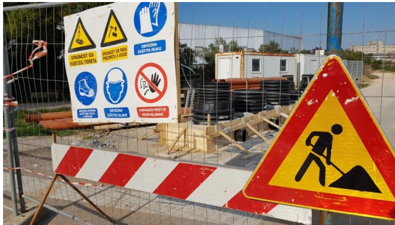
Slika 10. Oznake na ulazu u gradilište

Člankom 3. Pravilnika o zaštiti na radu u građevnju (SL br. 42/68) propisano je da gradilište mora biti uređeno tako da omogući nesmetano i sigurno izvođenje svih radova. Gradilište mora biti osigurano od pristupa osoba koje nisu zaposlene na gradilištu. Izvođač radova dužan je sastaviti poseban elaborat o uređenju gradilišta i radu na gradilištu, koji u pogledu zaštite na radu obuhvaća ove mjere: