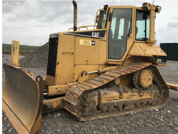
Slika 4. Buldožer [16].