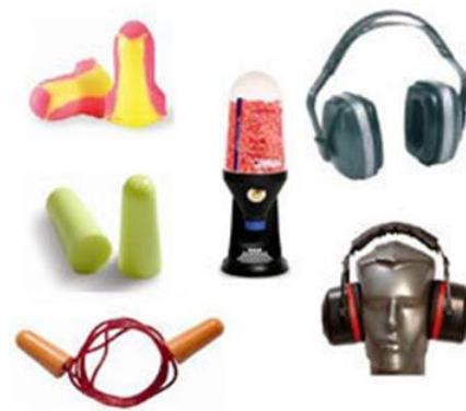
Slika 15. Sredstva za zaštitu sluha [10]

Kao sredstva za zaštitu od sluha u građevini možemo koristiti ušne čepiće, ušne školjke pričvršćene na kacigu, kacigu s potpunom akustičkom zaštitom, štitnike s prijammnikom za nisko frekvencijsku indukciju, zaštitno sredstvo za uši s opremom za međusobnu komunikaciju. U građevini se radi vrste posla najčešće koriste ušni čepići i ušne školjke pričvršćene na zaštitnu industrijsku kacigu. Sredstva za zaštitu sluha u koja spadaju vate, čepići i zaštitne slušalice koriste osobe koje su za vrijeme rada izložene povećanoj buci koja se drugim mjerama ne može spriječiti, Slika 15 [10].