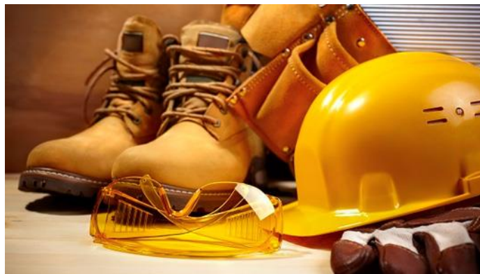
Slika 9. Zaštitna oprema na gradilištima

Prije početka radova u građevinarstvu kod kojih prijete stalna ili povremena opasnost od ozljeđivanja tijela ili oštećivanja zdravlja radnika, radna organizacija mora staviti ugroženim radnicima na raspolaganje odgovarajuća osobna zaštitna sredstva i osobnu zaštitnu opremu, zavisno od vrste opasnosti odnosno štetnosti. Potrebno je naglasiti da se zaštitna oprema razlikuje obzirom na vrstu radnog mjesta gdje se obavlja, pa tako za radove u vodi ili na vlazi radnici moraju imati nepropustljivu obuću, a po potrebi i odjeću koja ne propušta vodu, dok za radove na otvorenom prostoru i pod utjecajem atmosferskih neprilika, radnicima se moraju staviti na raspolaganje osobna zaštitna sredstva odnosno oprema za zaštitu od štetnih posljedica (jakne, rukavice, kabanice), Slika 9.