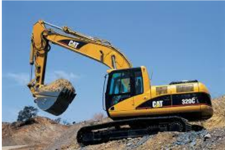
Slika 2. Bager Lopatar [4]

d) Bageri vjedričari - imaju lanac s otvorenim vjedrima za kopanje na nosaču pričvršćenom na konstrukciju bagera, koji se kreće na gusjenicama ili tračnicama, kopa cijelom dužinom nosača lanca dok se nosač ne spusti do nagiba 45 stupnjeva i istovremeno se giba niz padinu po etaži. Kao stroj velikog učinka služi za kopanje zemljišta koje nije suviše teško i u kojem nema krupnijih samaca, Slika 3 [1].