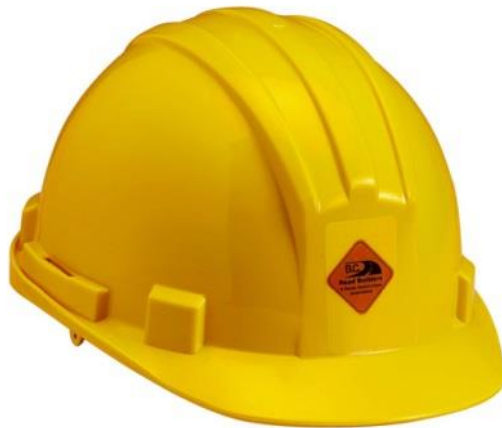
Slika 13. Zaštitna kaciga [10].

Svaka kaciga treba prilikom testiranja prema HRN EN 4 treba zadovoljiti osnovne i dodatne zahtjeve. Osnovni zahtjevi se odnose na apsorpciju udaraca, otpornost na probijanje, otpornost na zapaljivost, pričvršćivanje podbradnog remena, a građevinski radnik ju je obvezan nositi na gradilištu [5].