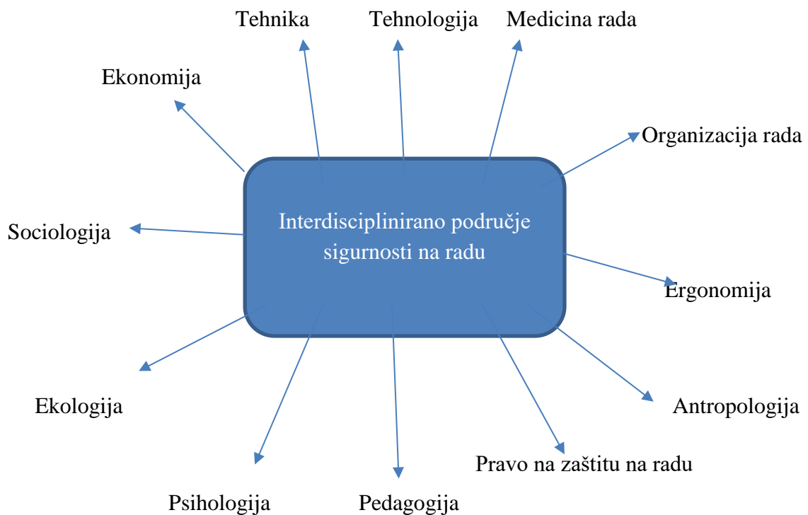
Slika 6. Shematski prikaz interdiscipliniranog područja sigurnosti na radu [8].

Počeci spoznaje zaštite na radu polaze od praktičnih postavki koje upućuju na zaključak da se zaštita na radu efikasno može ostvariti samo interdiscipliniranim pristupom svih relevantnih disciplina, a što je vidljivo iz sheme 6.