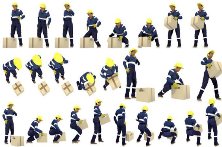
Slika 8. Ispravan način dizanja i prijenosa tereta [17].