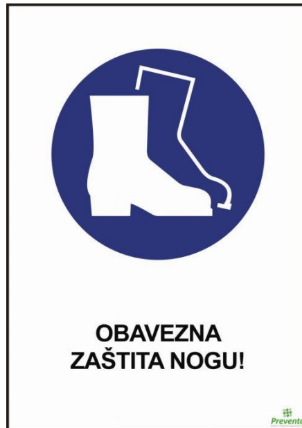
Slika 17. Obavezno nošenje zaštitne obuće [10]

Radnici su dužni koristiti zaštitne cipele na gradilištima. To je obuća koja se koristi za zaštitu od mehaničkih, električkih, termičkih i drugih opasnosti, Slika 17.