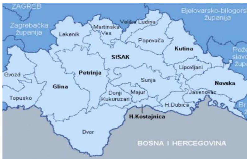
Slika 1. Prikaz smještaja grada Gline na karti