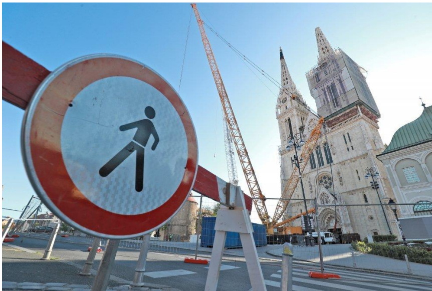
Slika 10. Osiguranje oštećene Zagrebačke katedrale nakon potresa u Zagrebu 2020. godine [10]

vrsti rušenja [12]. Na Slici 10 je prikazana zaštitna ograda i osiguranje prostora uslijed uklanjanja kupole na Zagrebačkoj katedrali.