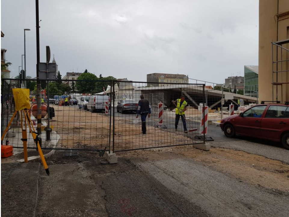
Slika 3.: Primjer gradilišta ograđenog sa zaštitnom ogradom (Poljana, Šibenik) [3]

Gradilište mora biti pravilno osigurano i ograđeno radi sigurnosti prolaznika ako je to moguće, ako nije onda pravilno označeno (Slika 3.).