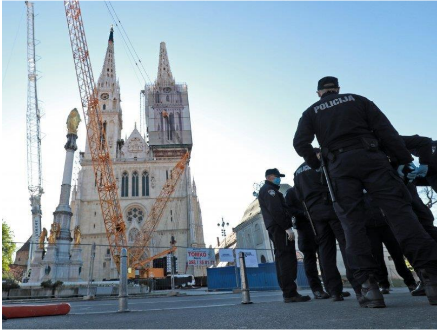
Slika 4.: Osiguranje oštećenog objekta katedrale nakon potresa u Zagrebu 2020. godine [4]

Demontirane grede nosači i drugi teški dijelovi konstrukcije sa objekta se smiju uklanjati isključivo pomoću odgovarajućih uređaja ili naprava. Uklanjanje rastresitog i prašinstog materijala sa ruševine na tlo obavlja se pomoću potpuno pokrivenih drvenih korita, kroz metalne limene cijevi ili na kakav drugi način koji sprječava širenje prašine. Ako se rušenje objekta obavlja pomoću strojeva, isti se mora nalaziti na udaljenosti koja je najmanje za 1,5 puta veća od visine objekta [11].