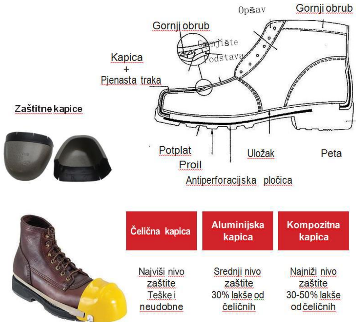
Slika 18: Radna obuća [18]