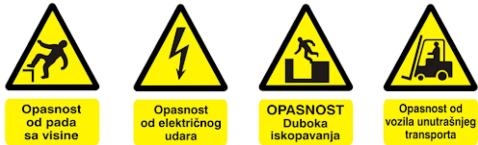
Slika 6.: Ploča rizika na gradilištu i preventivne mjere [6]

Postoje znakovi koji upozoravaju na razne opasnosti.