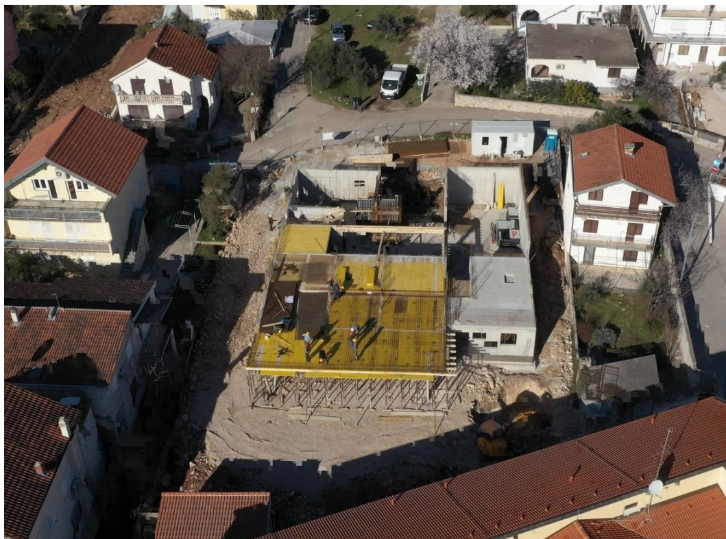
Slika 2. Primjer uređenog gradilišta sa pristupnim putevima (DV „Mendula“, Pirovac) [2]