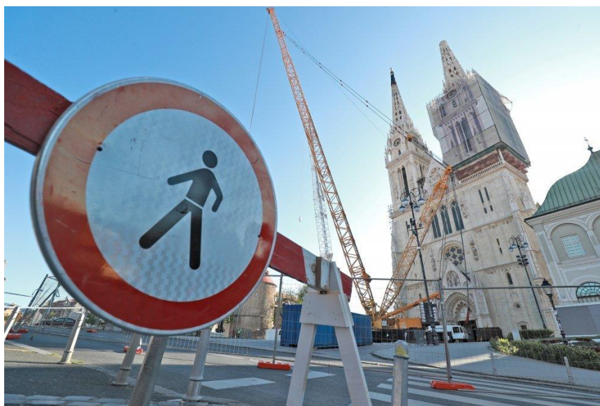
Slika 10. Osiguranje oštećene Zagrebačke katedrale nakon potresa u Zagrebu 2020. godine [10]

vrsti rušenja [12]. Na Slici 10 je prikazana zaštitna ograda i osiguranje prostora uslijed uklanjanja kupole na Zagrebačkoj katedrali.