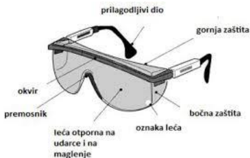
Slika 15. Dijelovi zaštitnih naočala [15]