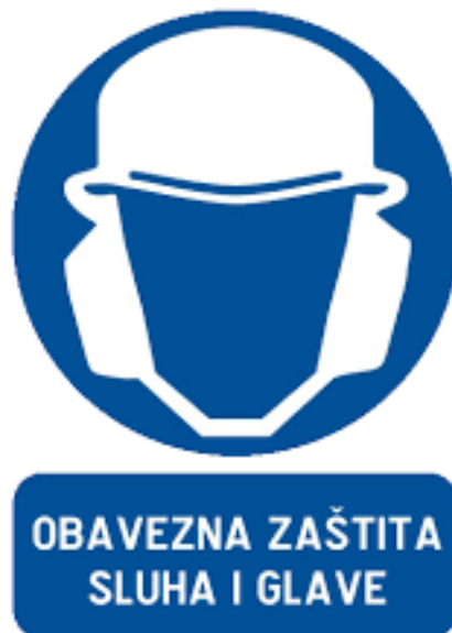
Slika 16: Obvezna zaštita sluha i glave[16]

Ušni čepići se izrađuju od plastičnog materijala u više veličina. Umeću se u slušni kanal potiskivanjem, a vade povlačenjem za hvatač. Ušni štitnik protiv buke izrađuje se u obliku ušnih školjki. Ušne školjke povezane su plastičnim polukružnim nosačem [12, 19].