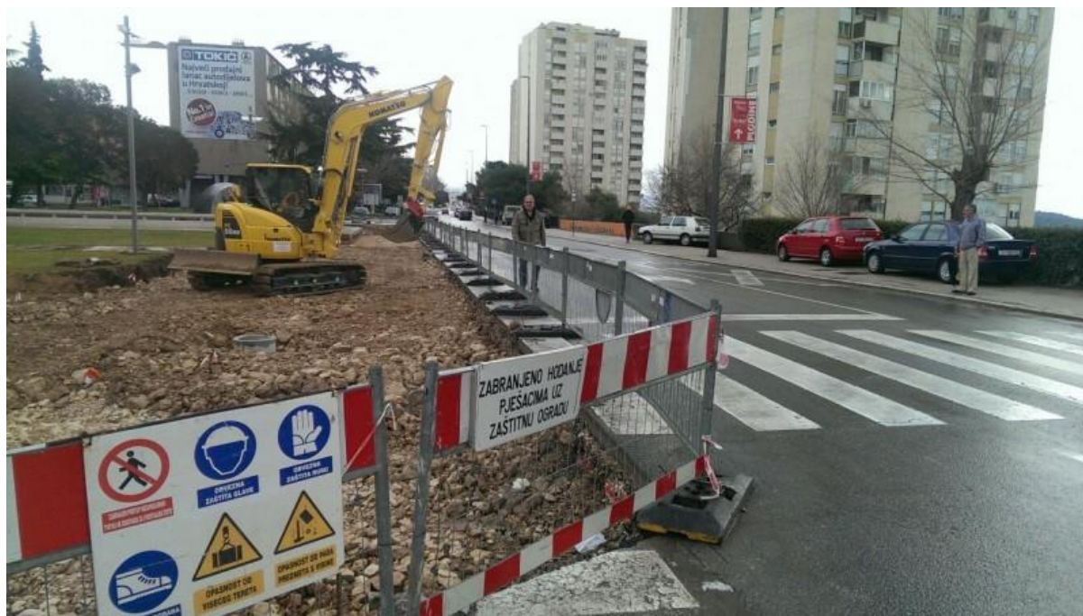
Slika 5.: Primjer uredenog gradilišta u Šibeniku [5]

Radovi mogu početi na gradilištu kad se gradilište uredi u skladu s pravilnikom o zaštiti na radu u građevinarstvu [14].