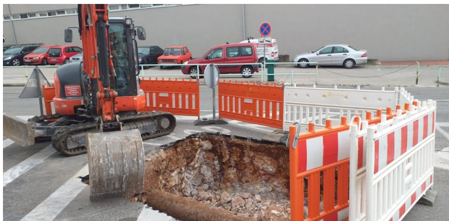
Slika 8.: Pravilno osiguranje gradilišta kod zemljanih radova [8]

Za silazak u iskop i izlazak iz iskopa moraju se osigurati sigurne ljestve čija dužina mora biti najmanje 75 cm iznad iskopa. Rukovoditelj radova mora stalno provjeravati sigurnost iskopa i po potrebi osiguravati odgovarajuće zaštitne mjere protiv opasnosti. Posebno je opasno iskopavanje zemlje pri kišnom vremenu, tj. u prisutnosti vode. Ako je potrebno građevinske jame treba osvjetljivati.