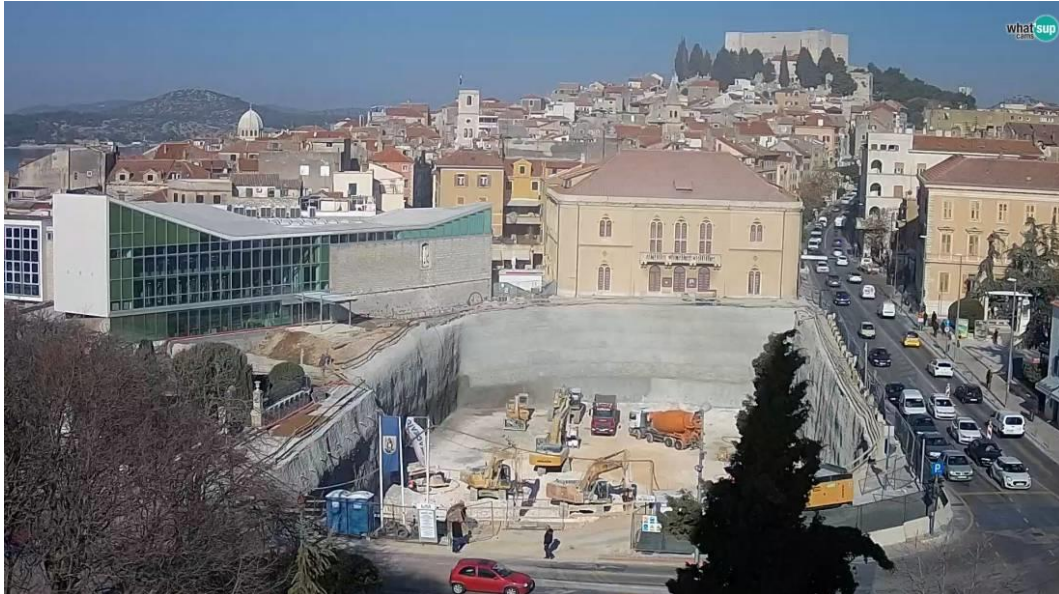
Slika 1. Primjer uređenog gradilišta sa pristupnim putevima (Trg Poljana, Šibenik) [1]

biti omogućen pristup sanitetskim kolima, a širina vrata mora omogućavati nošenje bolesnika na nosilima. 9 Na Slici 1. i 2. su prikazani primjeri uređenog gradilišta sa pristupnim putevima za vatrogasna i sanitetska vozila.