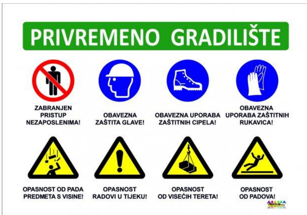
Slika 13: Skupna ploča obveznih znakova za privremena gradilišta [13]

U osobna zaštitna sredstva i opremu spadaju odjeća, obuća, naprave i uređaji koji se koriste pri radu za osobnu zaštitu svakog radnika pojedinačno od štetnih utjecaja radne okoline. Štetni utjecaji radne okoline su dimovi, plinovi, magle i pare, nedovoljno kisika za disanje, nagrizajuće i zapaljive tvari, otrovi, prejako svjetlo, razna zračenja, vrući i hladni predmeti, vibracija, buka, oštri predmeti, električna struja i Slika Koriste se kad postoji neposredna opasnost po zdravlje i život radnika, a da se tehničkim mjerama zaštite te opasnosti ne mogu otkloniti ili bi to tražilo jako velike troškove [18].