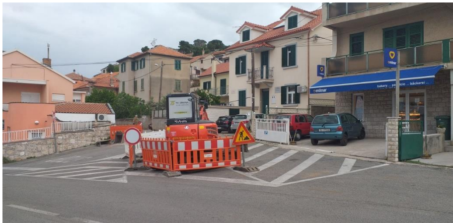
Slika 7.: Pravilno osiguranje gradilišta kod zemljanih radova [7]

Zemljani radovi se smatraju svi radovi u građevinarstvu koji se rade na dubini većoj od 1m. Bilo da se izvode ručno ili strojno potrebno je osigurati zaštitu radnika od zatrpavanja naslaga sa bočnih strana i protiv obrušavanja iskopanog materijala. Izvođenje radova mora se raditi pod kontrolom određene osobe [12]. Na dolje navedenim slikama 7 i 8 je prikazano pravilno osiguranje gradilišta kod zemljanih radova na prometnici u Šibeniku.