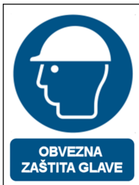
Slika 14.: Obvezna zaštita glave [14]