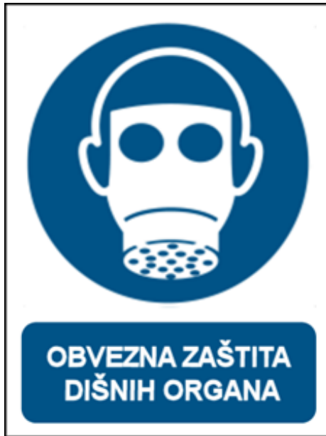
Slika 17: Obvezna zaštita dušnih organa[17]