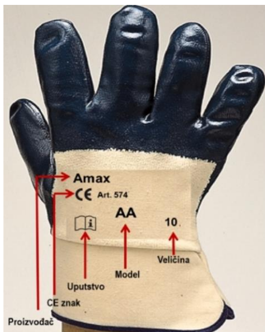
Slika 19: Zaštitne rukavice[19]