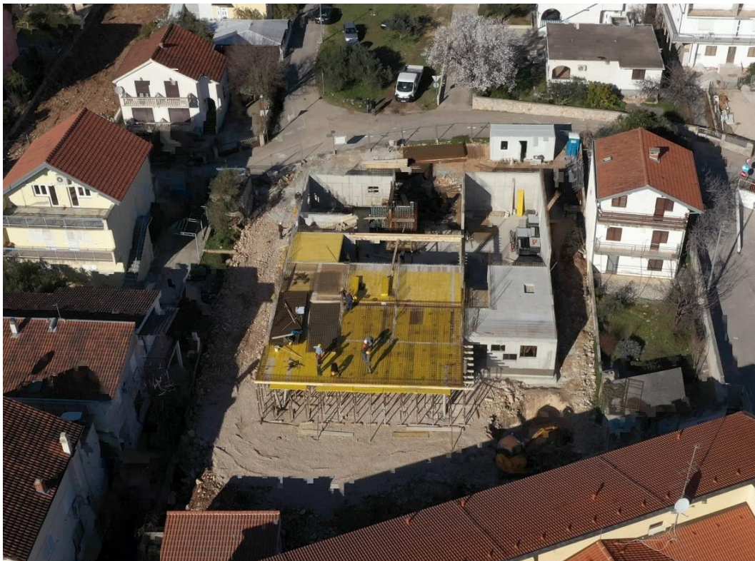
Slika 2. Primjer uređenog gradilišta sa pristupnim putevima (DV „Mendula“, Pirovac) [2]