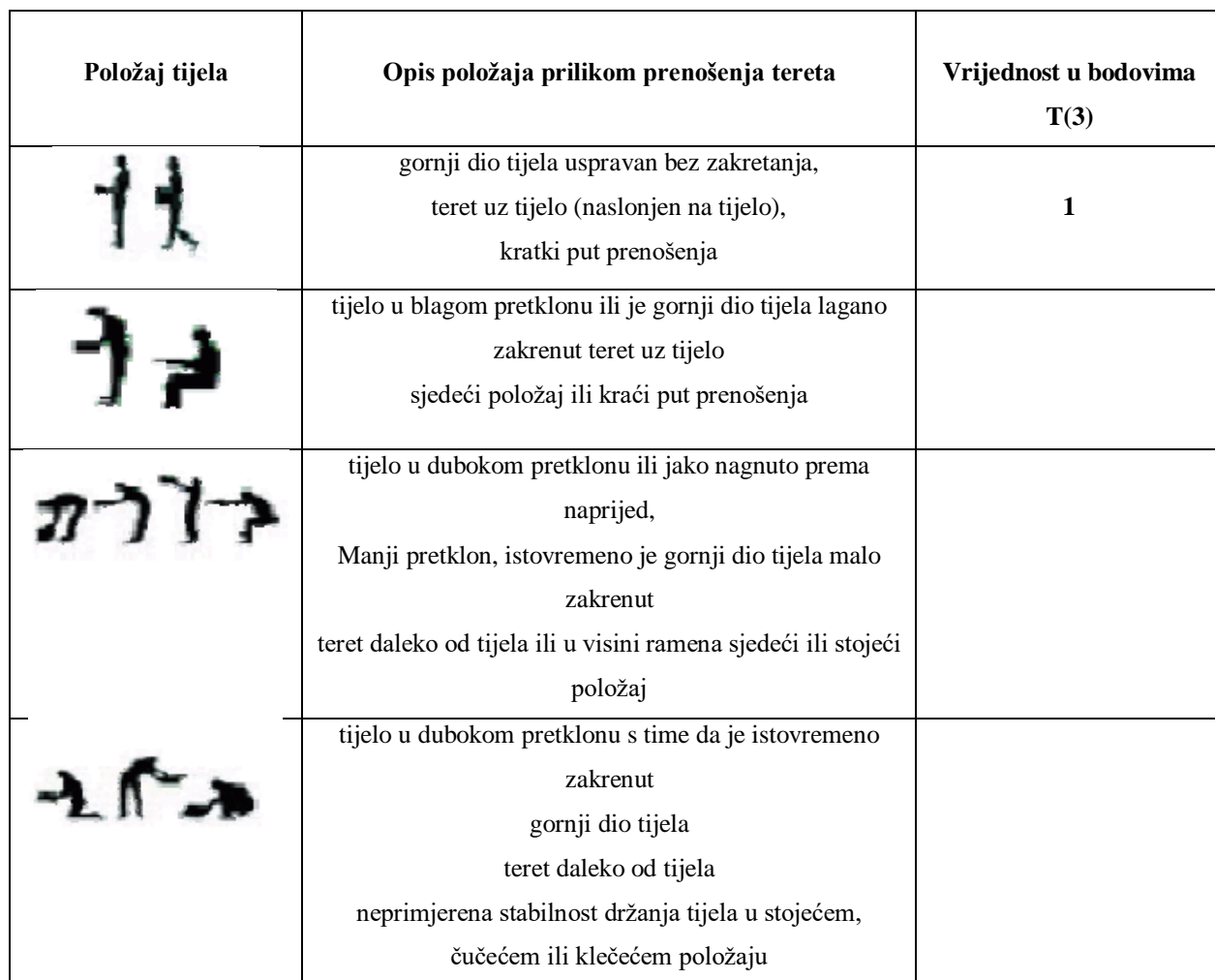
Tablica 17. Stanje na mjestu rada gdje se prenosi teret