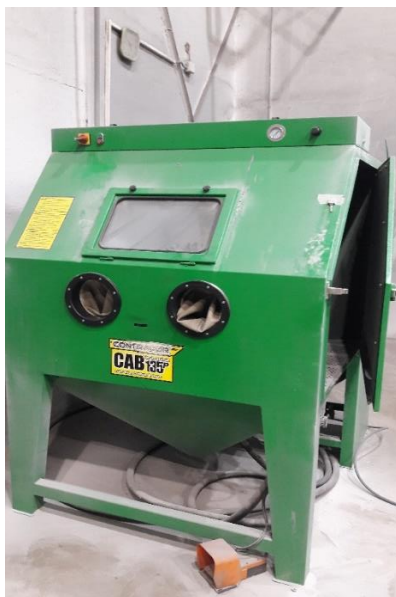
Slika 6. Uređaj za pjeskarenje