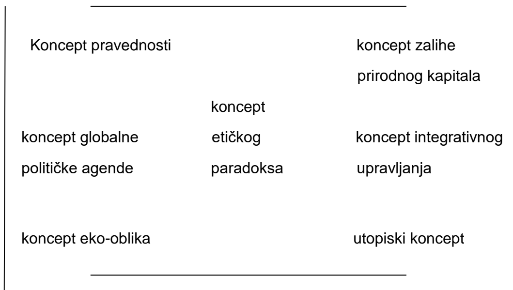
Slika 2. Konceptualni okvir održivog razvoja