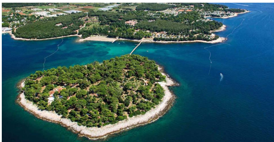
Slika 1. Otok i naturistički kamp Koversada