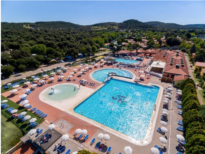
Slika 2. Naturistički kamp Valalta