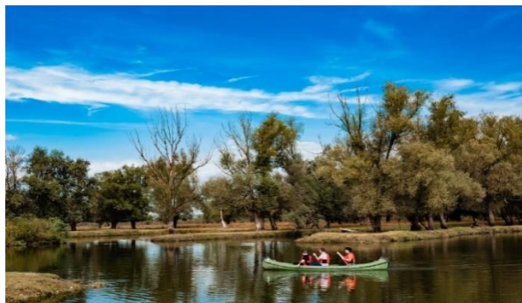
Slika 2. Park prirode Lonjsko polje