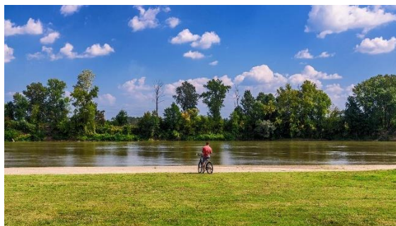
Slika 5. Sportsko – rekreativni centar Poloj