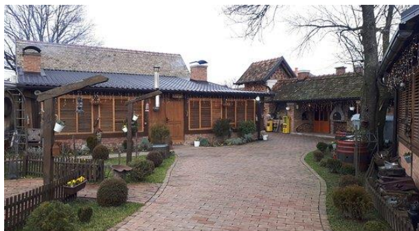
Slika 7. Ugostiteljski kompleks Kuća dida Tunje