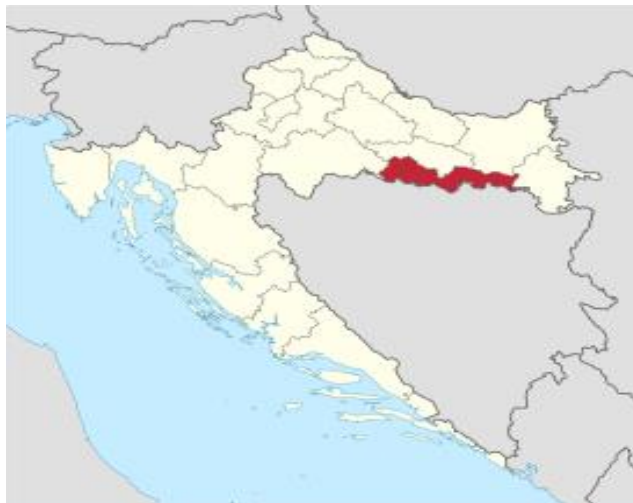
Slika 1. Geografski položaj Brodsko-posavske županije u Republici Hrvatskoj