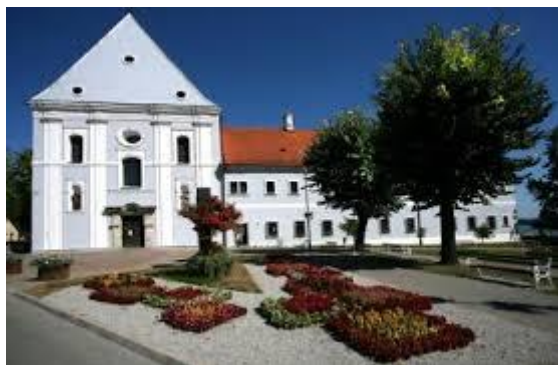
Slika 13. Franjevački samostan