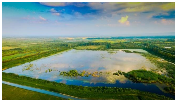
Slika 3. Ribnjak Jelas