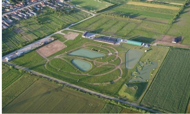
Slika 8. Ugostiteljsko – smještajni objekt i ergela Ranč Ramarin