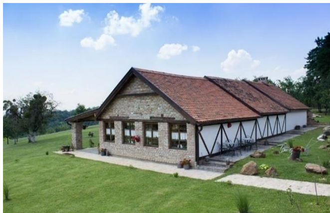
Slika 9. Gospodarstvo Paljevine