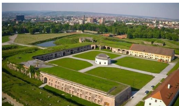
Slika 6. Brodska tvrđava