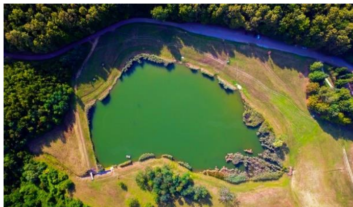
Slika 4. Ljeskove vode