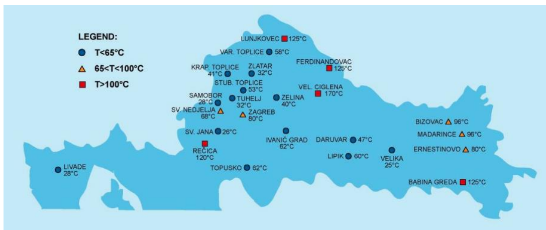
Geografska karta 2. Geotermalni potencijal Hrvatske

Hrvatska raspolaže sa velikim brojem termi i lječilišnih mjesta sa 103 izvora prirodne mineralne vode te se nalazi u samom vrhu UNESCO-ova popisa bogatstva vode u Europi ali i svijetu. U Hrvatskoj postoji duga tradicija korištenja geotermalne energije uglavnom u balneološke svrhe. Većina najpoznatijih hrvatskih termi i lječilišta nalazi se upravo u središnjoj Hrvatskoj, a neka od njih se po kvaliteti mineralne vode ubrajaju u prvih deset u Europi. Po kvaliteti termalne vode u Topuskom zauzimaju treće, a u Krapinskim Toplicama šesto mjesto u Europi.