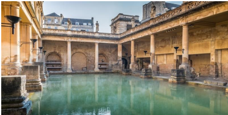
Slika 3. Rimske terme u Bathu