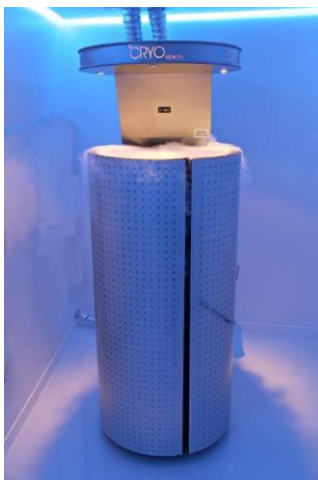
Slika 10. Krio sauna za terapiju tekućim dušikom na -160\text{ }^{\circ}\text{C}