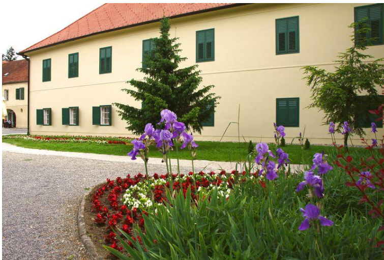
Slika 9. Zgrada Maksimilijan