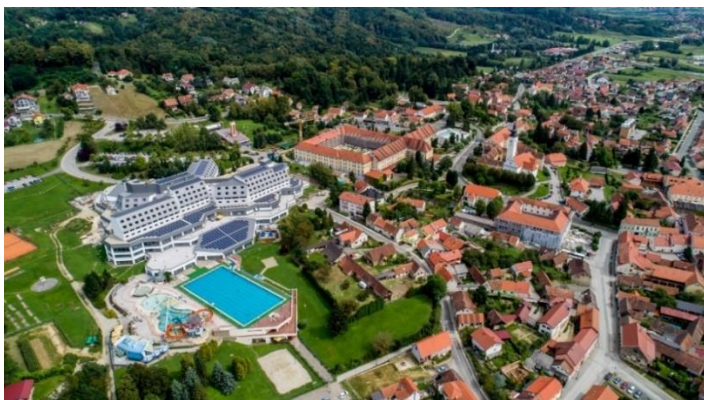
Slika 18. Specijalna bolnica za medicinsku rehabilitaciju Varaždinske Toplice