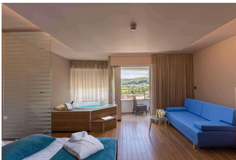
Slika 6. Spa Premium dvokrevetna soba u Hotelu Villa Magdalena