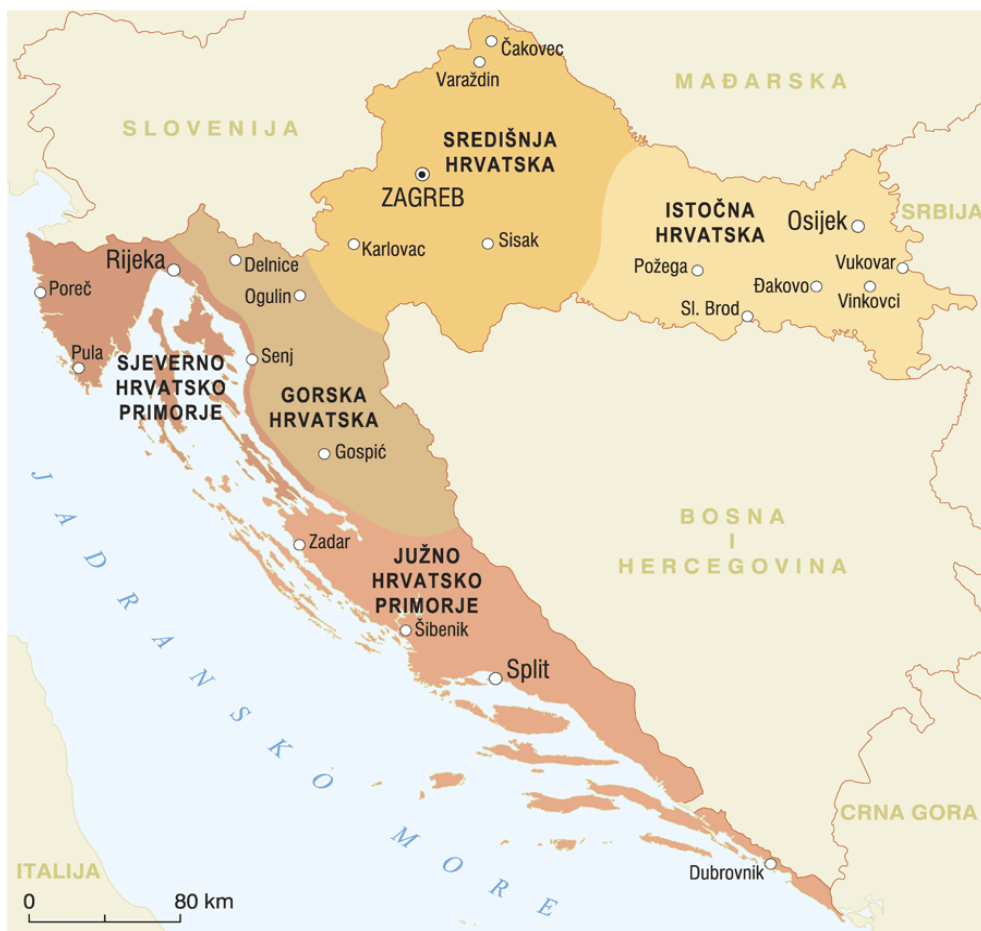
Geografska karta 1. Suvremena regionalna podjela Republike Hrvatske