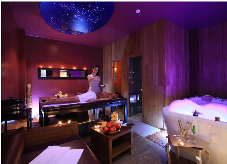
Slika 16. Vip Spa Suite