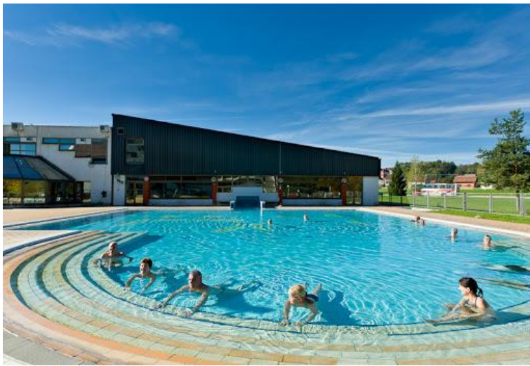
Slika 20. Top Terme Topusko