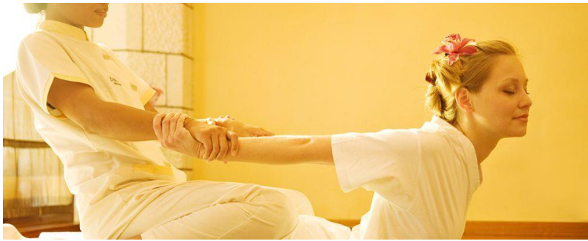
Slika 15. Tajlandska masaža