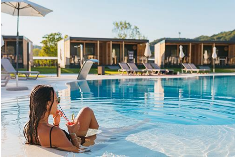
Slika 8. Glamping Village Terme Tuhelj