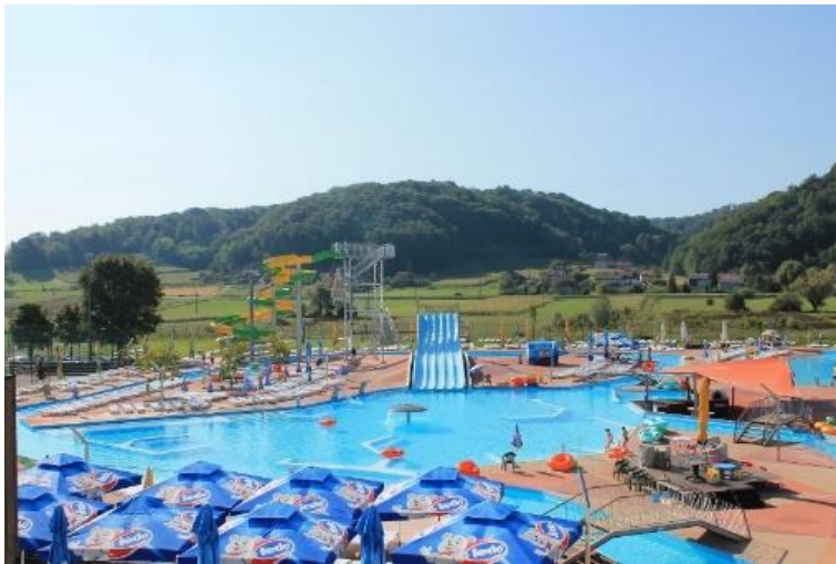
Slika 7. Terme Tuhelj