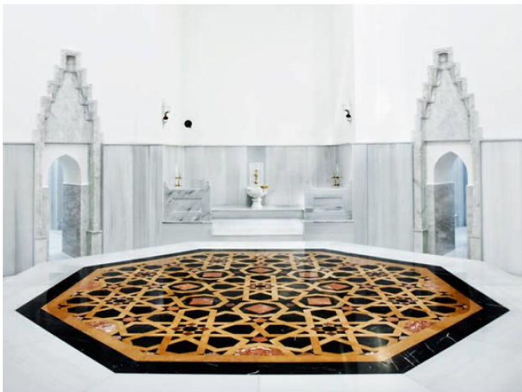
Slika 4. Hamam sultanije Hurem koji datira iz 1556. godine