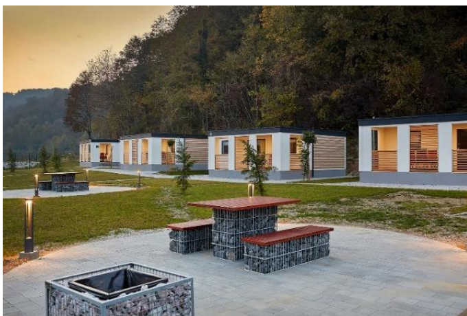
Slika 13. Kamp Terme Jezerčica

Izvor: Fotogalerija - Terme Jezerčica (terme-jezercica.hr) (4.7.2021.)