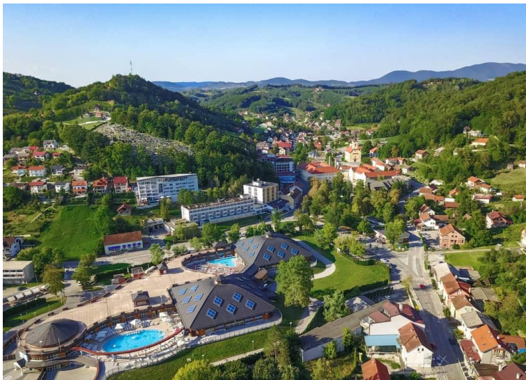
Slika 5. Krapinske Toplice