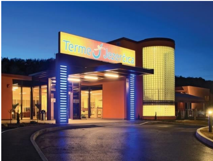
Slika 12. Hotel Terme Jezerčica