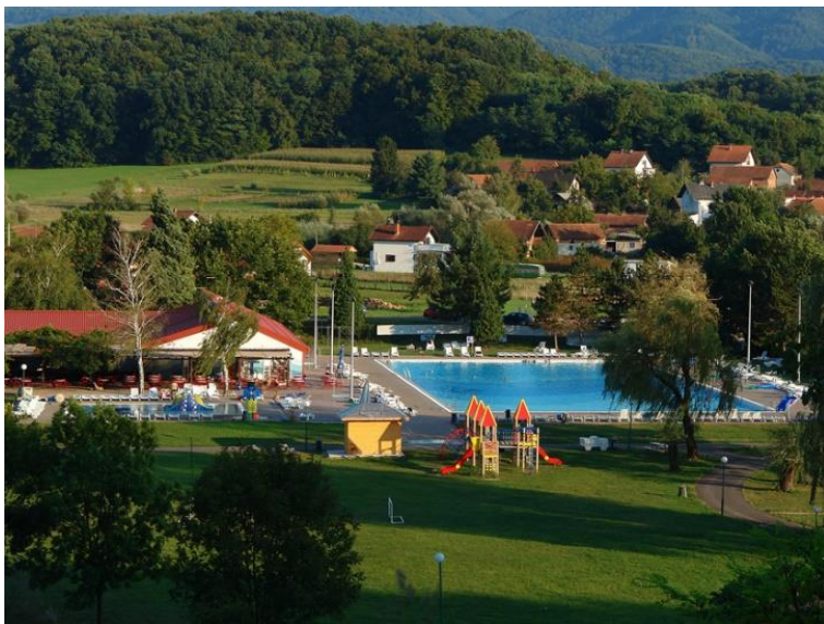
Slika 11. Terme Jezerčica