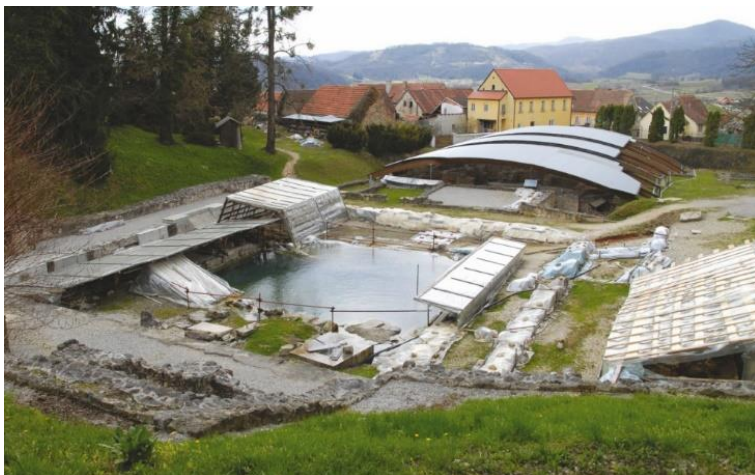
Slika 17. Aqua Iasae