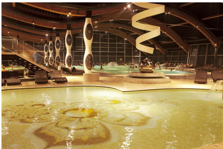
Slika 14. Life Class Terme Sveti Martin