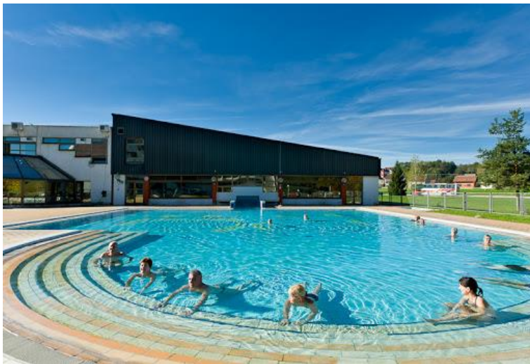
Slika 20. Top Terme Topusko