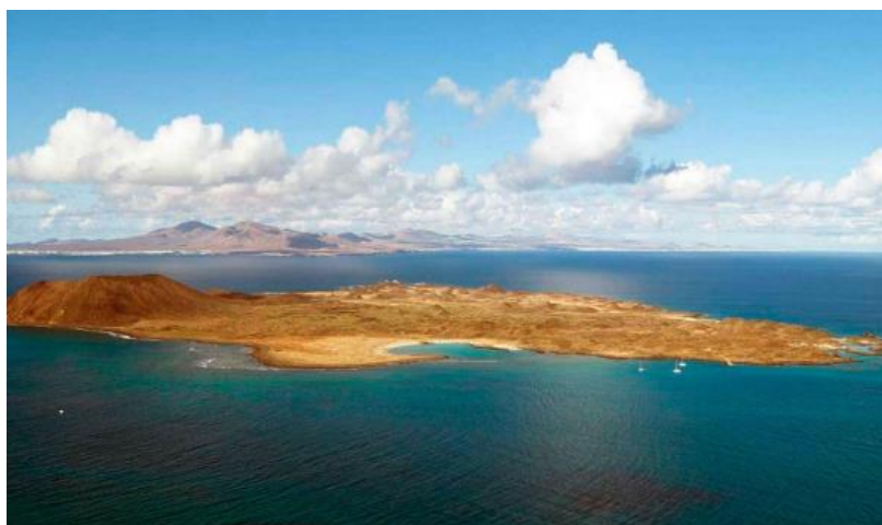
Slika 2. Otok Fuertaventura