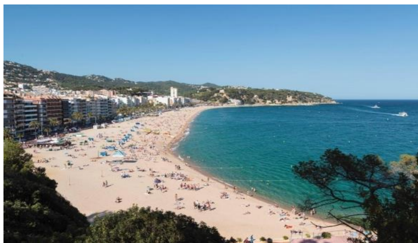
Slika 3. Lloret de Mar