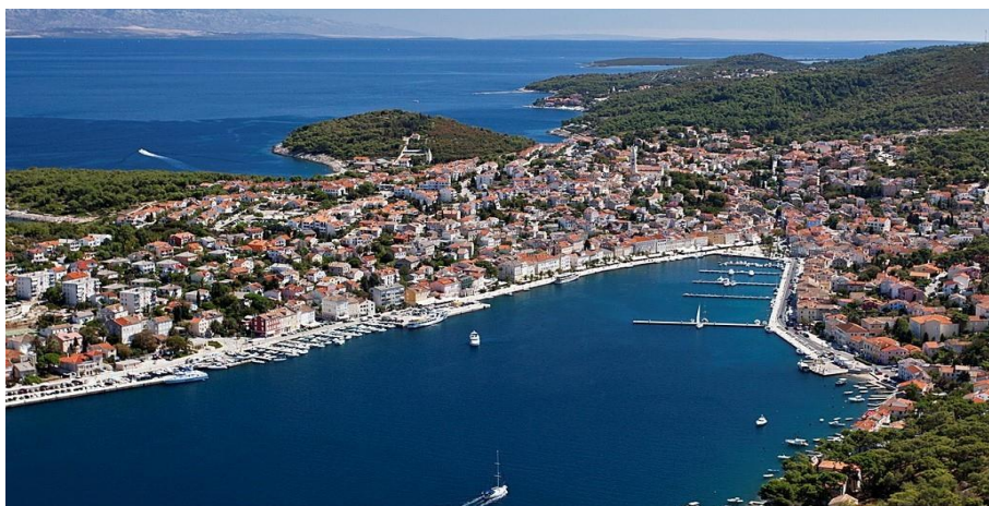
Slika 4. Mali Lošinj