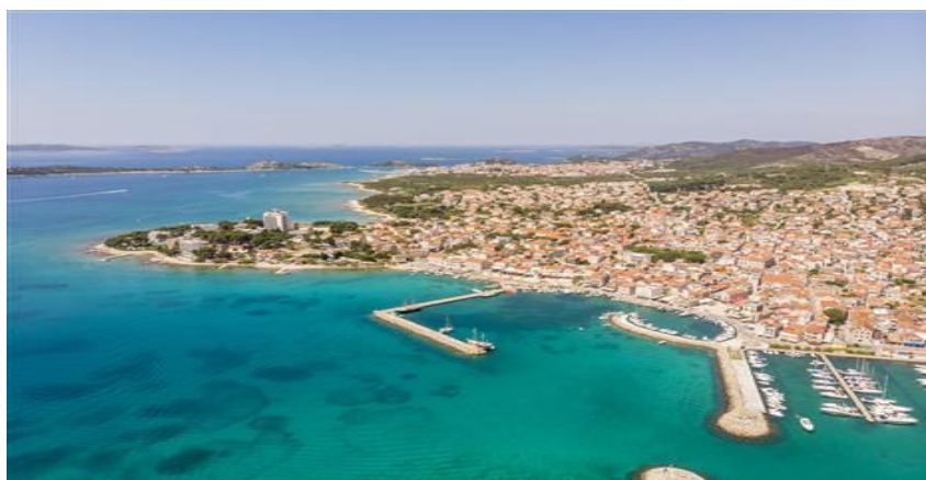
Slika 5. Vodice