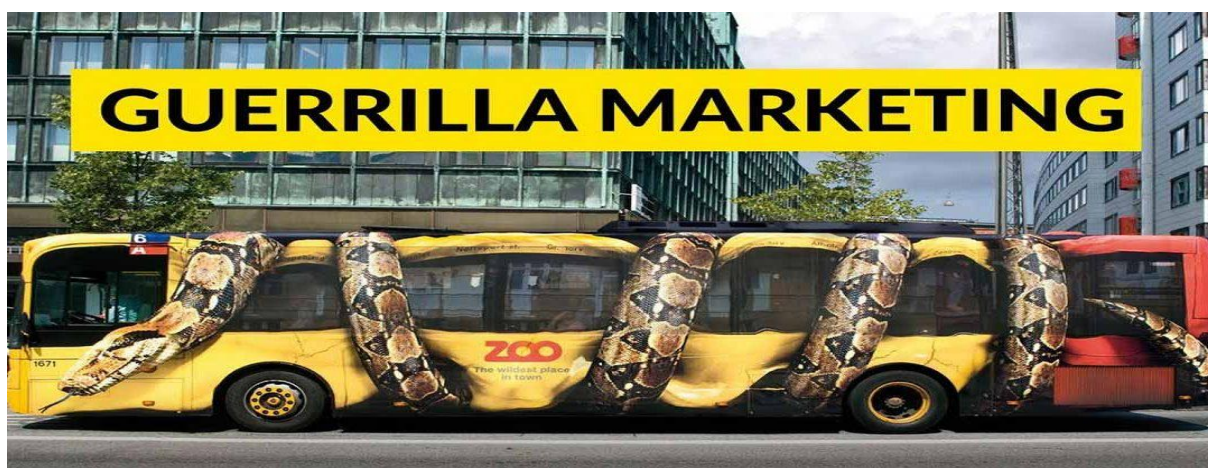
Slika 3. Primjer gerila marketinga