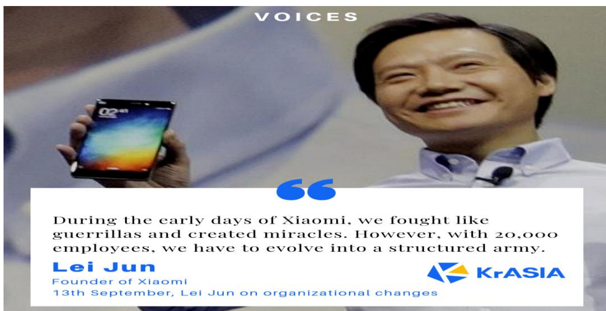
Slika 9. Lei Jun - osnivač korporacije Xiaomi