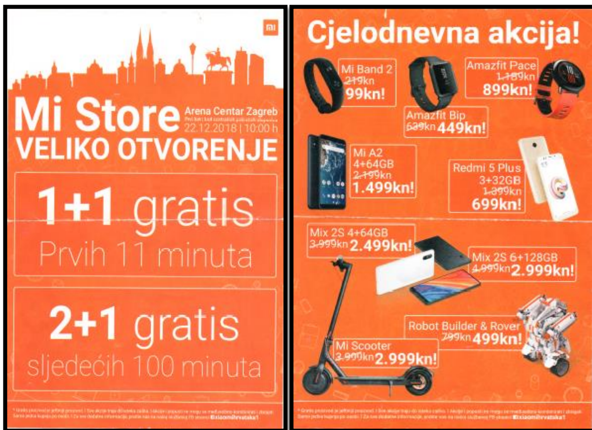
Slika 15. Prednja i zadnja strana letka prve otvorene „MI“ trgovine u Hrvatskoj