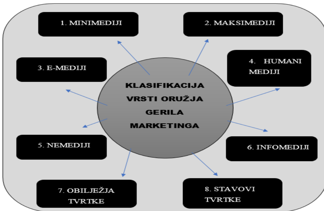
Slika 7. Klasifikacija alata gerila marketinga