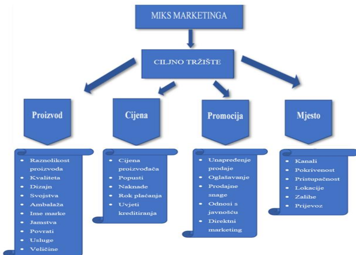
Slika 1. Marketing miks 4P

Izvor: Samostalna obrada autora, prilagođeno prema Kotler, P.: Kotler o marketingu: kako stvoriti, osvojiti i gospodariti tržištima , Poslovni dnevnik MASMEDIA, Zagreb, 2006., str. 105 (12.08.2020.)