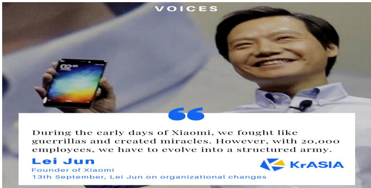
Slika 9. Lei Jun - osnivač korporacije Xiaomi