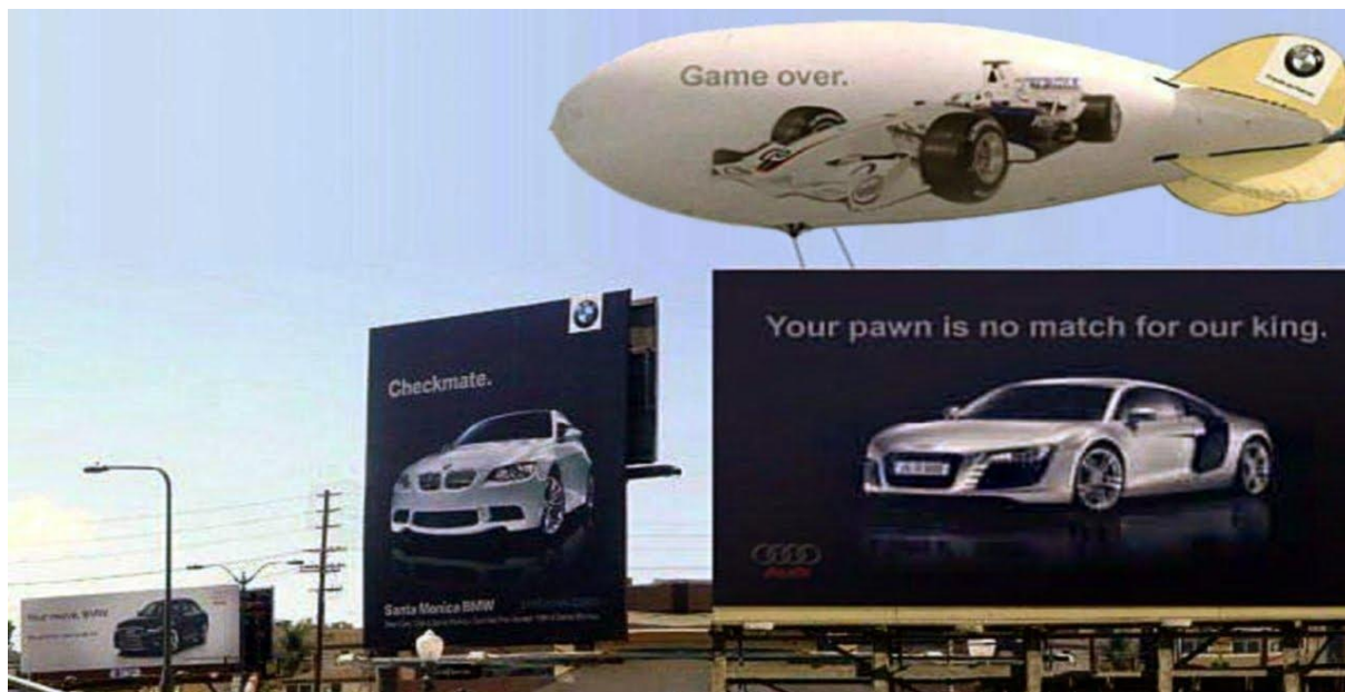
Slika 6. BMW vs. AUDI