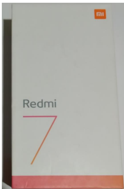
Slika 18. Prepoznatljivi "MI" logo na Xiaomi kutiji pametnog telefona

Xiaomi korporacija konstantno gradi i nadograđuje identitet tvrtke, stvarajući ugled Xiaomi korporacije koji joj daje imidž društveno odgovorne korporacije s naglaskom na održivi razvoj.