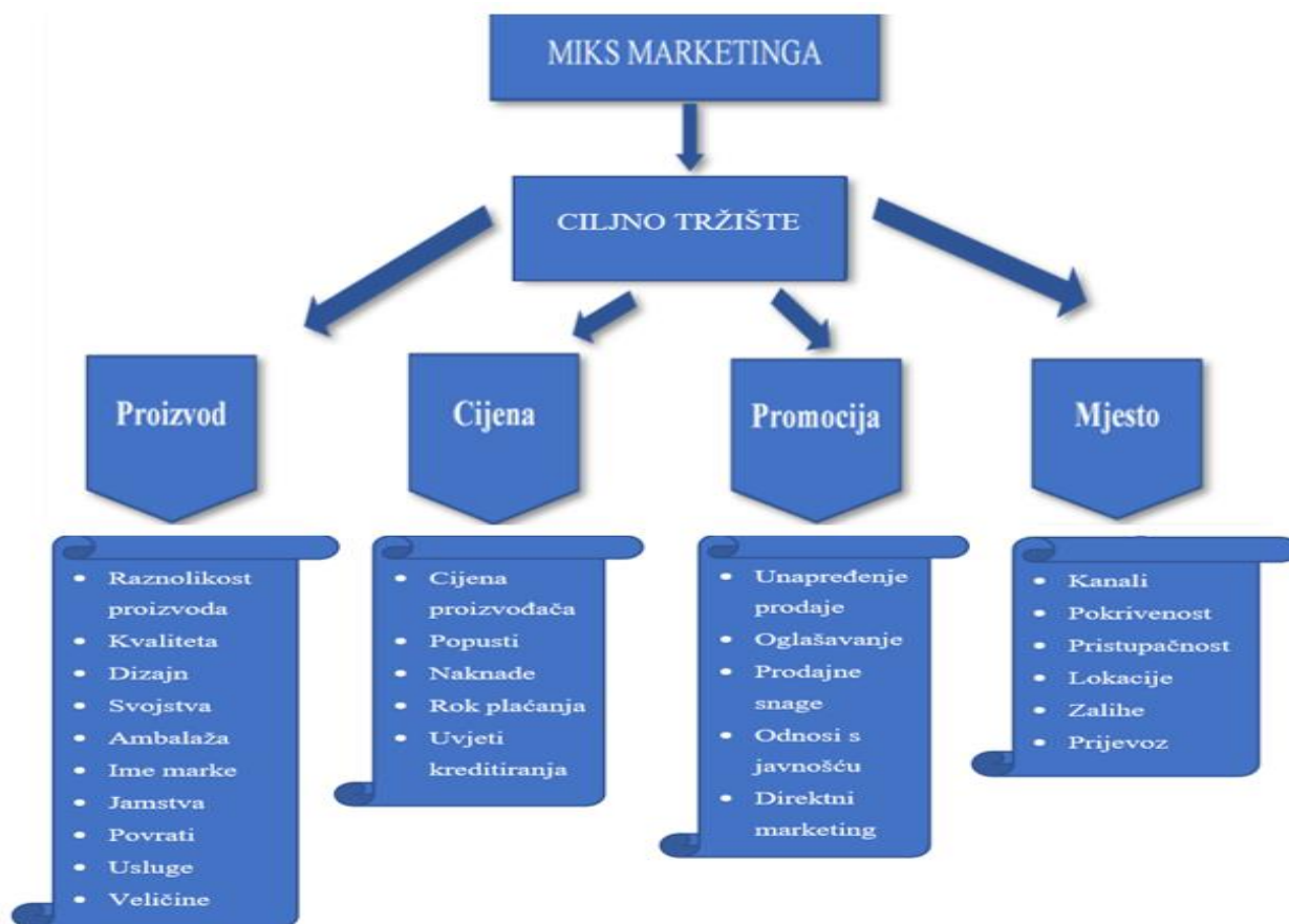
Slika 1. Marketing miks 4P