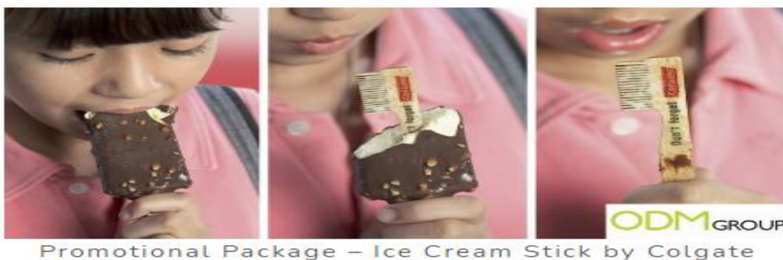
Promotional Package – Ice Cream Stick by Colgate