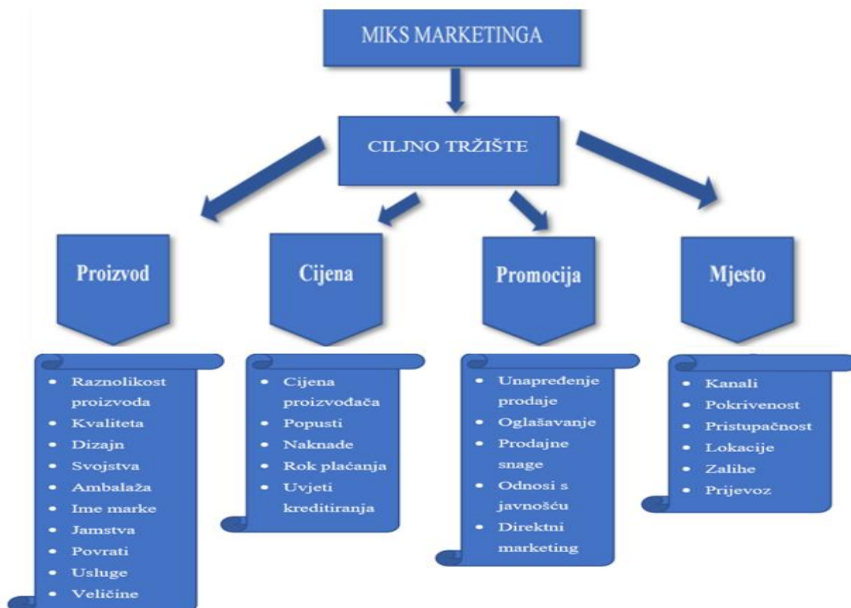
Slika 1. Marketing miks 4P