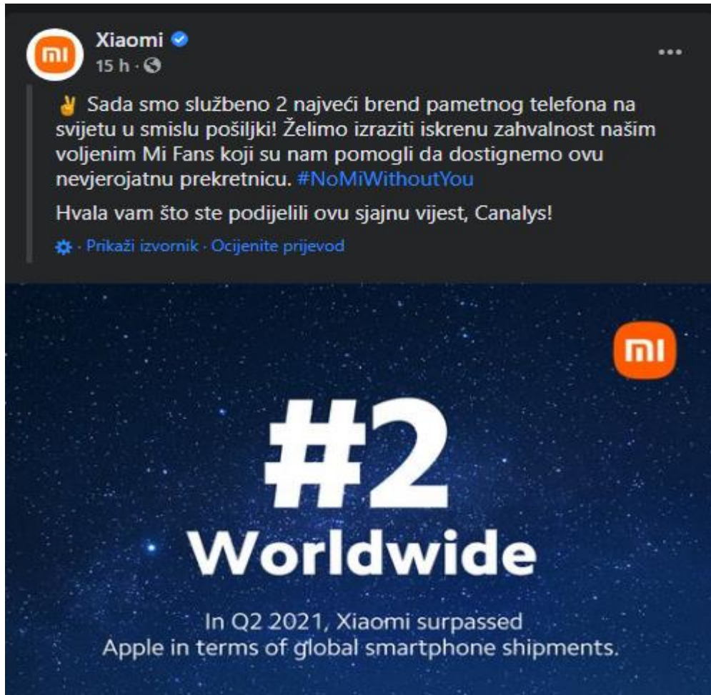
Slika 14. Xiaomi prestigao Apple