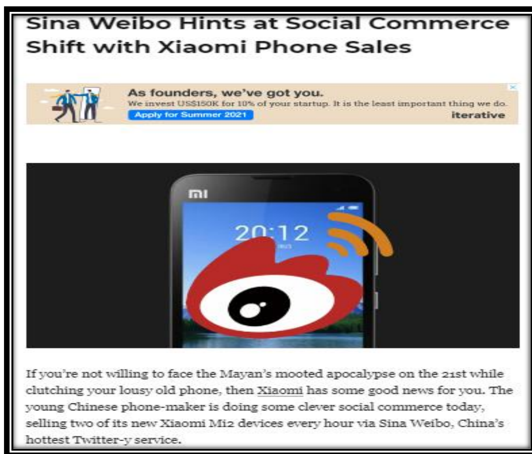
Slika 10. Weibo - popularna kineska platforma za društvene medije