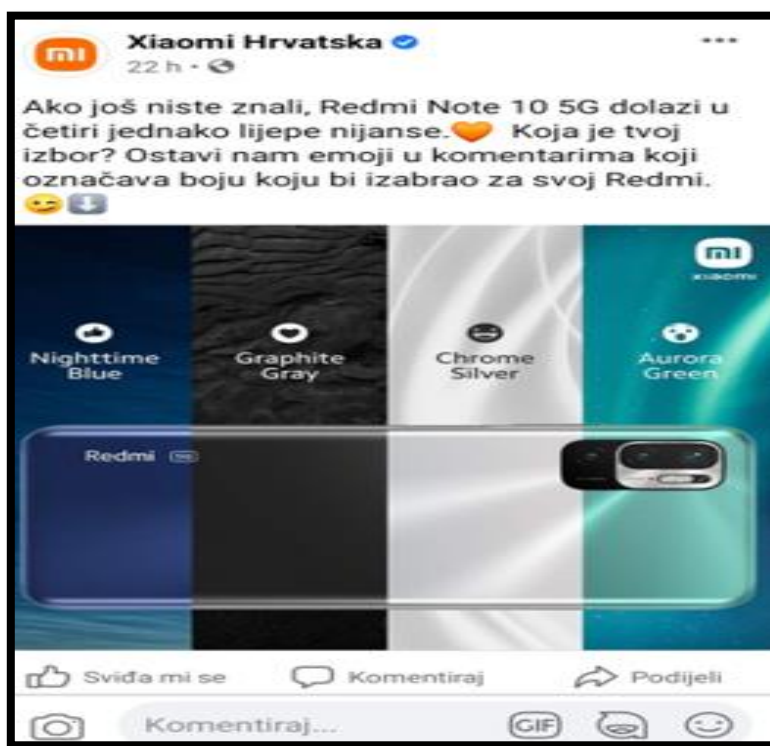
Slika 11. Fanovi biraju boju novog smartphone modela