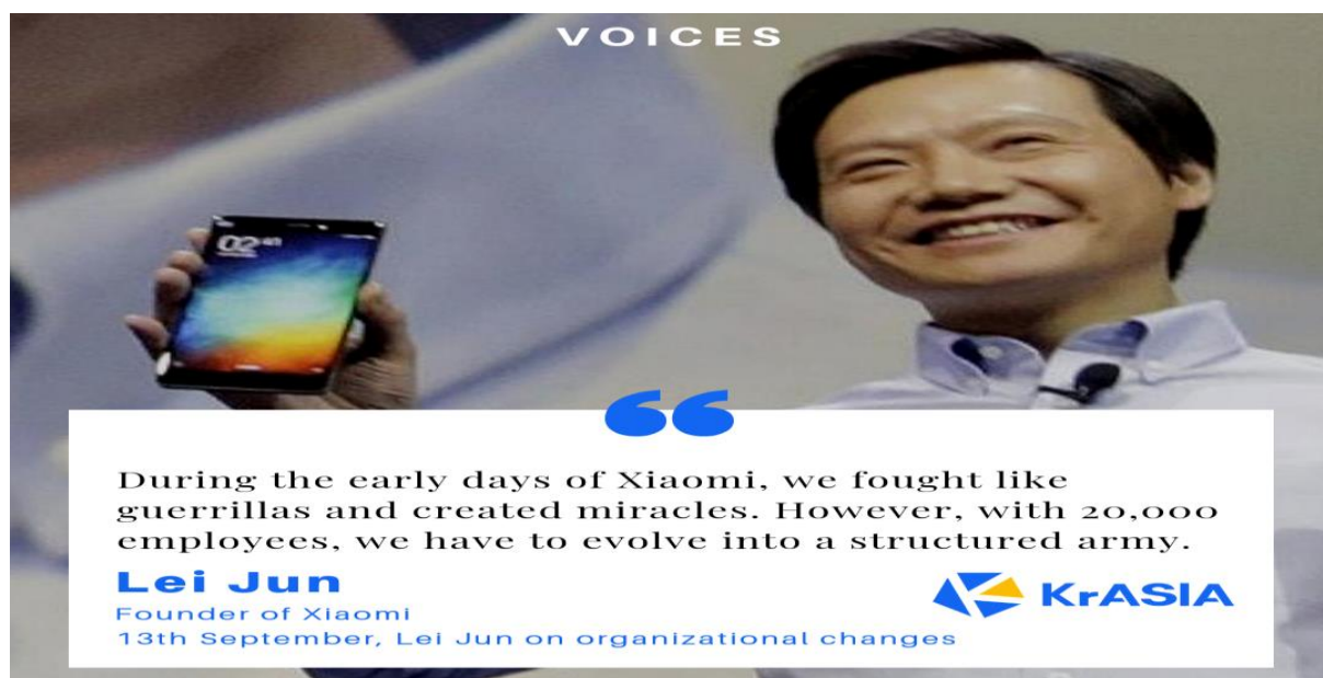
Slika 9. Lei Jun - osnivač korporacije Xiaomi