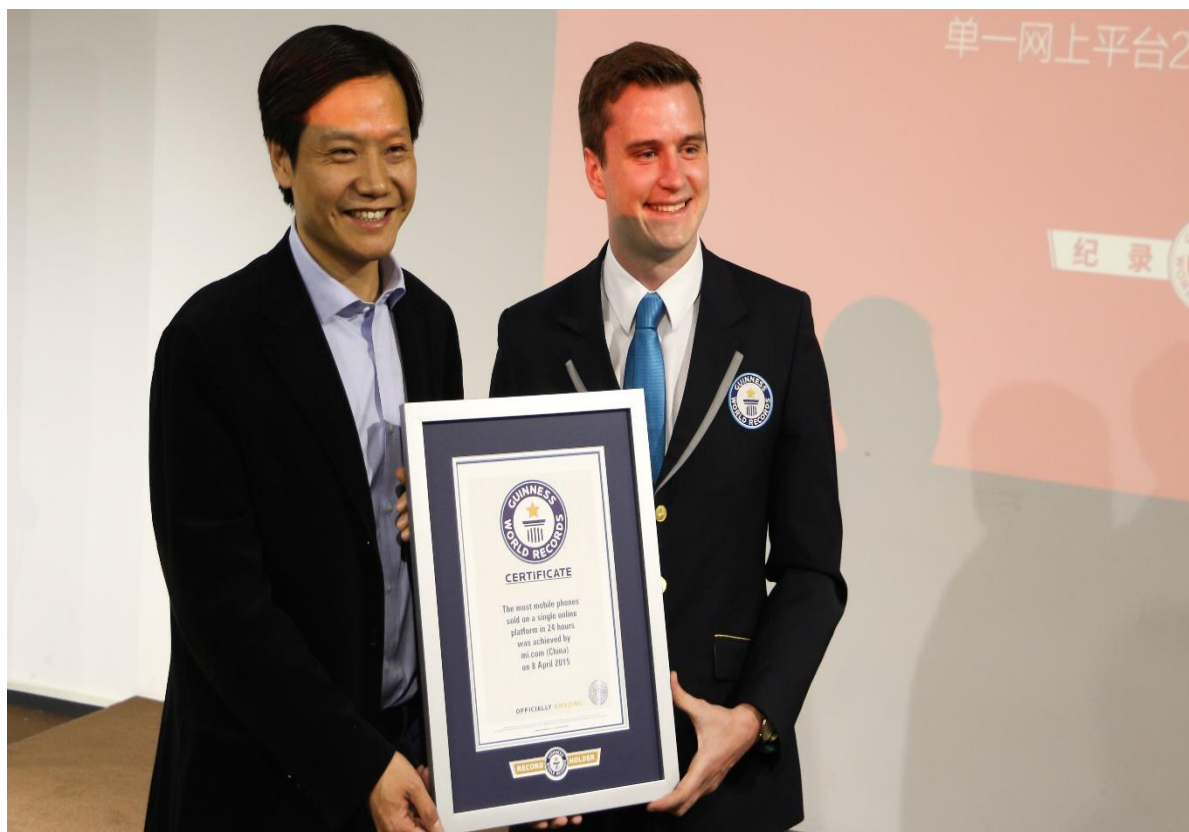
Slika 12. Certifikat za službeni Guinnessov svjetski rekord