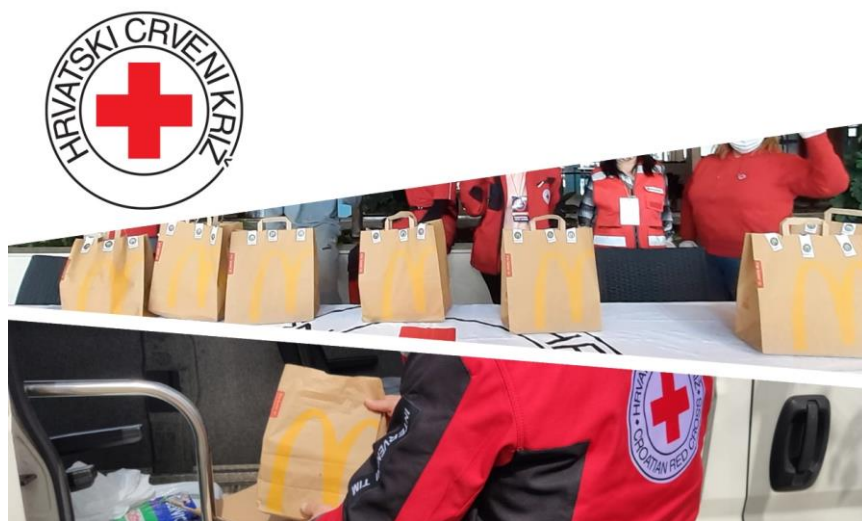
Slika 3. Donirani obroci