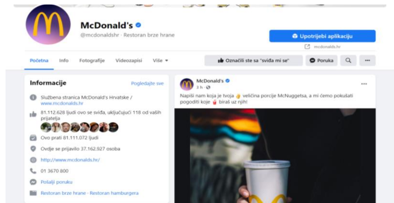
Slika 9. McDonald's društvene mreže - Facebook