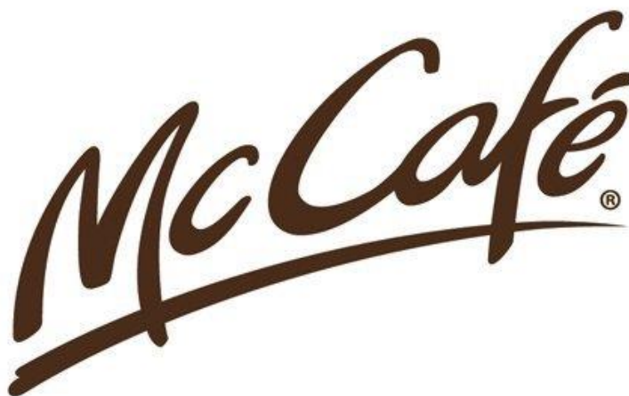
Slika 2. McCafe logo