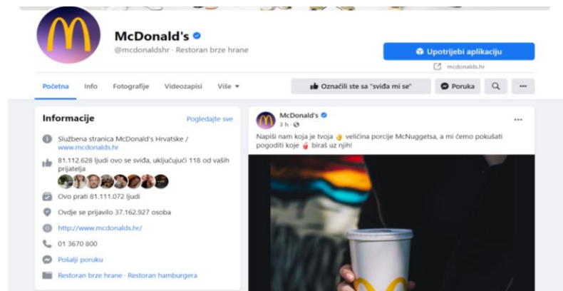
Slika 9. McDonald's društvene mreže - Facebook