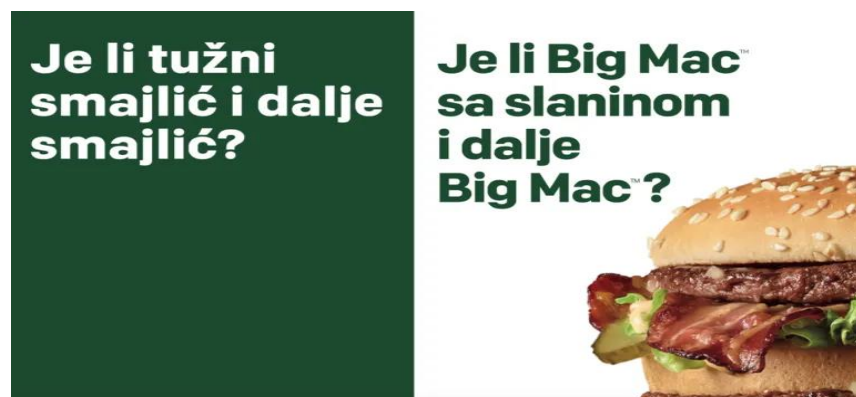
Slika 6. Big Mac oglas