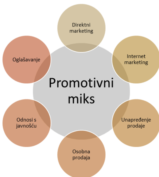
Grafikon 1. Promotivni miks