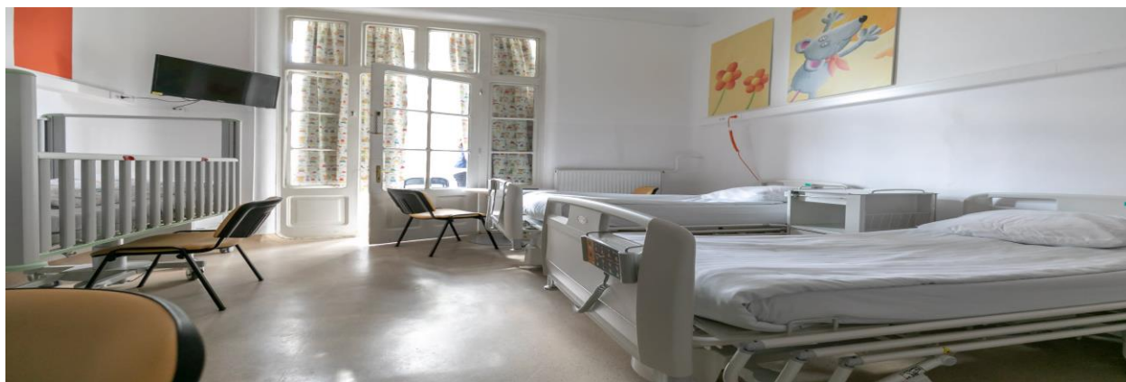
Slika 5. Uređene bolničke sobe u Klaićevoj