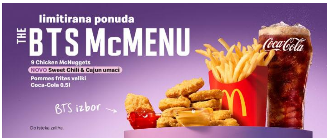
Slika 7. BTS McMenu