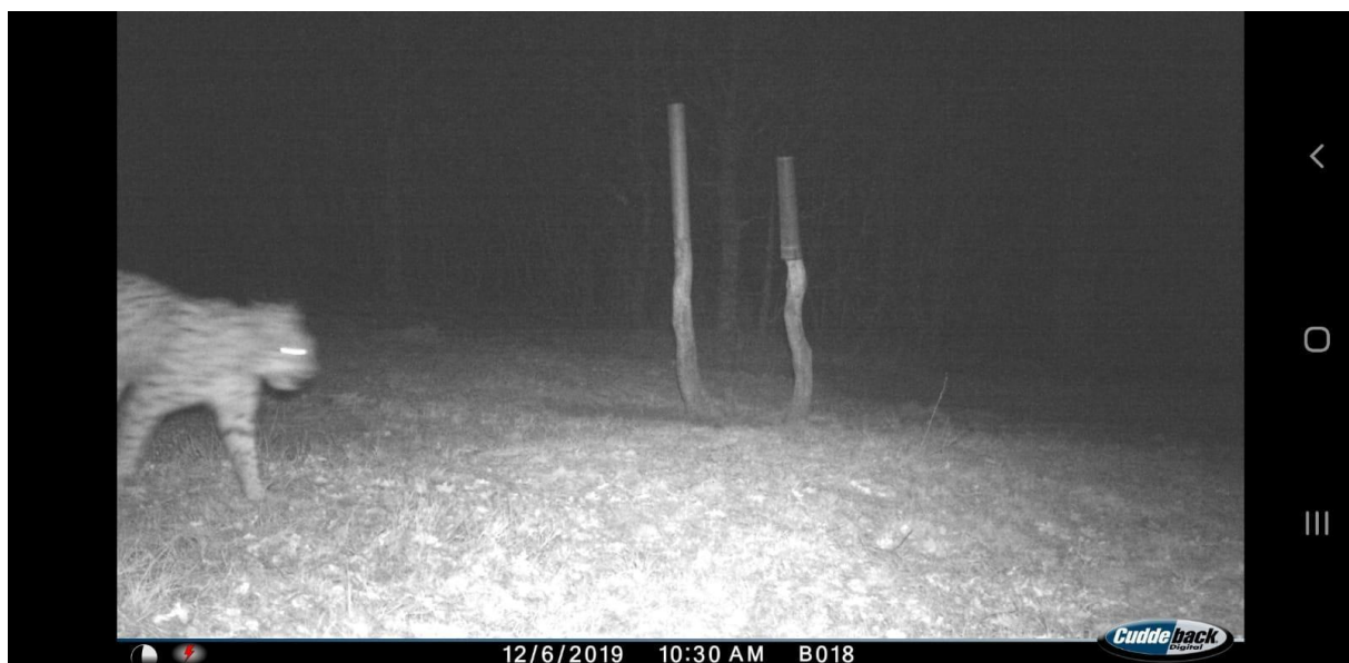
Slika br. 4: Primjer fotografije problematične za identifikaciju