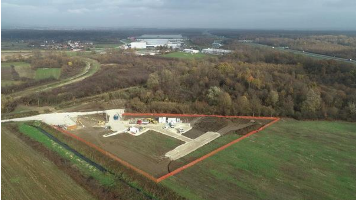
Slika 3. Mjesto izgradnje uređaja za pročišćavanje otpadnih voda aglomeracije Jastrebarsko [7]