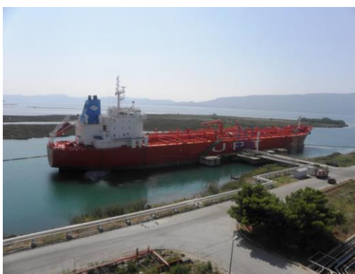
Slika 7. Pretakalište brodova i zglobni utakači.