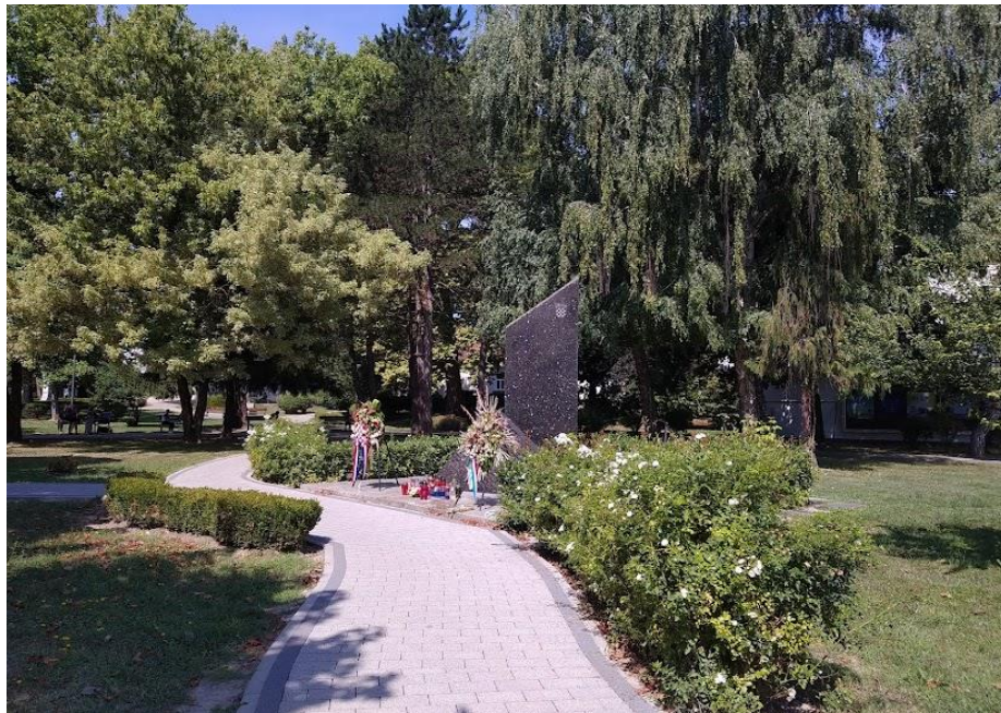
Slika 6: Park hrvatskih branitelja

Izvor: Fotografija autorice (11.7.2021.)