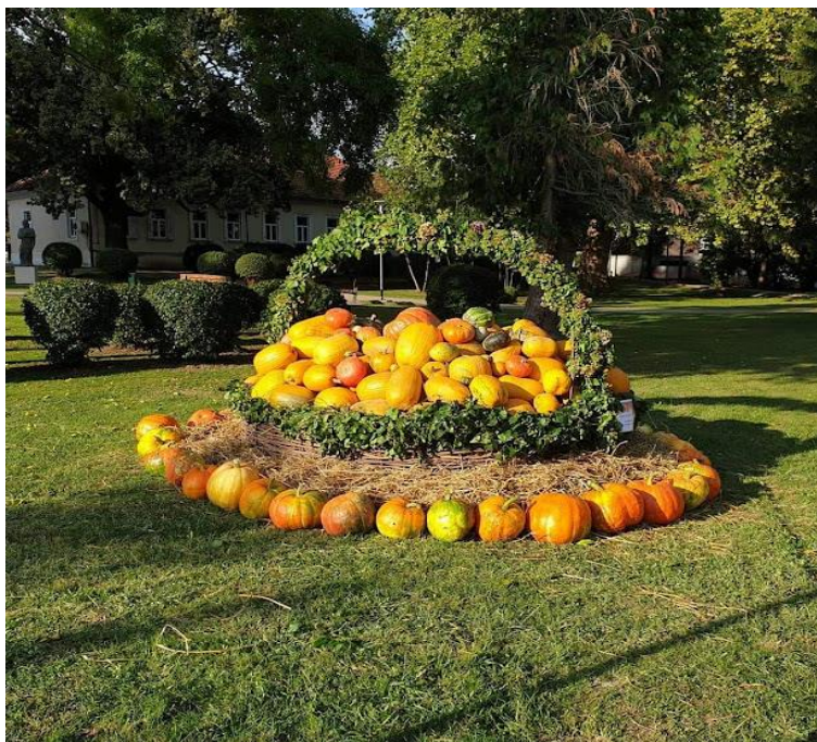
Slika 8: Košara sa bučama, Bučijada 2020. godine