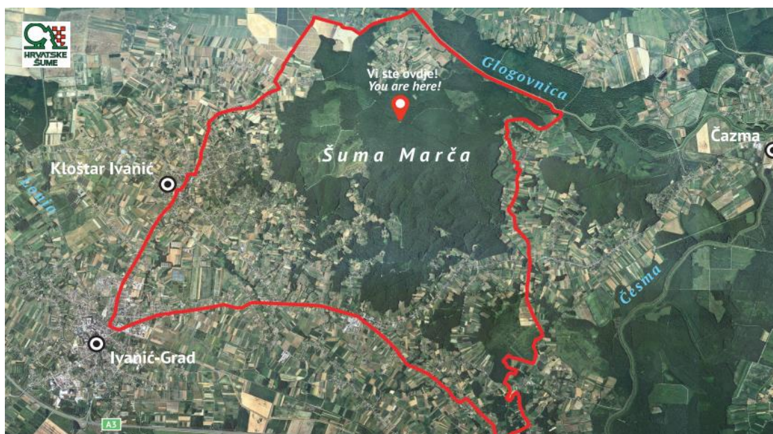
Slika 4: Šuma Marča