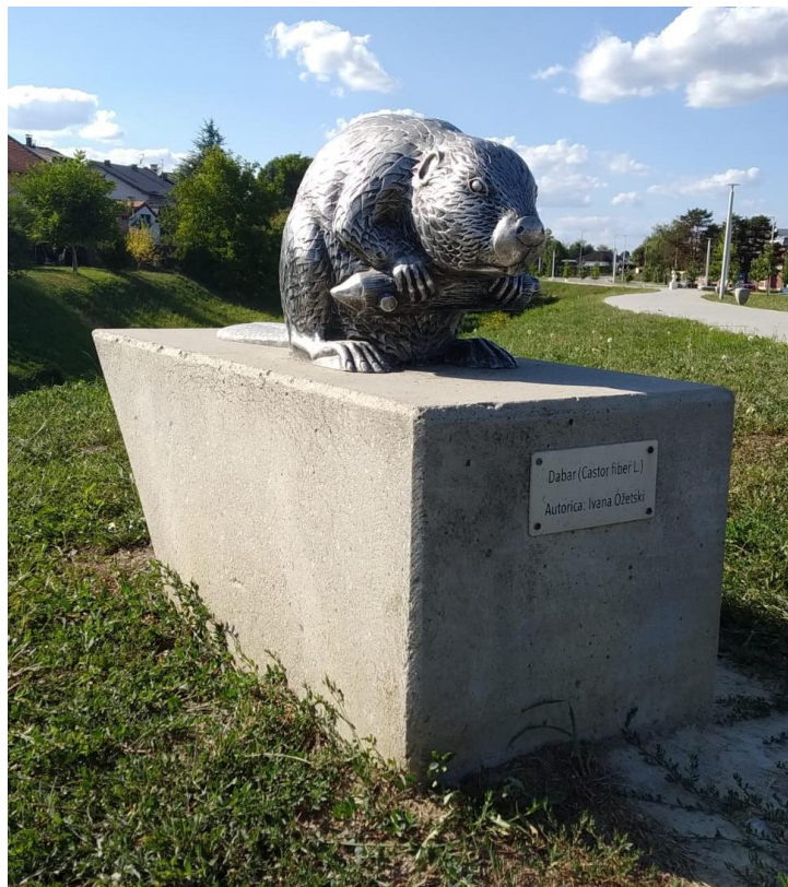
Slika 3: Skulptura „Dabar“ autorice Ivane Ožetski, šetnica Ivanić-Grad

Izvor: fotografija autorice (11.7.2021.)