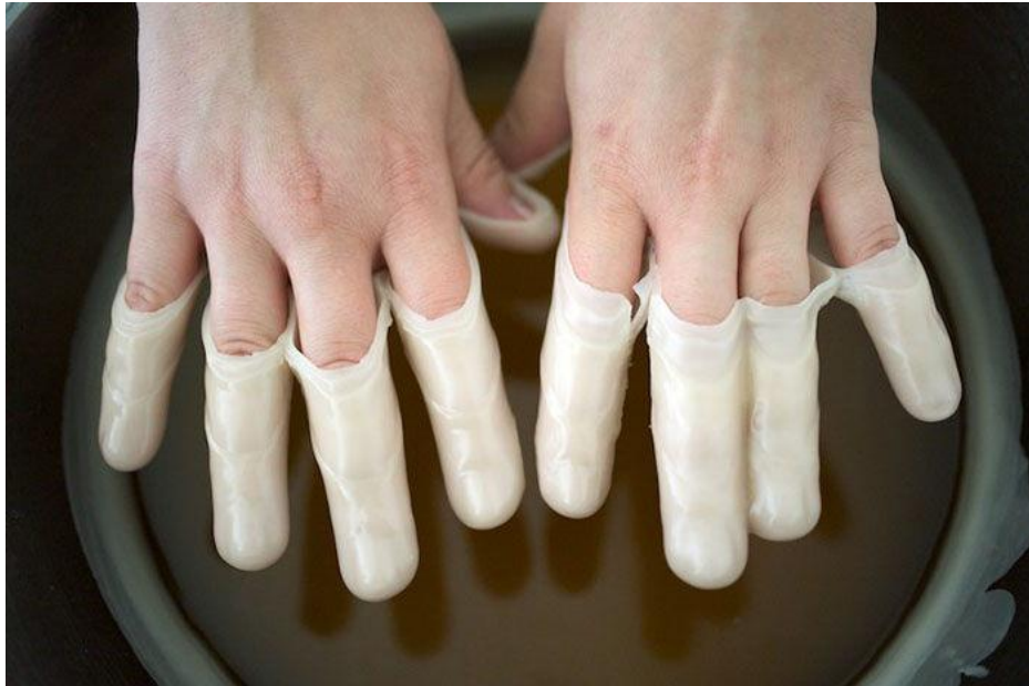
Slika 9: Mastikoterapija, pripravak koji nakon hlađenja postane krut