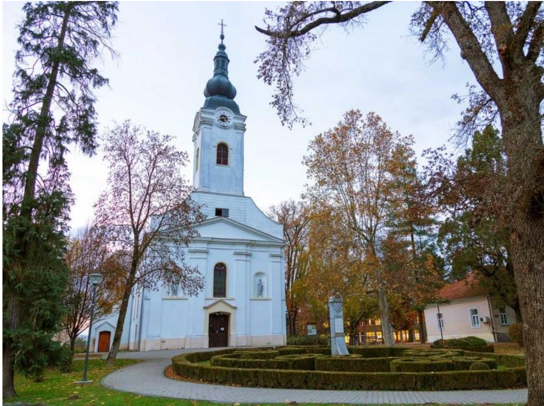
Slika 7: Župna crkva svetog Petra Apostola