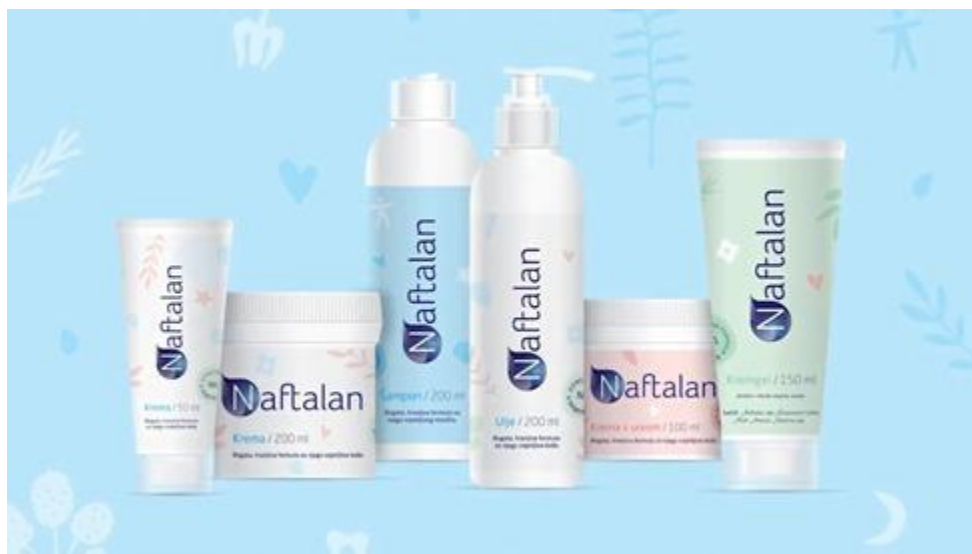
Slika 10: Proizvodi Naftalan kozmetike