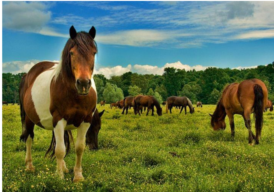
Slika 2: Pašnjak „Gospođica“, Šuma Žutica