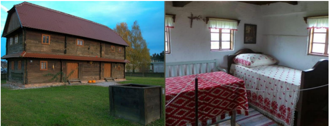
Slika 5: Tradicijski čardak – vanjski i unutarnji izgled