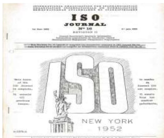
Slika 1. naslovnica ISO časopisa iz svibnja 1952. Izvor: https://www.iso.org/the-iso-story.html#3 , pristupio: 21.4.2020.

Priča o ISO, skraćeno od International Organization for Standardization, odnosno Internacionalna organizacija za standardizaciju, počinje davne 1946. godine u Londonu, kada se sastalo 65 delegata iz 25 zemalja svijeta kako bi razgovarali o budućnosti međunarodne standardizacije. Već 1947. ISO useljava u svoje urede u jednu privatnu kuću u Ženevi. Godine 1951. nastaje prva norma koja se nazivala preporukom, nazvana ISO/R1:1951 Standardna referentna temperatura za mjerenja industrijske duljine. Od tada je norma više puta ažurirana i sada je ISO 1: 2002 Geometrijske specifikacije proizvoda (GPS) - Standardna referentna temperatura za geometrijske specifikacije proizvoda. Naslovnica ISO časopisa (slika 1) prikazuje časopis iz svibnja 1952.