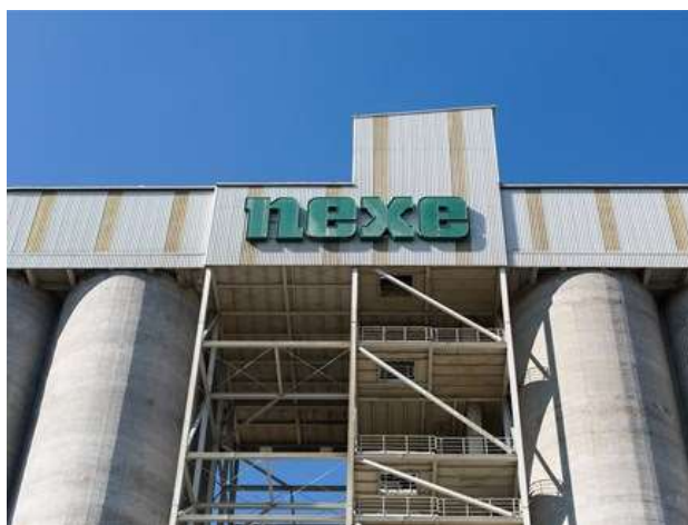
Slika 4. Nexe grupa – regionalni proizvođač građevinskog materijala

Nexe d.d. sa sjedištem u Našicama, vodeći je proizvođač i prijevoznik svježeg betona u Hrvatskoj (slika 4). Društvo ima 440 zaposlenih i posluje na sedam lokacija unutar zemlje. Dio je grupacije Nexe grupacija d.d. poslovni je subjekt sa 16 tvrtki koje posluju u Hrvatskoj, Srbiji i Bosni i Hercegovini.