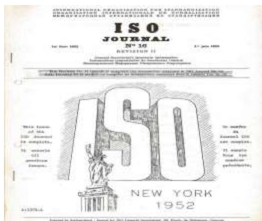
Slika 1. naslovnica ISO časopisa iz svibnja 1952.

Priča o ISO, skraćeno od International Organization for Standardization, odnosno Internacionalna organizacija za standardizaciju, počinje davne 1946. godine u Londonu, kada se sastalo 65 delegata iz 25 zemalja svijeta kako bi razgovarali o budućnosti međunarodne standardizacije. Već 1947. ISO useljava u svoje urede u jednu privatnu kuću u Ženevi. Godine 1951. nastaje prva norma koja se nazivala preporukom, nazvana ISO/R1:1951 Standardna referentna temperatura za mjerenja industrijske duljine. Od tada je norma više puta ažurirana i sada je ISO 1: 2002 Geometrijske specifikacije proizvoda (GPS) - Standardna referentna temperatura za geometrijske specifikacije proizvoda. Naslovnica ISO časopisa (slika 1) prikazuje časopis iz svibnja 1952.