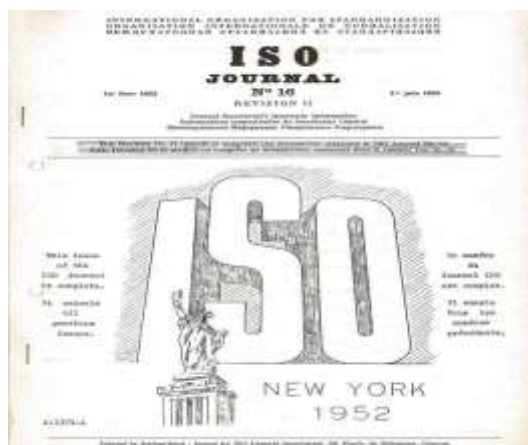
Slika 1. naslovnica ISO časopisa iz svibnja 1952.

Priča o ISO, skraćeno od International Organization for Standardization, odnosno Internacionalna organizacija za standardizaciju, počinje davne 1946. godine u Londonu, kada se sastalo 65 delegata iz 25 zemalja svijeta kako bi razgovarali o budućnosti međunarodne standardizacije. Već 1947. ISO useljava u svoje urede u jednu privatnu kuću u Ženevi. Godine 1951. nastaje prva norma koja se nazivala preporukom, nazvana ISO/R1:1951 Standardna referentna temperatura za mjerenja industrijske duljine. Od tada je norma više puta ažurirana i sada je ISO 1: 2002 Geometrijske specifikacije proizvoda (GPS) - Standardna referentna temperatura za geometrijske specifikacije proizvoda. Naslovnica ISO časopisa (slika 1) prikazuje časopis iz svibnja 1952.