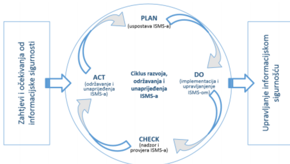
Slika 6. Shema PDCA ciklusa [38]