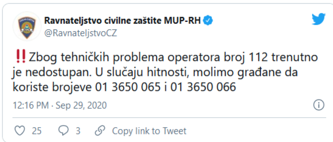
Slika 7. MUP obavijest o nedostupnosti [41]

društva, kada su dobrovoljni vatrogasci stigli u vatrogasni dom i htjeli se javiti dežurnome u VOC putem fixne linije nisu mogli stupiti u kontakt jer fixne telefonske linije nisu radile. U kontakt je stupljeno preko mobilne mreže. Intervenciji je prethodio potres. Primjerice u Hrvatskoj se 29. rujna 2020. godine dogodio pad telekomunikacijske mreže, te je time bila onemogućena komunikacija sa hitnim i žurnim službama. Padu telekomunikacijske mreže se pripisuje tehnički kvar. Najveći problem kod ovog događaja je to da ljudi nisu mogli dobiti broj 112, policiju, vatrogasce i Hitnu pomoć što ima za posljedicu da službe ne mogu reagirati te odgovoriti na svoje zadatke i pomoći unesrećenima. Ravnateljstvo CZ MUP-RH je objavilo obavjest putem Twitter-a.