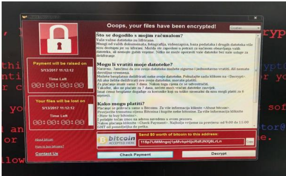
Slika 3. Primjer obavijesti ransomwarea [11]

Na slici 3. se može vidjeti jedan primjer ransomwarea . Mogu se uočiti tri dijela. Prvi sadrži poruku sa objašnjenjem nastale situacije. Drugi dio je vezan za upute za ispunjavanje zahtjeva i vraćanja kontrole nad računalom, a treći i posljednji dio sadrži podatke o načinu plaćanja. U slučaju neisplate navedene svote novca u određenom vremenu spominje se sankcija u obliku brisanja podataka sa računala, trajnog zaključavanja pristupa računalu i sličnog.