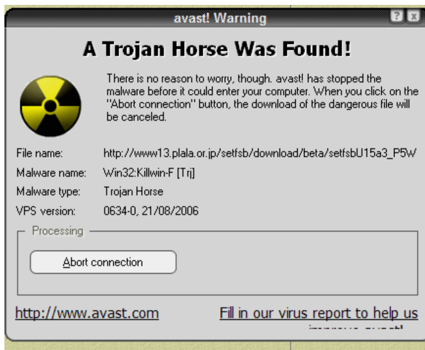
Slika 2. Upozorenje o pronalasku trojanskog konja na računalu [9]

Na slici 2. je prikazana poruka koja se može pojaviti u slučaju pronalaska trojanskog konja na računalu preko antivirusnog programa. Antivirusni programi mogu predstavljati vrlo važan alat u pronalasku i eliminaciji potencijalno sumnjivih programa.